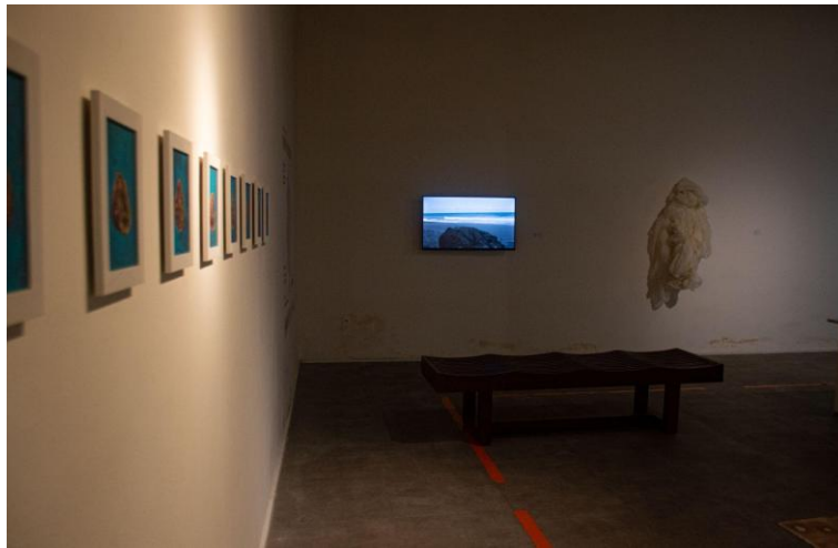
Imagem 1. Leandro Garcia. A visão móvel de uma pedra estática, vídeo, 6 minutos, 2021.

ondas do mar no horizonte. Não há presença de pessoas nas imagens, entretanto, a câmera não está parada, ela nos leva, em plano contínuo, para diferentes ângulos e, por vezes, nos aproxima do oceano. O som do movimento das ondas contrasta com a experiência de contemplação, pois, não há o silêncio apropriado, mas sim uma força sonora que toma conta da entrada da galeria. Quem assiste o movimento do mar?