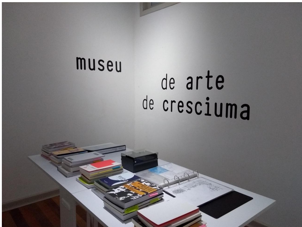
Imagem 2. Letreiro, arquivo e biblioteca , Museu de Arte de Criciúma, 2020, Centro Cultural Jorge Zanatta, Criciúma/SC.