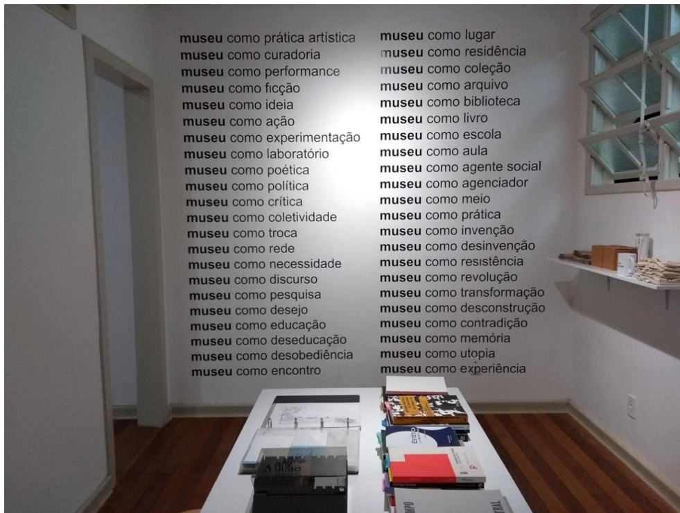
Imagem 1. Museu como (lista) , Museu de Arte de Criciúma, 2020, Centro Cultural Jorge Zanatta, Criciúma/SC.