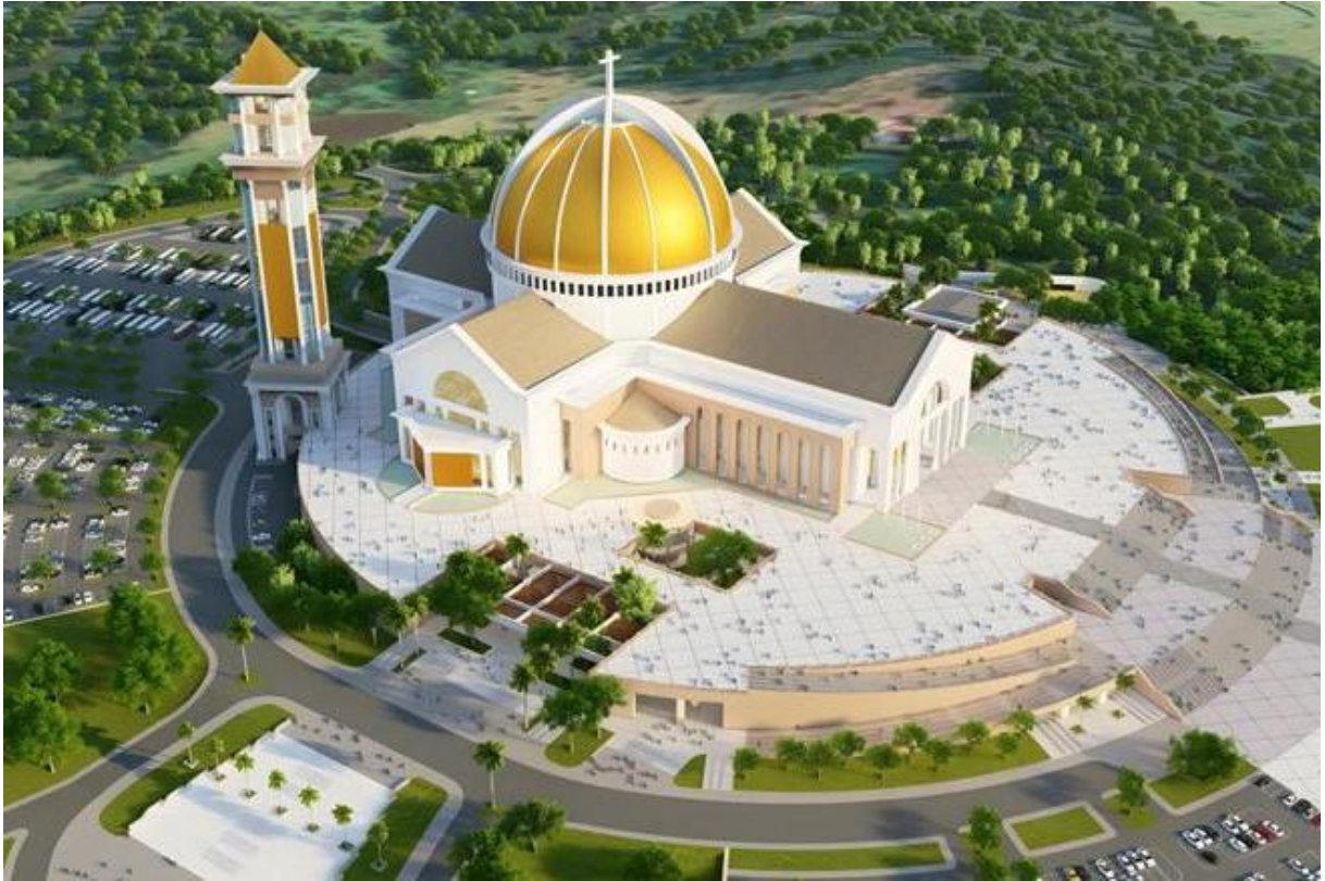
Imagem 2. Maquete Eletrônica da Nova Casa do Pai.

do Vox Patris em Cracóvia foi resultado da combinação de infraestrutura, expertise técnica e tradição na arte de fundir sinos de grande porte.