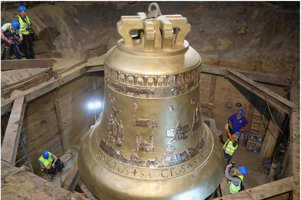
Imagem 1. Vox Patris na fundição.

Além desta, a “Romaria de Carros de Bois da Festa do Divino Pai Eterno de Trindade, em Goiás, foi reconhecida como Patrimônio Cultural Brasileiro, em 2016, e inscrita no Livro de Registro das Celebrações”(BOAVENTURA; SILVA, 2021, p. 21).