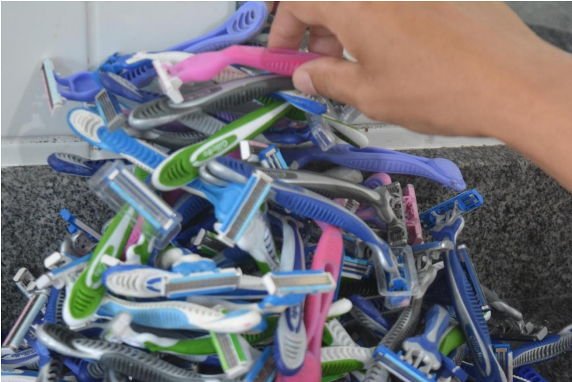
Imagem 5: Gabi Assusção, G.I.L.E.T.E. 02, Foto performance. 1240 x1755. Rio Grande - RS.