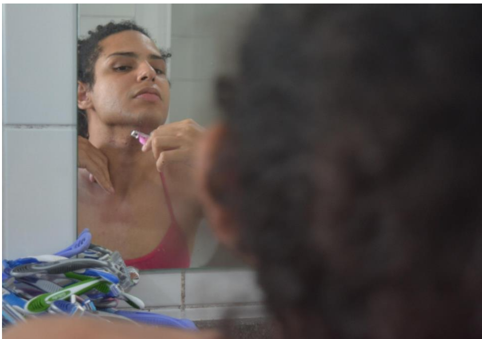
Imagem 2: Gabi Assusção G.I.L.E.T.E. 00, 2023. Foto performance. 1240 x1755. Rio Grande - RS.