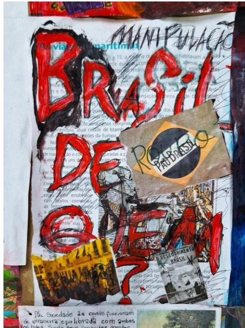
Imagem 4. Atividade desenvolvida na E.E Mário Quirino da Silva, 2025.

conhecimento, promovam a construção de mundos pluriversais e sustentáveis em termos ambientais (humanos e não humanos).