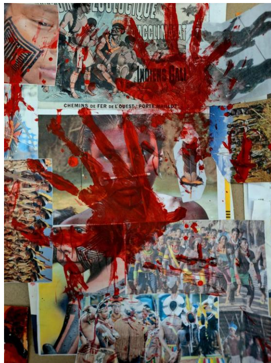
Imagem 2. Atividade desenvolvida na E.E Mário Quirino da Silva, 2025.

O estudo apoia-se numa rede teórica que articula arte contemporânea, pedagogia crítica latino-americana e teorias decoloniais. Freire (2021), hooks (2017) e Walsh (2005) concebem a sala de aula como espaço de produção de saberes, não mera transmissão. Nessa chave, a arte/educação assume papel central de mediação entre experiência estética e consciência social - arte/educação dissidente (Wosniak, 2022; 2023). Ao dialogar com geopolíticas do sentir/pensar/fazer e estética decolonial (Gómez, 2019; Mignolo, 2010; 2019), emerge a figura do artista-professor-pesquisador enquanto “agenciador de sentidos” que relaciona materialidade, contexto e agência crítica.