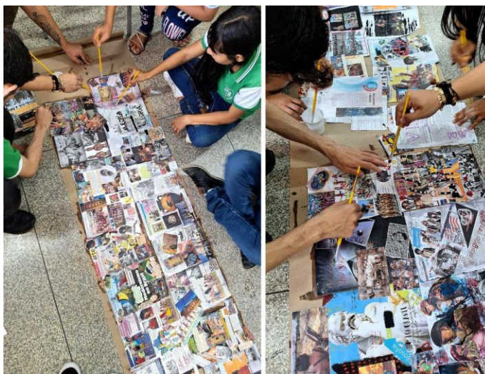
Imagem 1. Atividade desenvolvida na E.E Mário Quirino da Silva, 2025.

KEYWORDS: Dissident Art/Education. PIBID. Research-Creation. Decoloniality.