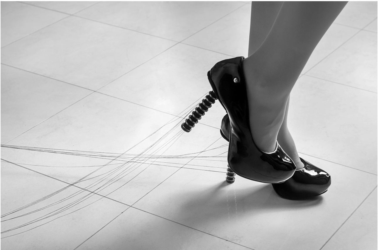
Imagem 4: Larissa Camnev, "Sair da linha" (série A única mulher que andou na linha, o trem matou) [4], fotoperformance, Campinas, 2023.