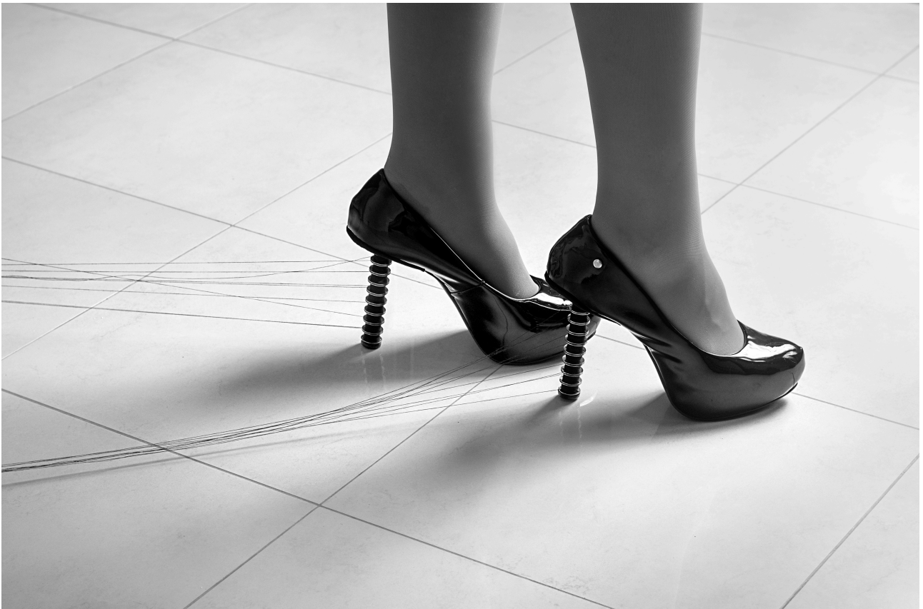
Imagem 3: Larissa Camnev, "Sair da linha" (série A única mulher que andou na linha, o trem matou) [3], fotoperformance, Campinas, 2023.