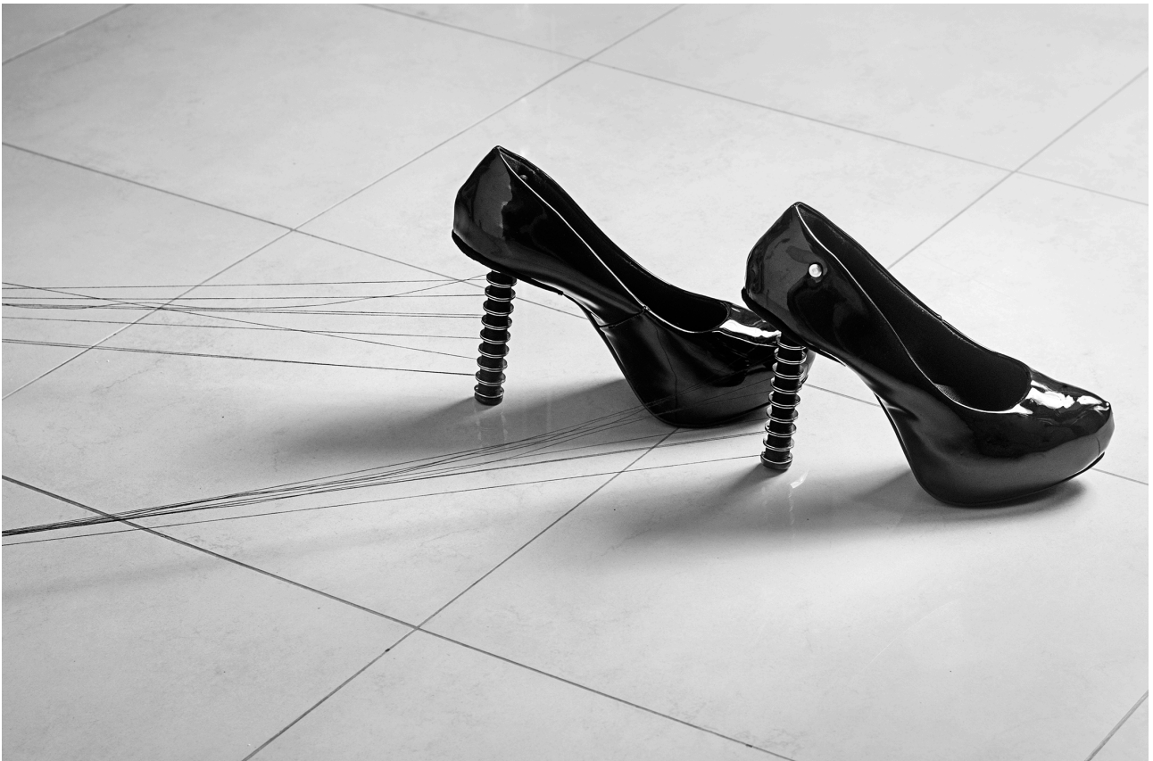
Imagem 1: Larissa Camnev, "Sair da linha" (série A única mulher que andou na linha, o trem matou) [1], ftoperformance, Campinas, 2023.