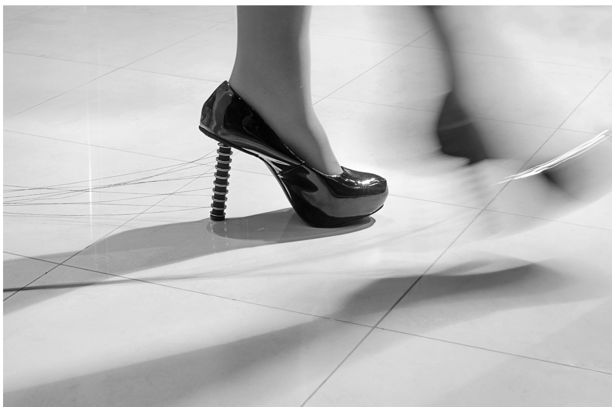
Imagem 6: Larissa Camnev, "Sair da linha" (série A única mulher que andou na linha, o trem matou) [6], ftoperformance, Campinas, 2023.