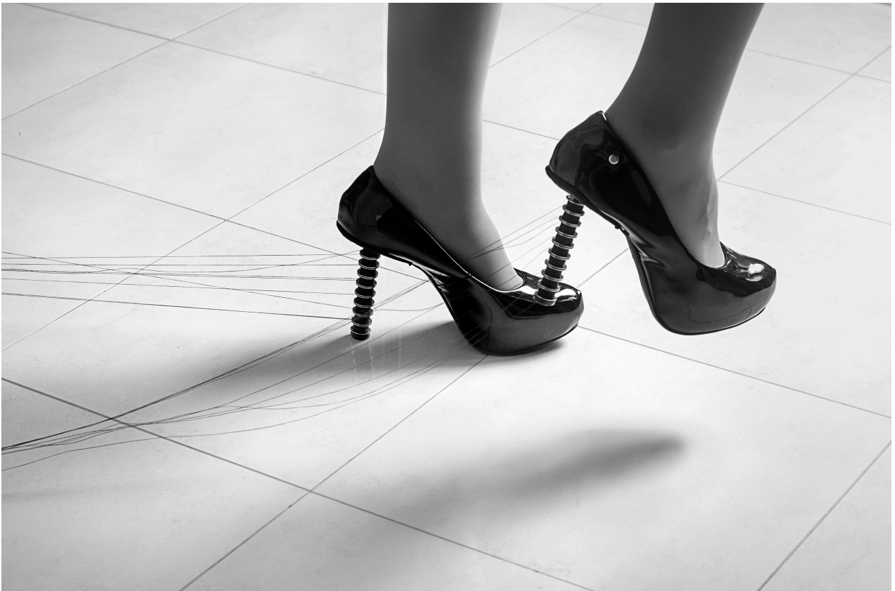
Imagem 5: Larissa Camnev, "Sair da linha" (série A única mulher que andou na linha, o trem matou) [5], fotoperformance, Campinas, 2023.