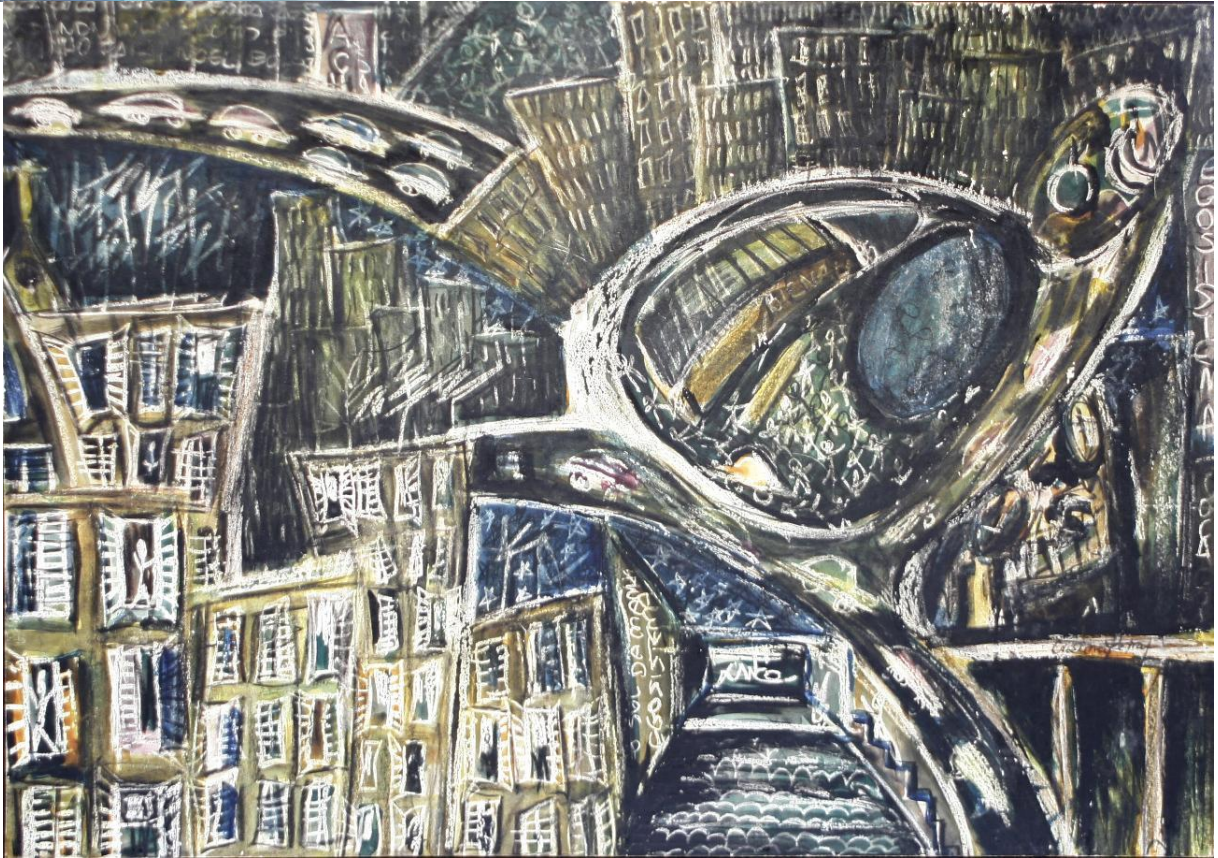
Imagem 1: Ego-sistema Coca-Cola

No lado direito inferior da pintura desenhei filas de cadeiras de teatro vistas do fundo da platéia; pareceu-me poder ter representado tanto o teatro quanto o cinema com sua tela retangular a potencializar sonhos. Na época, pintei alguns cenários para o Teatro Guaíra, incluindo telões de dez por onze metros, experiência que marcou profundamente tanto meu sentido de escala quanto o entendimento da dificuldade de preservação, que não fosse por meio de fotografias. Também no lado direito, embaixo dos prédios e em cima do teatro, insisto em ver uma tartaruga, seu corpo, na minha intenção pictórica, representa o parque do Ibirapuera com o pavilhão da Bienal e o lago; o sentido imagético de sua cabeça fugiu de minha memória. Sob o corpo da tartaruga, minha sala de jantar, não mais em São Paulo, mas na cidade onde moro, uma espécie de garantia da volta ao lar. Recordo-me de procurar retratar uma noite de sopa com o marido e a filha.