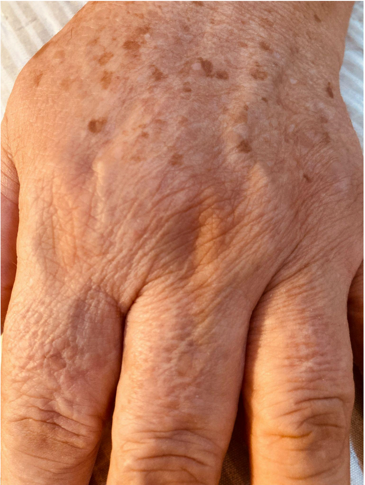
Imagem 5. Monique Araújo, Desenhar com o tempo. Fotografia. Rio de Janeiro. 2025