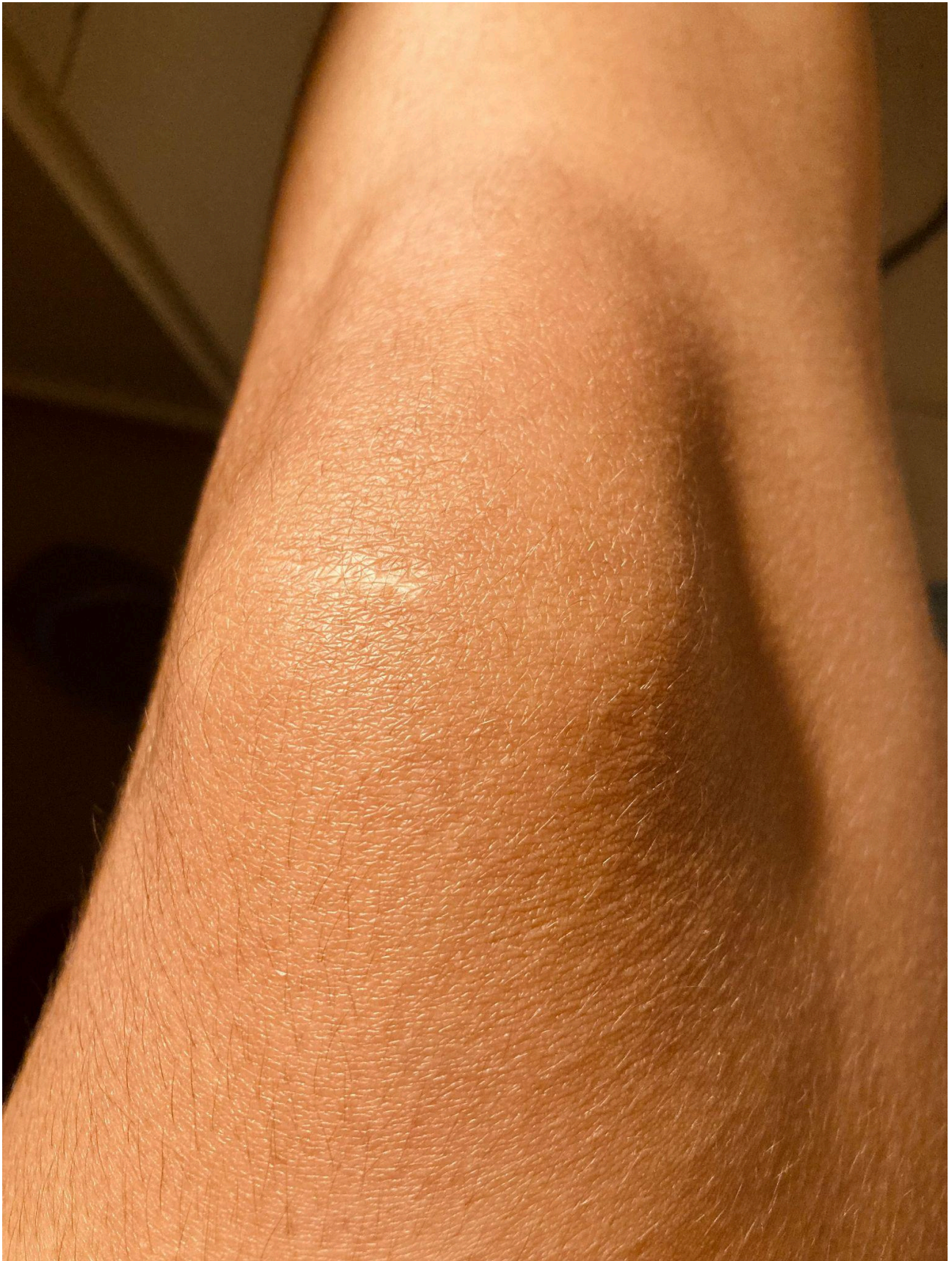
Imagem 4. Monique Araújo, Desenhar com o tempo. Fotografia. Rio de Janeiro. 2025.