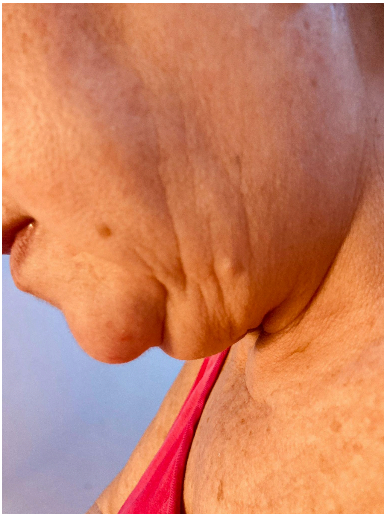
Imagem 2. Monique Araújo, Desenhar com o tempo. Fotografia. Rio de Janeiro. 2025.