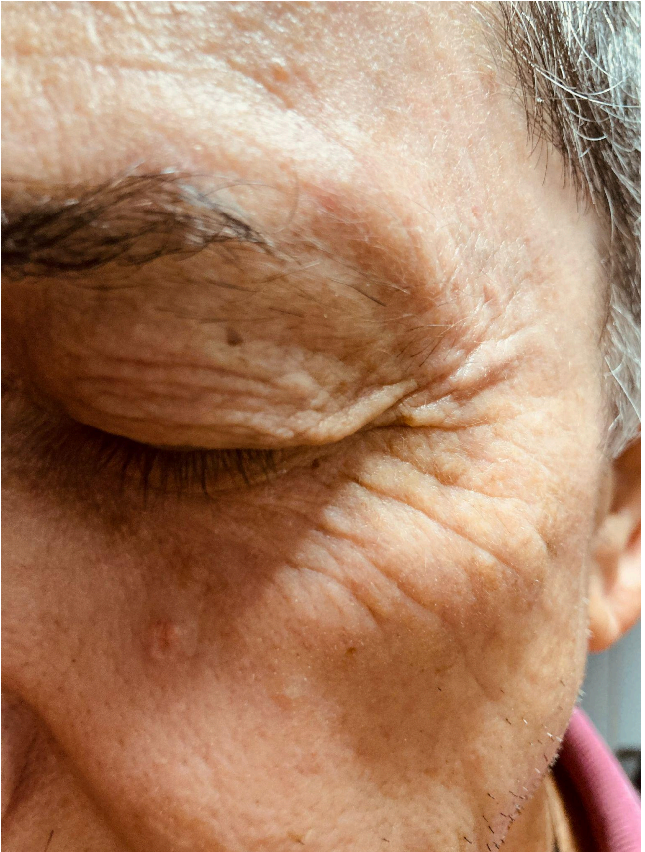
Imagem 3. Monique Araújo, Desenhar com o tempo. Fotografia. Rio de Janeiro. 2025.