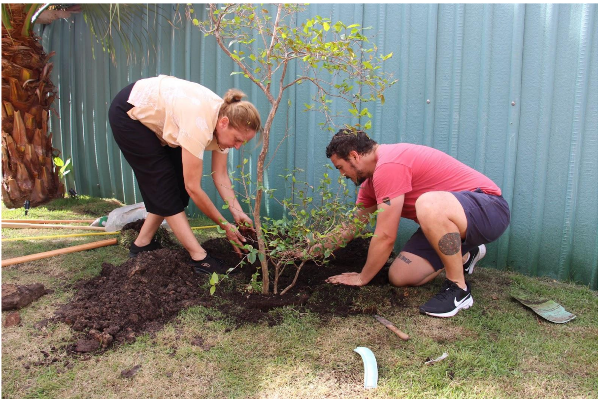
Imagem 1. Vingar | Eugenia uniflora . Porto Alegre, 2024.

A proposição poética do Ecomuseu Urbano 3 intitulada Vingar | Eugenia uniflora , realizada na Remanso - Instituto Cultural, em 2024, como parte da exposição inaugural do instituto, denominada Canteiro de Obras #14, em Porto Alegre/RS, surge como uma fagulha do pensamento para essa escrita. Em Vingar | Eugenia uniflora o Ecomuseu Urbano participou realizando seu procedimento poético O Ato de Implantar 5 (Imagem 1), inserindo no jardim do espaço cultural uma pitangueira ( Eugenia uniflora ) junto a um pássaro morto encontrado em uma caminhada pela cidade de Porto Alegre.