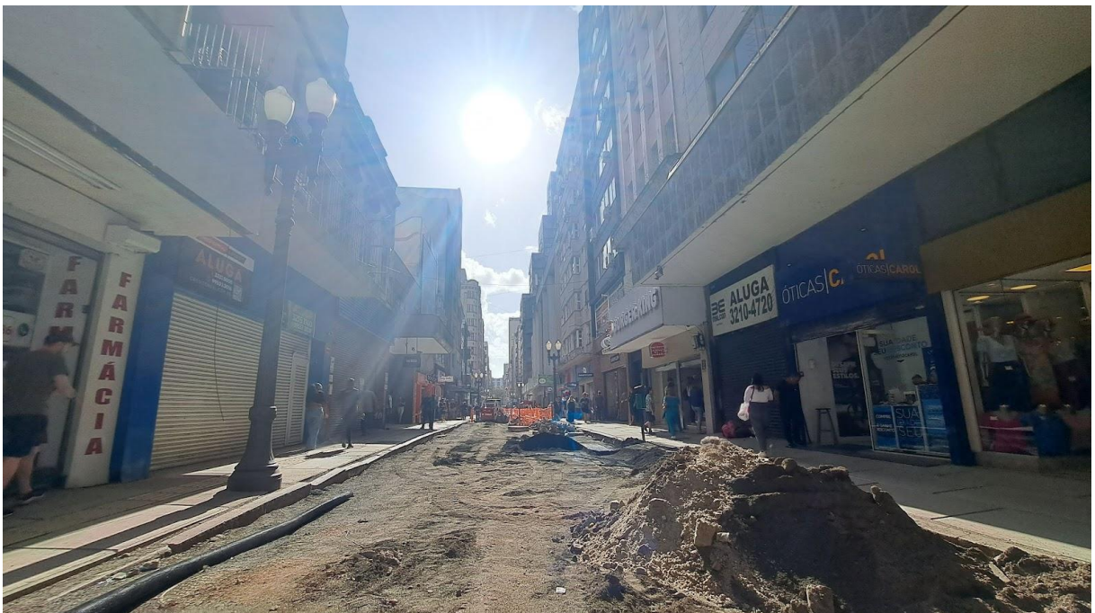
Imagem 7. Obras. Porto Alegre, 2024.

No contexto atual, em nossa escrita e, a partir da reflexão do trabalho de Denes que nos faz pensar sobre O Ato de Implantar, o que seria arte pública na contemporaneidade e qual mundo possível ainda seria possível pensar como alternativo à essa Cidade como Negócio (Imagem 7)?