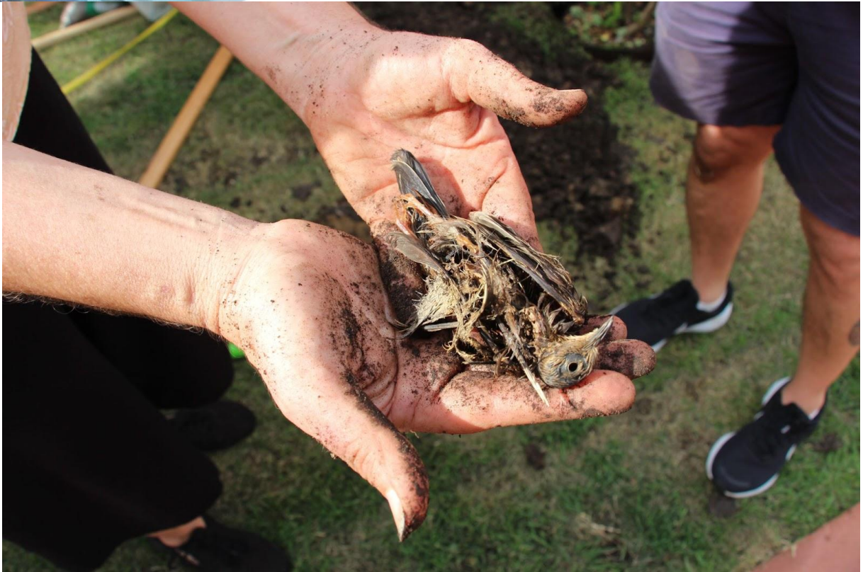
Imagem 4. Vingar | Eugenia uniflora . Porto Alegre, 2024.

Em 2025, ao observar Porto Alegre em contínuas obras de “requalificação do centro da cidade”, tendo participado da exposição Canteiro de Obras #1 a partir de nossa prática artística implantada até então no espaço público, após a termos inserido no contexto privado do jardim, na medida em que voltamos para o espaço público para realizar a mesma ação, nos perguntamos como pensar de modo crítico sobre qual o papel dos processos artísticos em arte pública na construção da ideia de uma cidade que trataria o espaço público como privado?