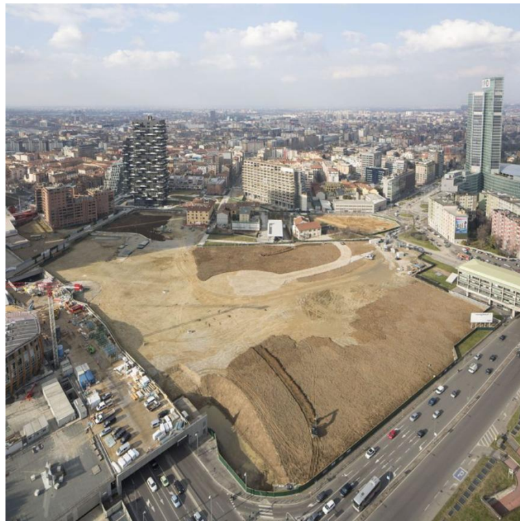
Imagem 6. Wheatfield. Milão, 2015.