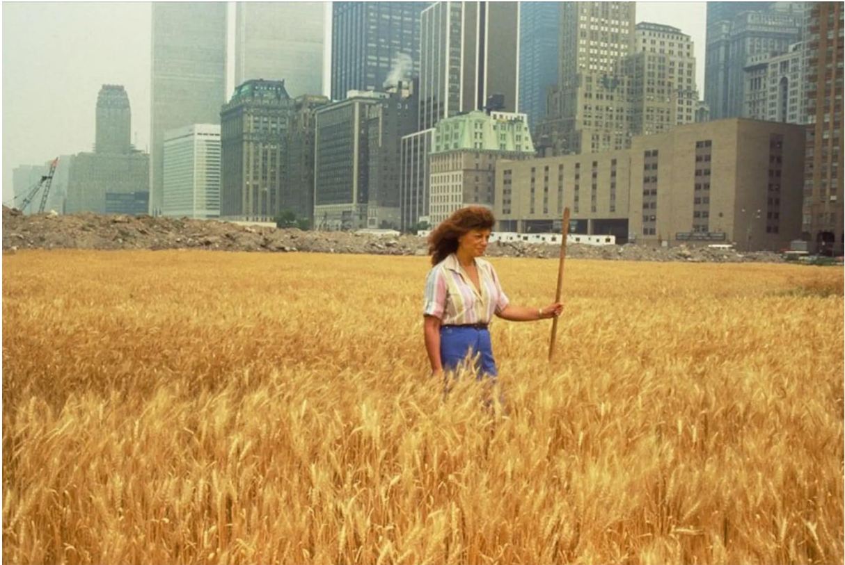
Imagem 5. Wheatfield – A Confrontation . Nova York, 1982. Créditos: Agnes Denes

(Imagem 5) traz Denes em meio ao campo de trigo, tendo ao fundo a imagem dos arranha-céus de Wall Street, centro econômico de Nova York.