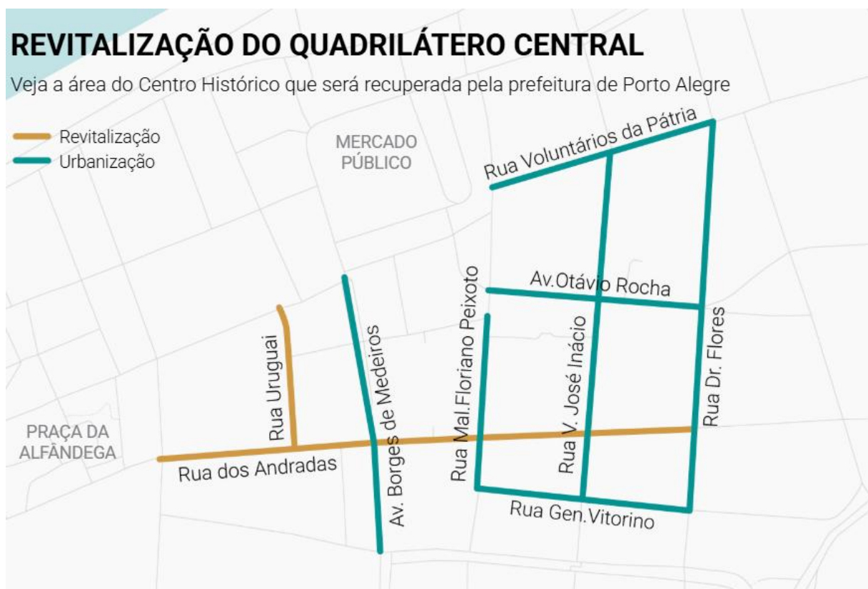
Imagem 2. Projeto Revitalização Quadrilátero Central, 2022. Design: Zero Hora.

Atualmente a consulta popular através do OP sobre o direcionamento dos recursos públicos ainda se mantém em Porto Alegre, mas observamos que suas pautas se modificaram, bem como os recursos canalizados para esse orçamento; em 2024, por exemplo, desde a sua criação, foi destinado o menor valor de orçamento para a moradia social 6 . Observa-se também que, nos últimos anos, se intensificaram as concessões para administração compartilhada da cidade entre prefeitura e empresas, com as parcerias público-privadas passando a ter protagonismo na definição, organização e gestão do espaço urbano de Porto Alegre.