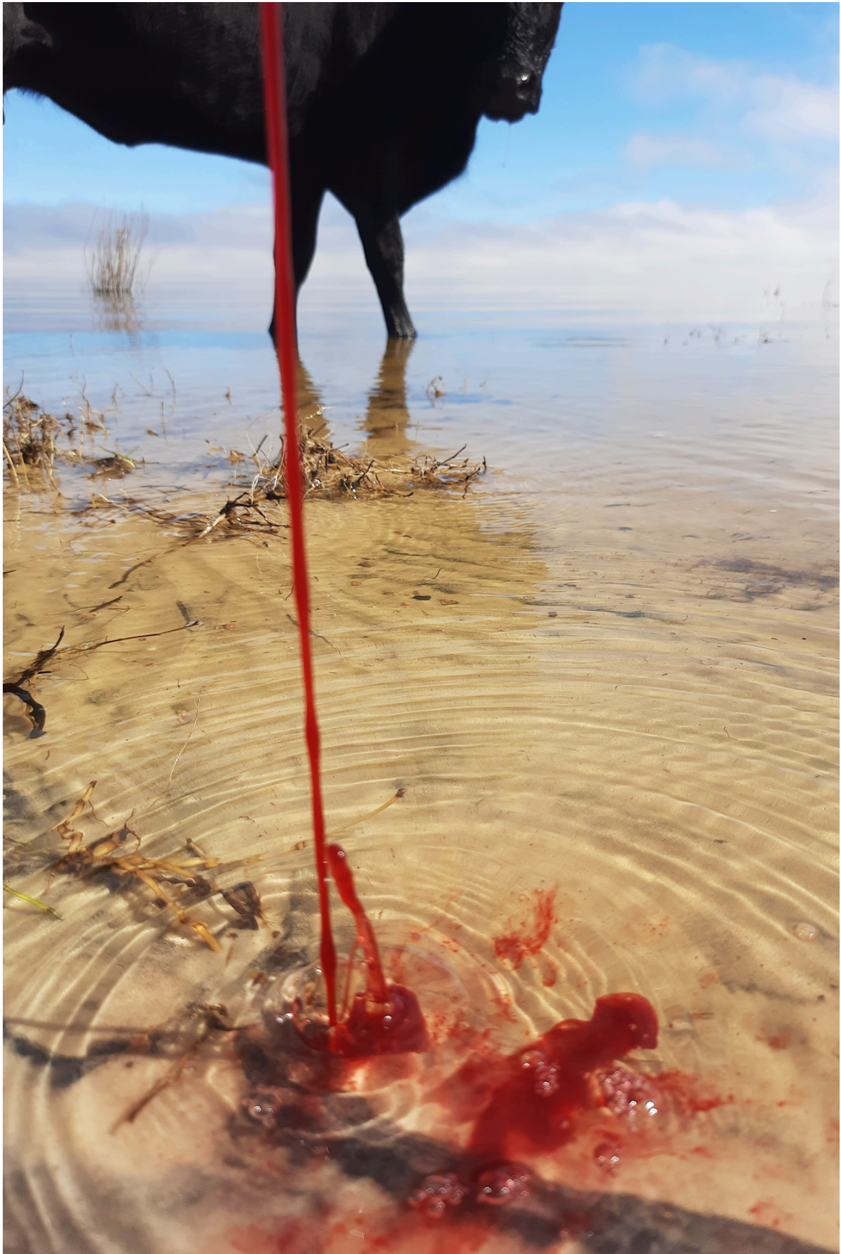
Imagem 9: Yasmin Fortes, Rastros, site-specific, 12,7cm X 19,05cm, Rio Grande, 2024. Foto: Yasmin Fortes, 2024.