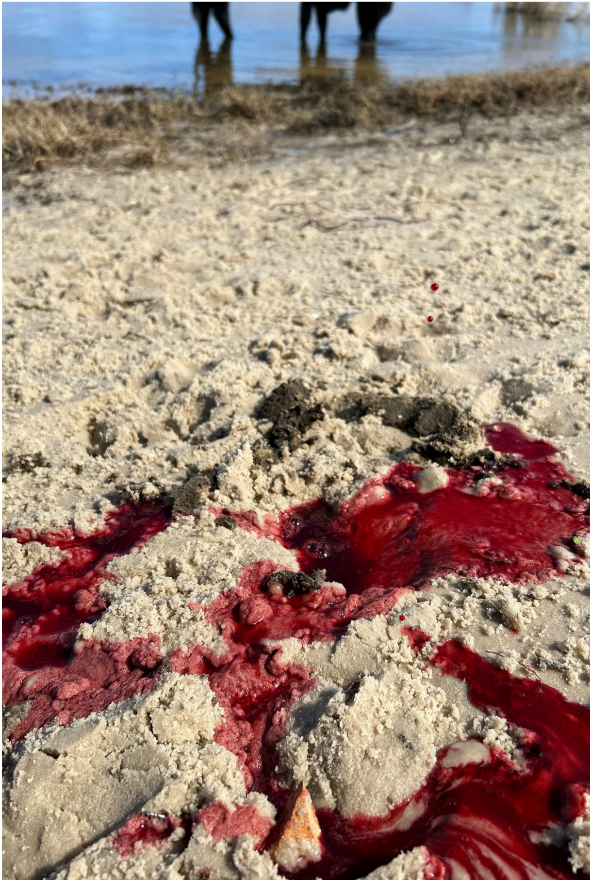
Imagem 7: Yasmin Fortes, Rastros, site-specific, 12,7cm X 19,05cm, Rio Grande, 2024.