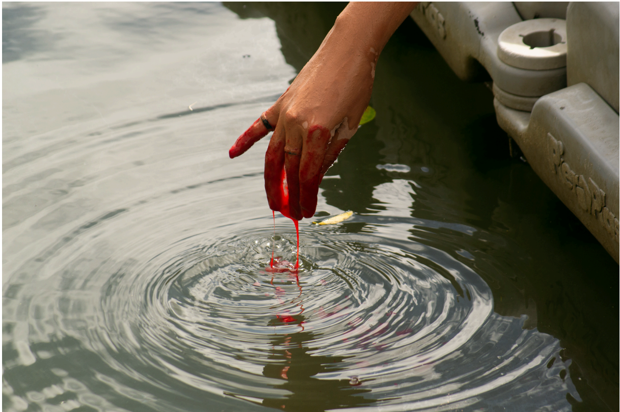
Imagem 2: Yasmin Fortes, Laguna de Sangue, fotoperformance, 19,05cm X 12,7cm, Rio Grande, 2024.