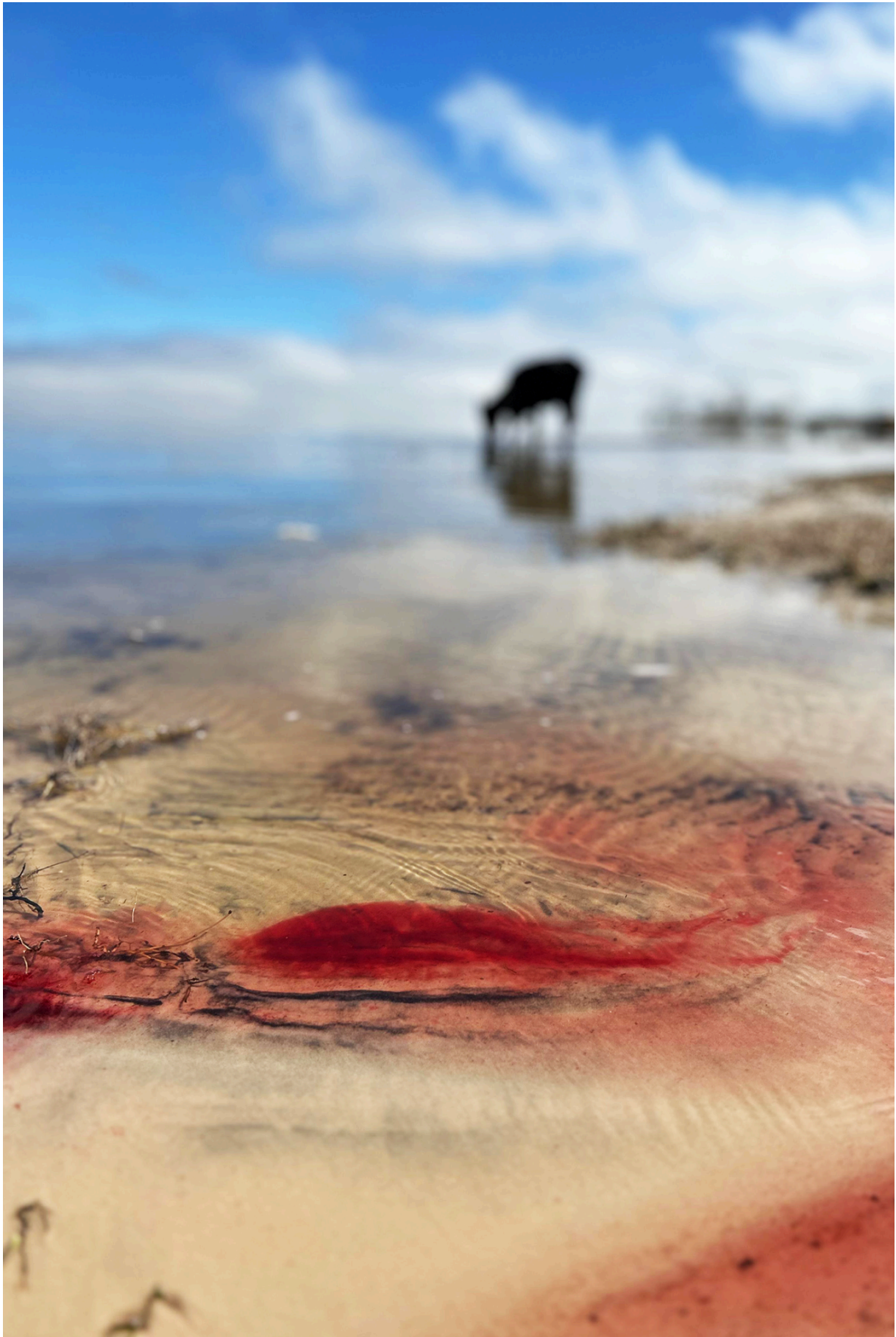
Imagem 10: Yasmin Fortes, Rastros, site-specific, 12,7cm X 19,05cm, Rio Grande, 2024.