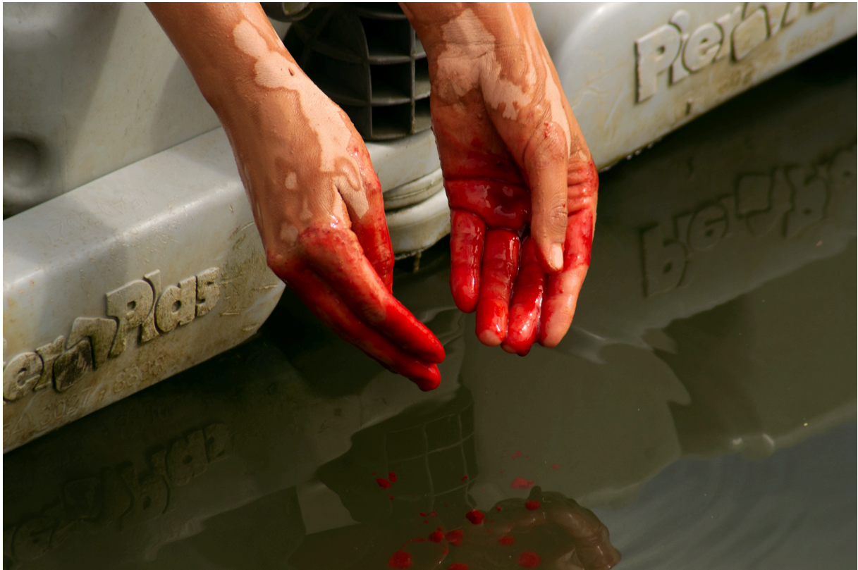
Imagem 3: Yasmin Fortes, Laguna de Sangue, fotoperformance, 19,05cm X 12,7cm, Rio Grande, 2024.