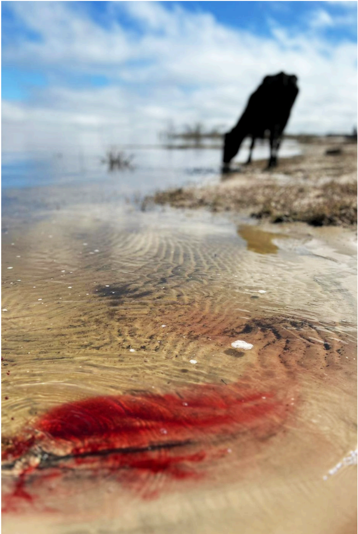
Imagem 8: Yasmin Fortes, Rastros, site-specific, 12,7cm X 19,05cm, Rio Grande, 2024.