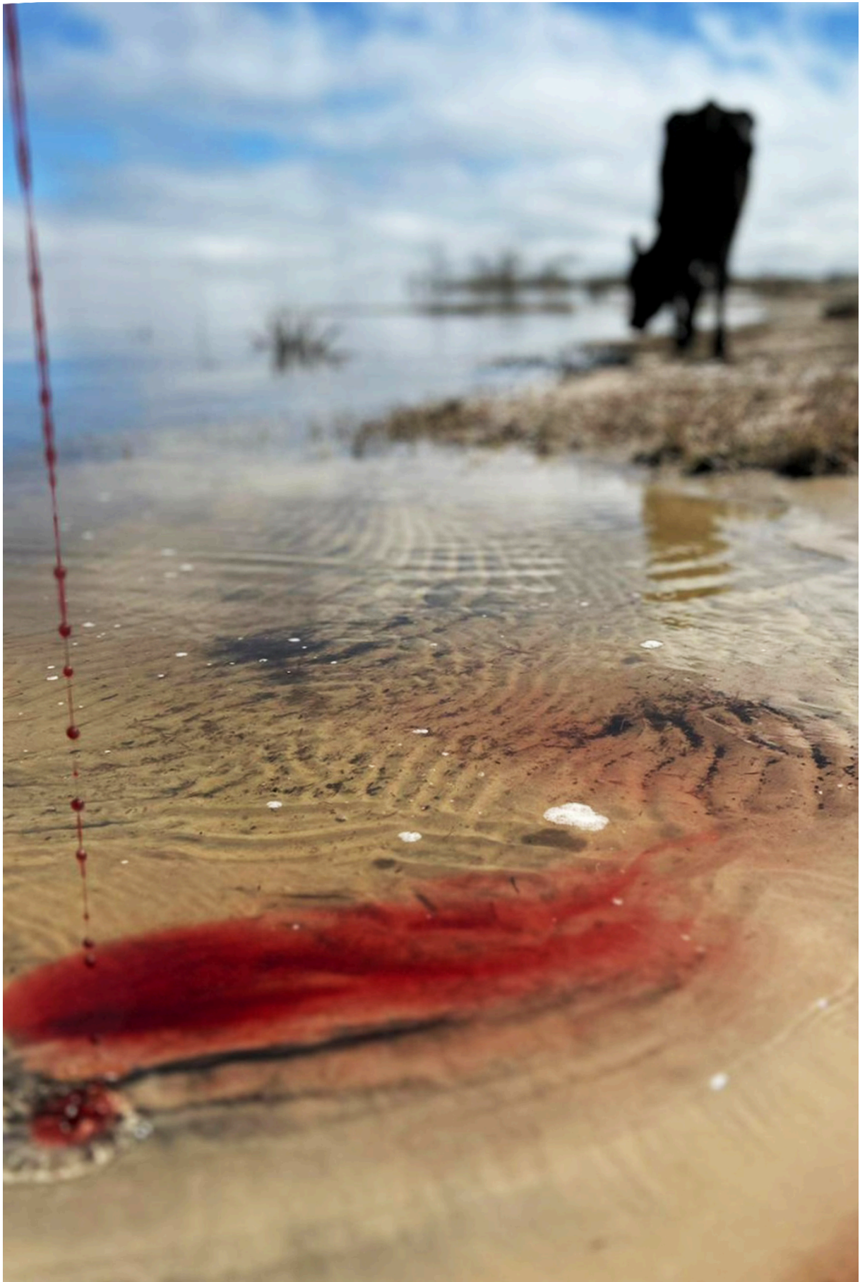
Imagem 6: Yasmin Fortes, Rastros, site-specific, 12,7cm X 19,05cm, Rio Grande, 2024.