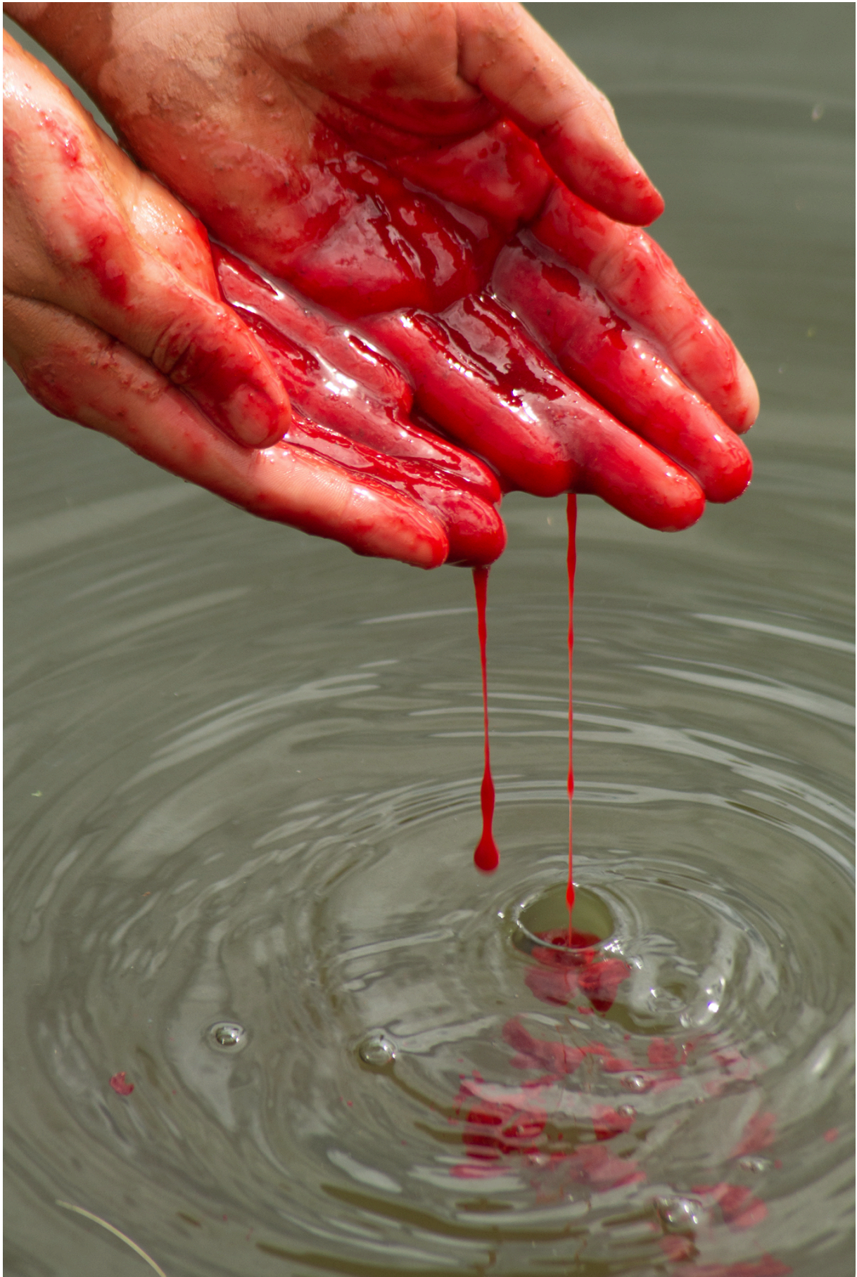
Imagem 5: Yasmin Fortes, Laguna de Sangue, fotoperformance, 12,7cm X 19,05cm, Rio Grande, 2024.