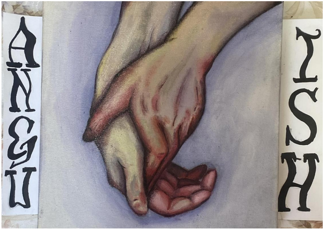
Imagem 5. Júlia Goulart, "Anguish", 2024. Pintura acrílica, 26cm X 20cm.