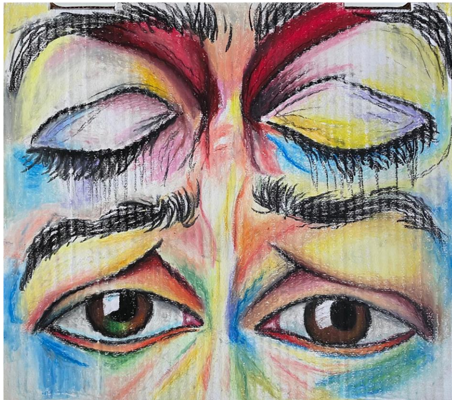
Imagem 2. Júlia Goulart, "Suscetível", 2024. Pintura em giz pastel oleoso, 35cm X 35cm.