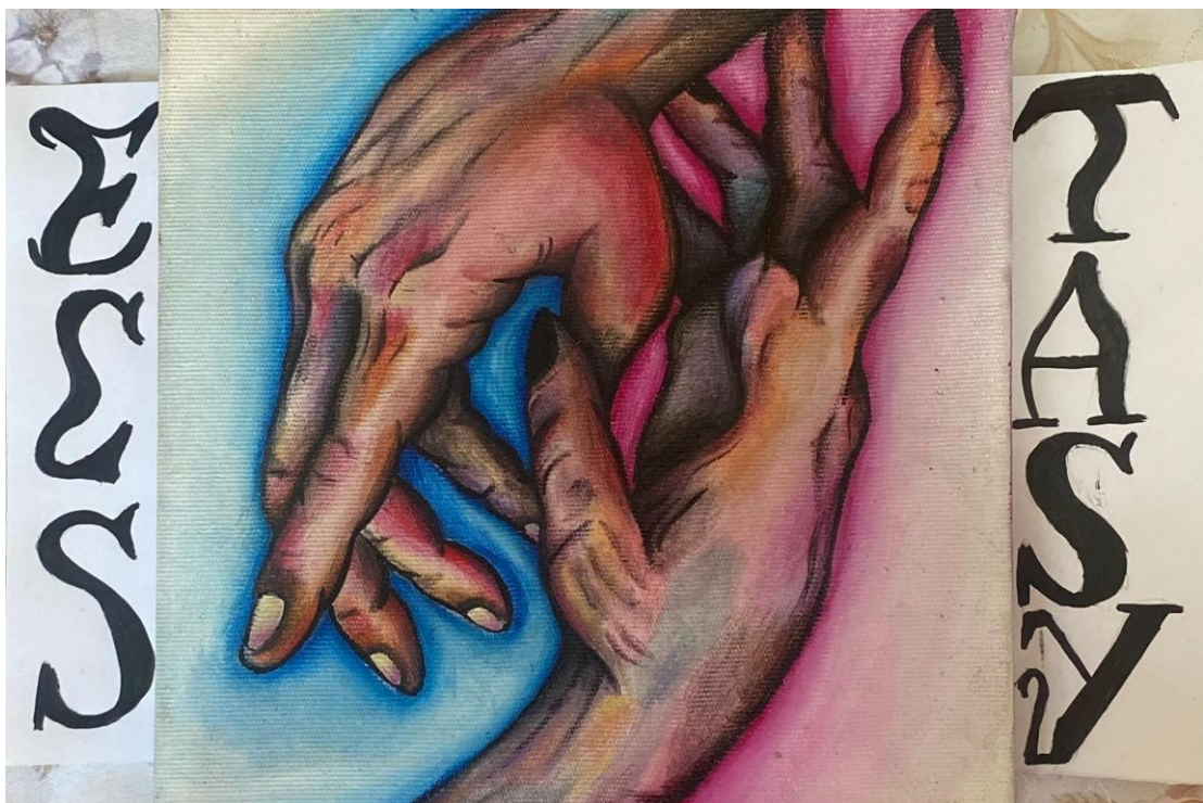
Imagem 6. Júlia Goulart, "Ecstasy", 2024. Pintura acrílica, 10cm X 10cm.