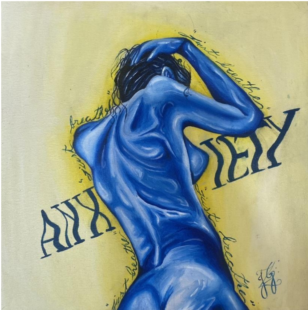
Imagem 4. Júlia Goulart, "Anxiety", 2024. Pintura acrílica, 30cm X 30cm.

Além disso, as mãos surgem como elementos simbólicos potentes. Pinturas com mãos gestuais (Imagens 5 e 6) propõem nova linguagem visual para expressar estados emocionais. Mãos entrelaçadas, contorcidas, em repouso ou tensão funcionam como metáforas visuais da experiência humana. A exploração de partes do corpo humano como território de manifestação emocional reforça a ideia de que a arte pode espelhar vivências íntimas, expressas não verbalmente, mas pelo impacto visual produzido pelas imagens, apresentadas em comunhão com a palavra, já que nas pinturas, elementos textuais também se destacam.