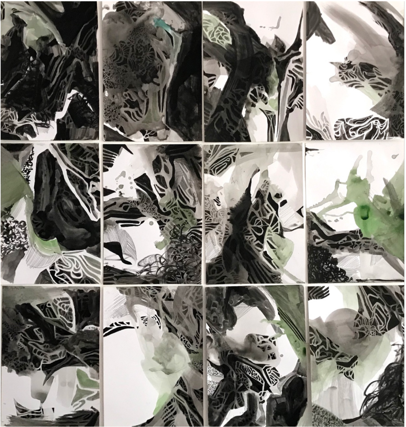
Imagem 9: Regina Pessoa. DESALINHO. Desenho. Nanquim, areia e óleo residual sobre papel. 95cm x 90cm. Rio de Janeiro/RJ. 2025