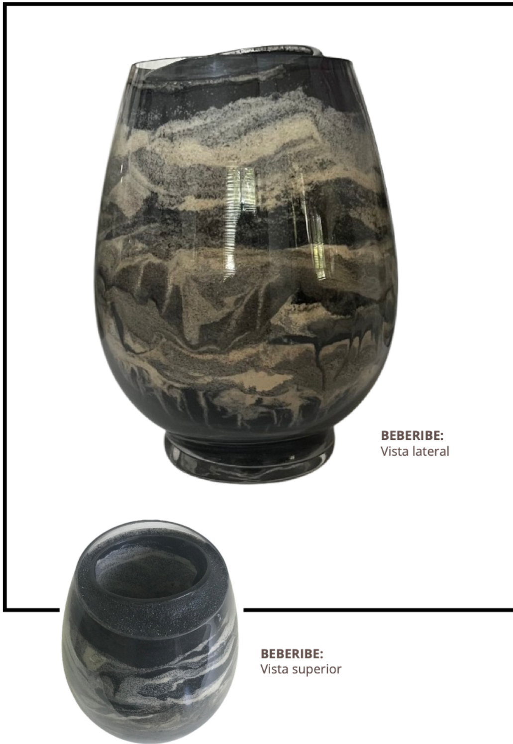
Imagem 4: Regina Pessoa. BEBERIBE. Silicografia. Areia e óleo residual em vidro. 20cm x 15cm x 10cm. Morro Branco/CE. 2019.