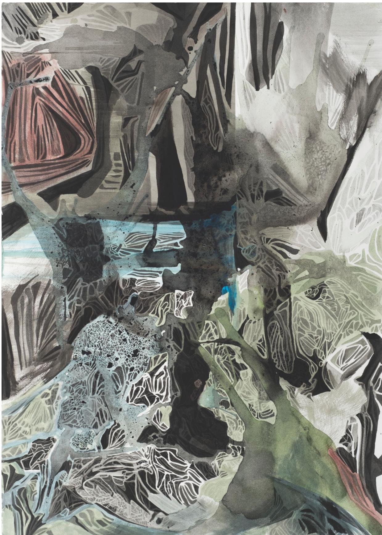
Imagem 1: Regina Pessoa. DUO OU DUALIDADE. Desenho. Nanquim sobre papel. 100cm x 70cm. Brasília/DF. 2019.