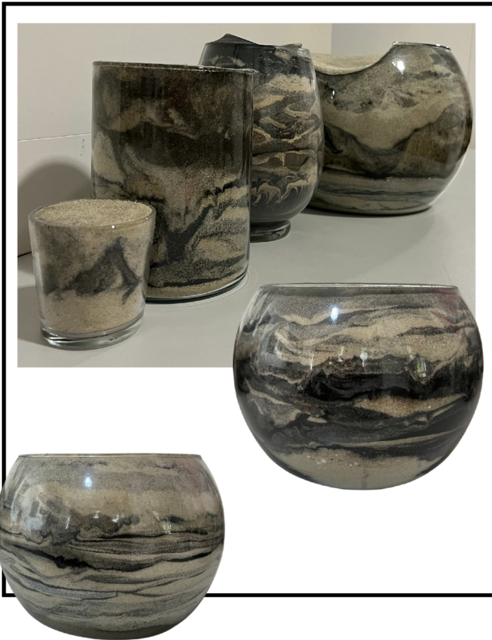
Imagem 5: Regina Pessoa. Outros objetos em silicografia. Areia e óleo residual em vidro. Tamanhos variados. Rio de Janeiro/RJ. 2022.