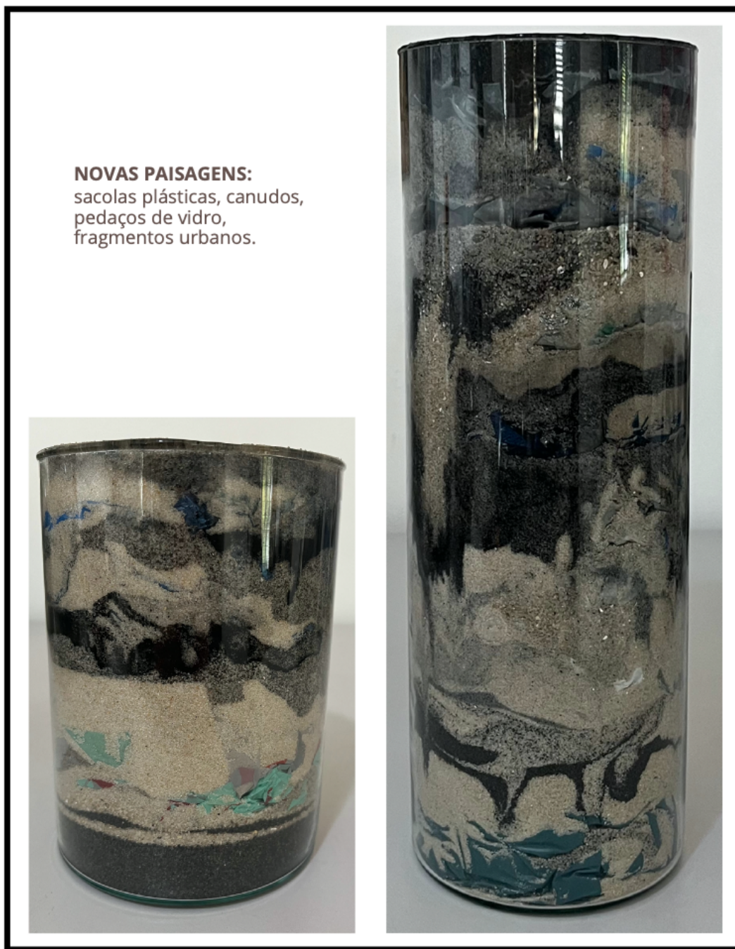
Imagem 6: Regina Pessoa. Silicografias. Areia, óleo residual e outros resíduos urbanos em vidro. Tamanhos variados. Rio de Janeiro/RJ. 2023.