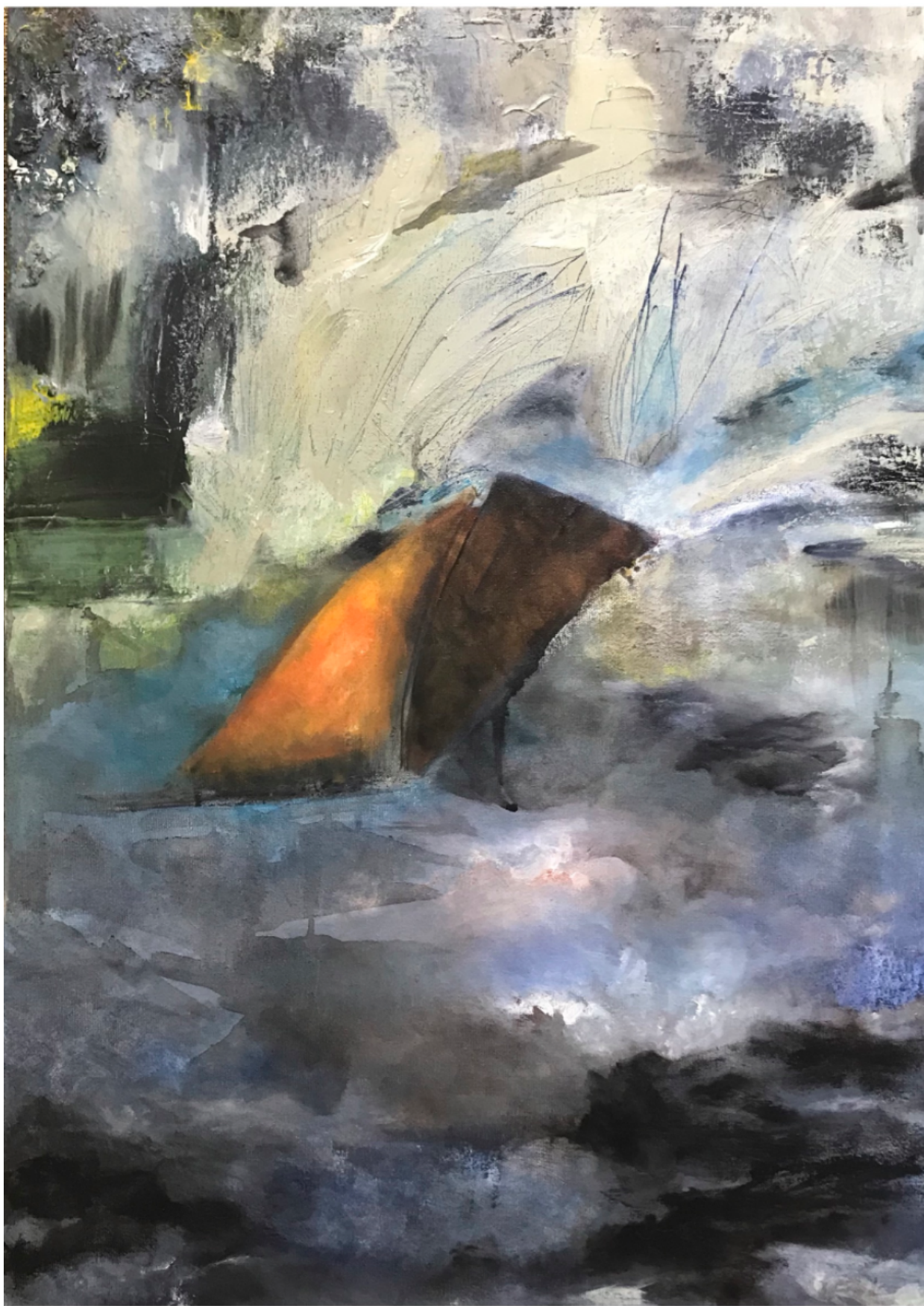
Imagem 2: Regina Pessoa. O MUNDO SEMPRE FOI BELO E TORTO. Pintura. Óleos residual e tinta óleo sobre tela. 70cm x 50cm. Rio de Janeiro/RJ. 2020.