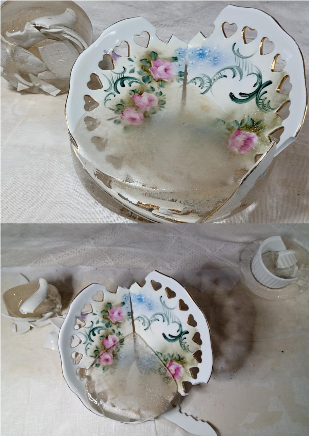
Imagem 1. Nina Eick, Louças se Partirão I , Still do vídeo, Porto Alegre 2021. Disponível em: https://youtu.be/CtmZE3qqBVk