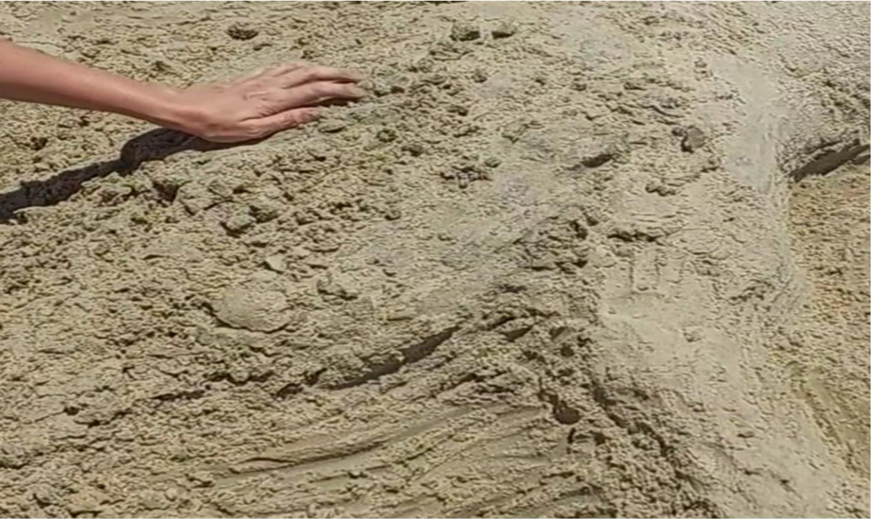
Imagem 7. Nina Eick, Areia , Still do vídeo, Porto Alegre 2024