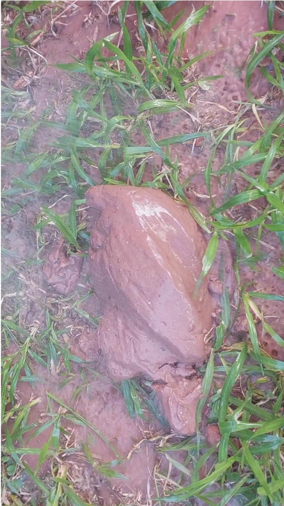
Imagem 4. Nina Eick, Barro , Still do vídeo, Porto Alegre 2025