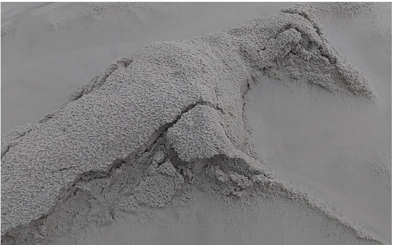
Imagem 10. Nina Eick, Areia , Still do vídeo, Porto Alegre 2024