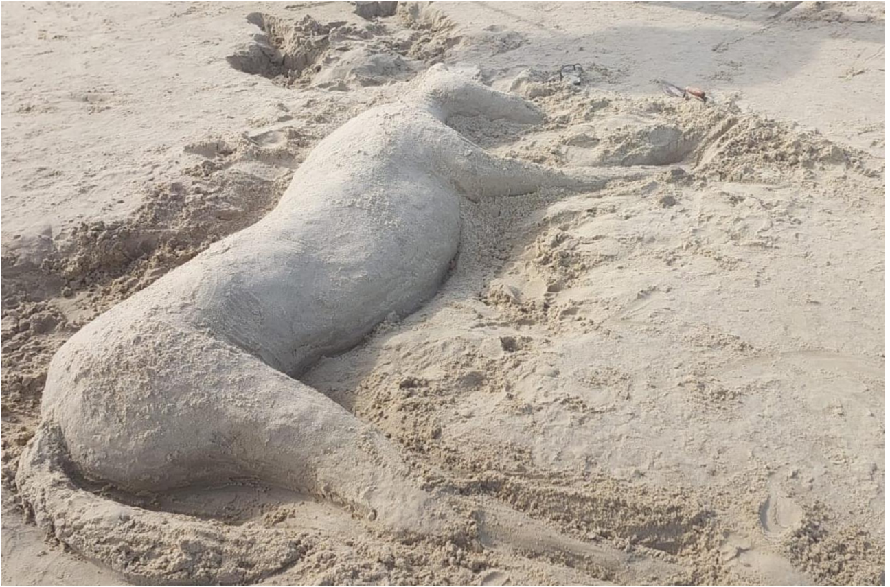
Imagem 9. Nina Eick, Areia , Still do vídeo, Porto Alegre 2024