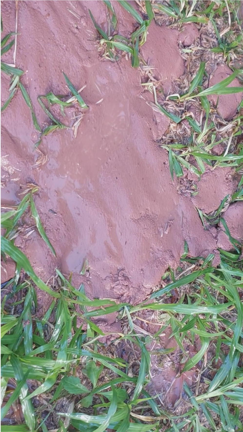
Imagem 5. Nina Eick, Barro , Still do vídeo, Porto Alegre 2025