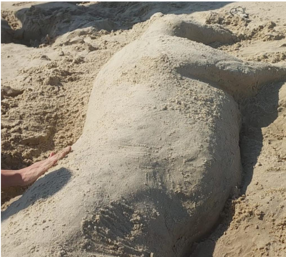
Imagem 8. Nina Eick, Areia , Still do vídeo, Porto Alegre 2024