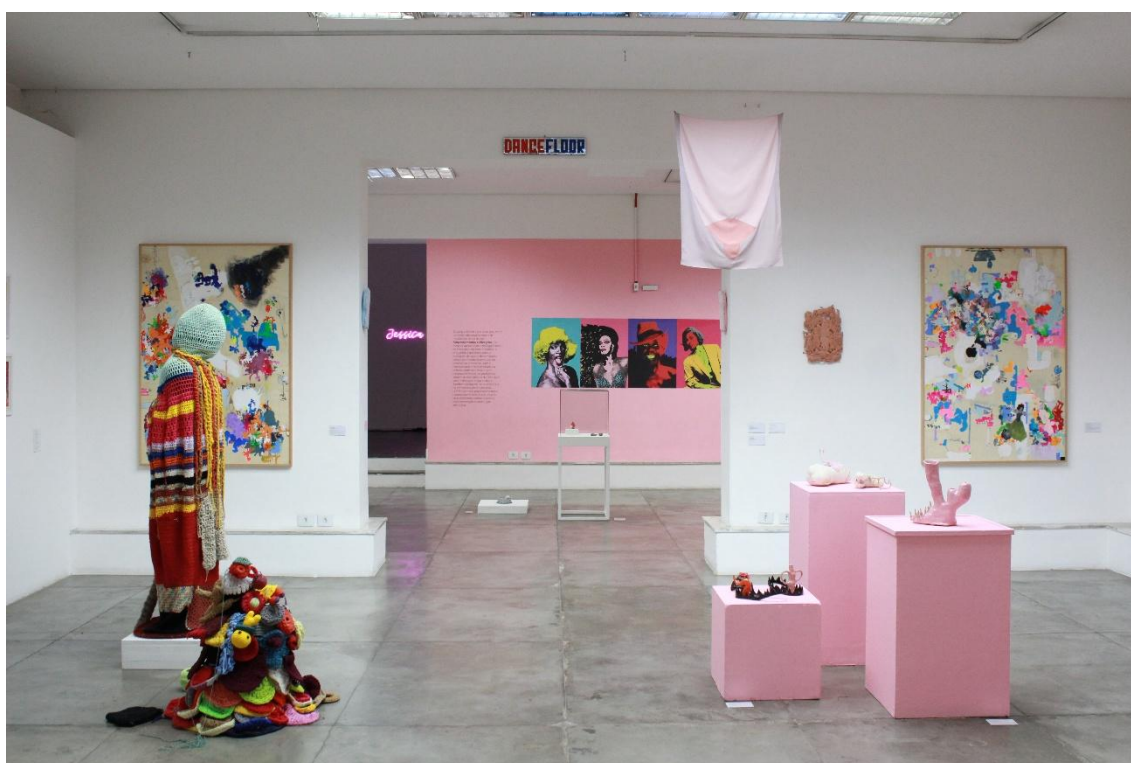
Imagem 1: Vista do eixo curatorial Metamórficas .

ligados ao campo artístico, responsáveis pela “[...] produção, difusão e consumo de objetos e eventos por eles mesmos rotulados como artísticos e responsáveis também pela definição dos padrões e limites da arte para toda uma sociedade [...]” (Bulhões, 1990 apud Bulhões, 2014, p. 15-16).