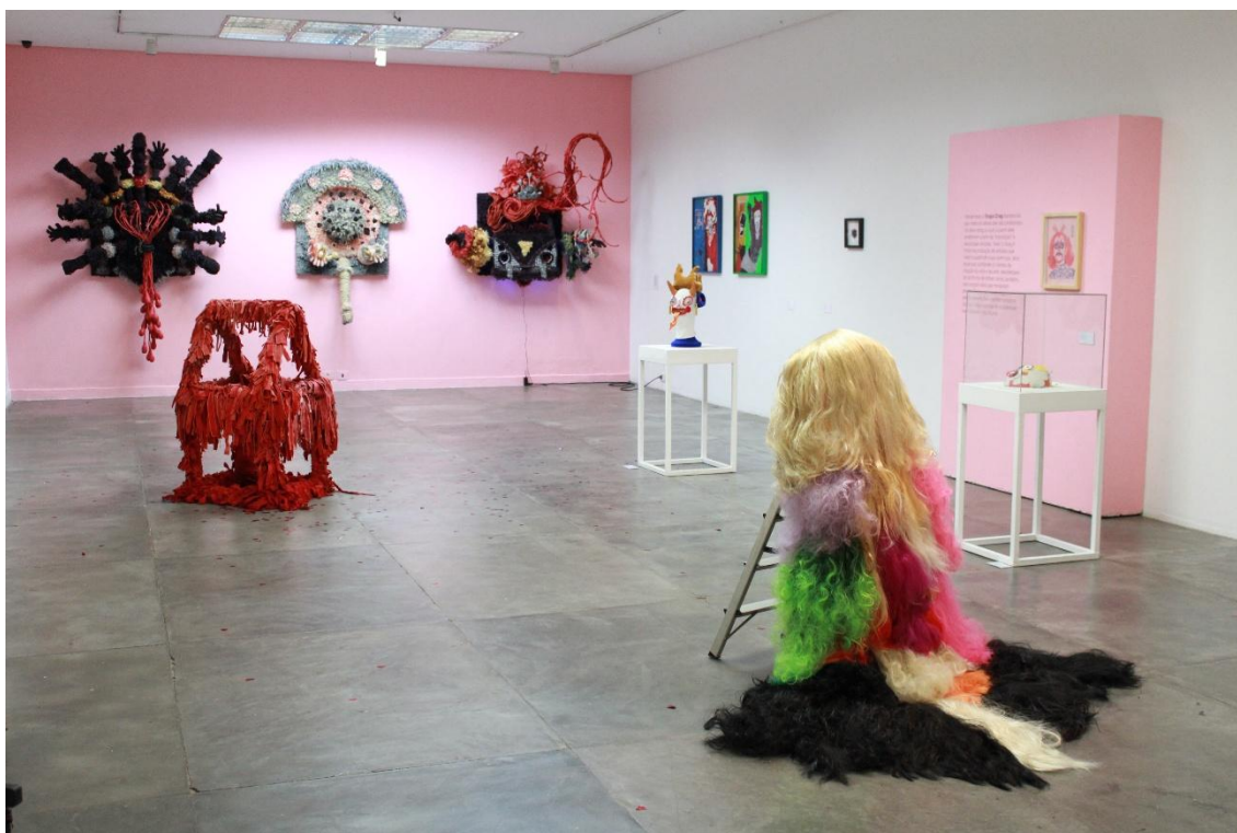
Imagem 4: Vista do eixo curatorial Elogio Drag.

Essa articulação entre discurso e forma, presentificada entre curadoria e expografia, nos propõe a pensar na exposição como um lugar no qual aspectos simbólicos se interrelacionam, no objetivo de produzir regimes de visibilidade. Para Carvalho (2012), a exposição contemporânea deixa de ser mero suporte de apresentação para se configurar como campo de produção simbólica, onde as escolhas curatoriais, espaciais e relacionais constroem significados e subjetividades. No contexto da exposição, o espaço também foi “dragificado”.