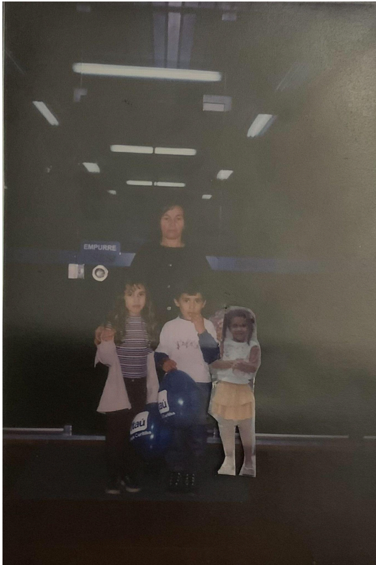
Imagem 3. Vitória Sampaio, Sonho, Colagem, 10cm x 15cm, Rio Grande, 2025.