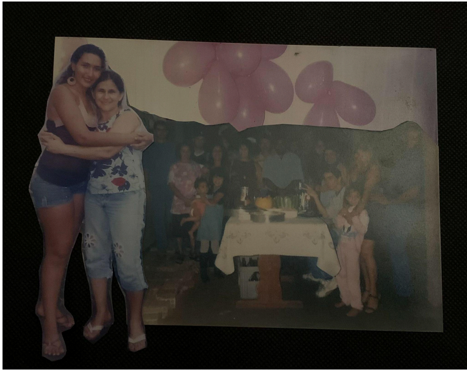
Imagem 4. Vitória Sampaio, Sem título, Colagem, 10cm x 15cm, Rio Grande, 2025.