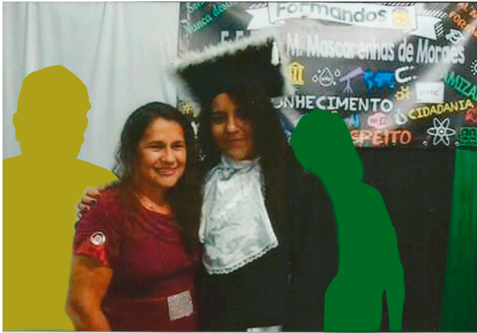
Imagem 1. Vitória Sampaio, Formatura, Colagem digital, 10cm x 15cm, Rio Grande, 2025. Foto: Acervo da autora, 2025.