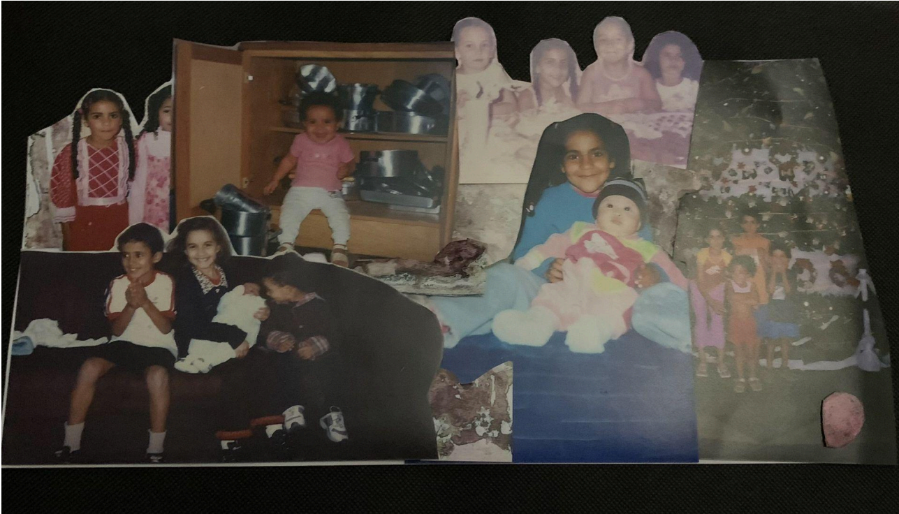
Imagem 2. Vitória Sampaio, Eu, Colagem, 16cm x 31cm, Rio Grande, 2025.