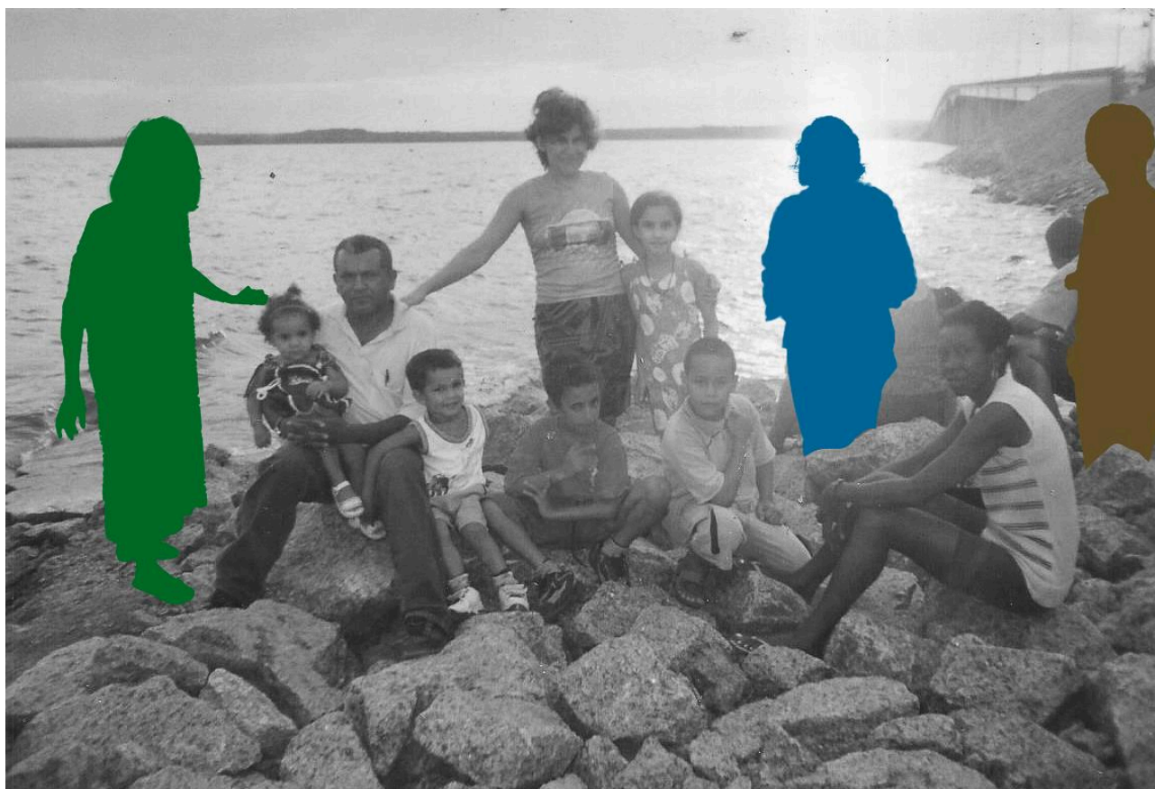
Imagem 6. Vitória Sampaio, Família 2, Colagem, 10cm x 15cm, Rio Grande, 2025.