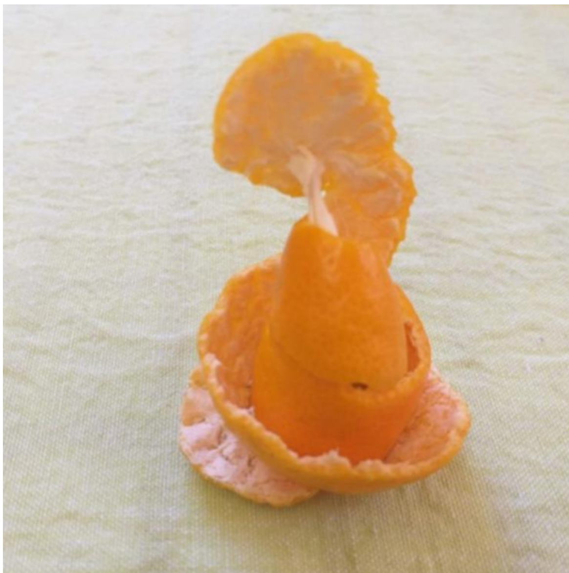
Imagem 2. Roseli Nery. Escultura cítrica 2, fotografia digital, Rio Grande, 2020.