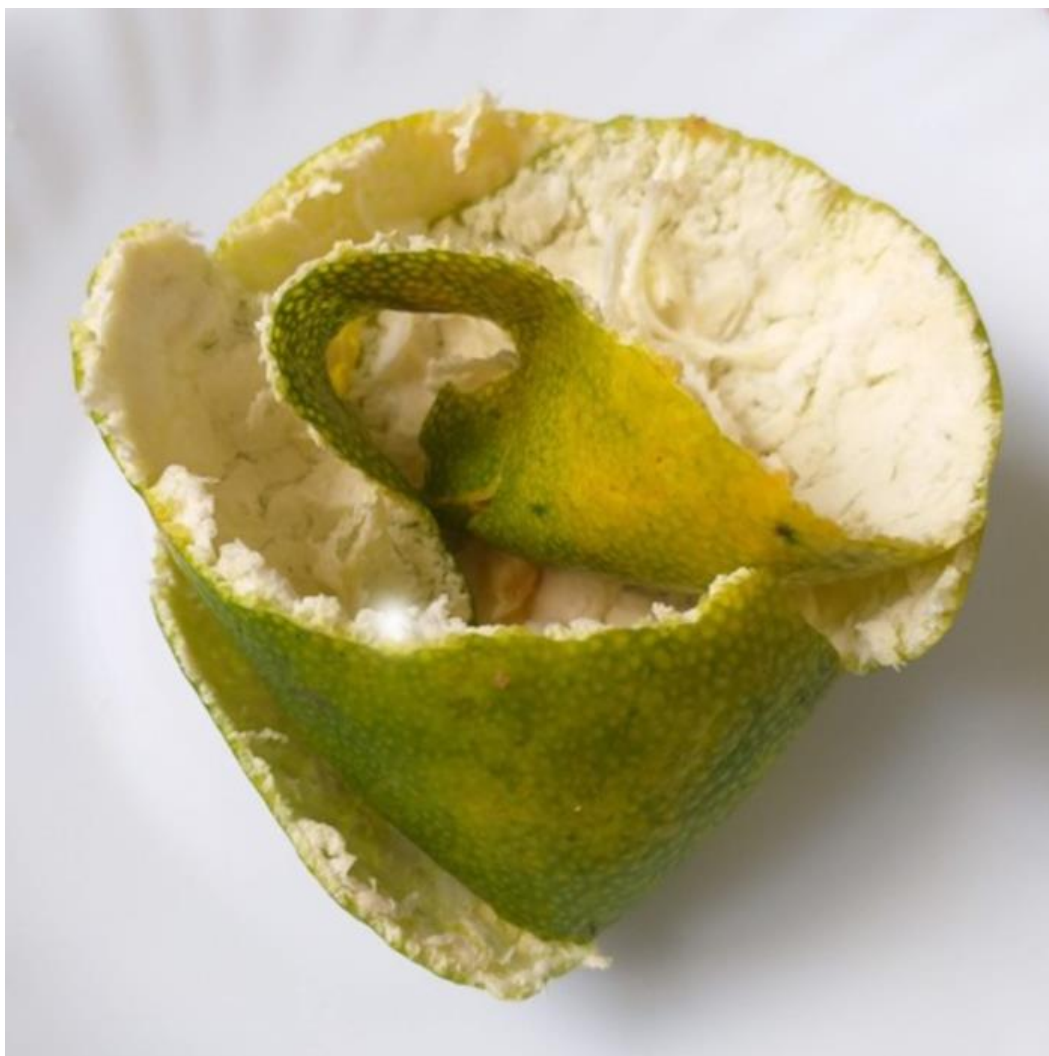
Imagem 5. Roseli Nery. Escultura cítrica 5, fotografia digital, Rio Grande, 2020.