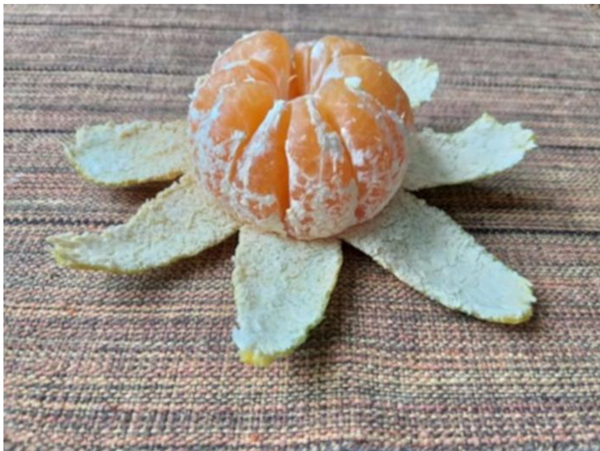
Imagem 10. Roseli Nery. Escultura cítrica 10, fotografia digital, Rio Grande, 2020.