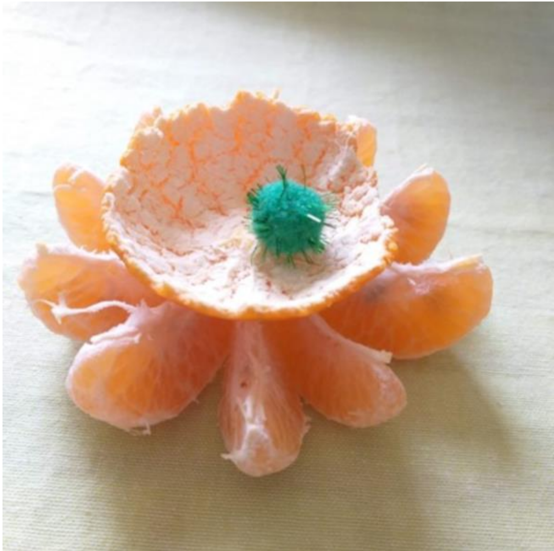
Imagem 8. Roseli Nery. Escultura cítrica 8, fotografia digital, Rio Grande, 2020.