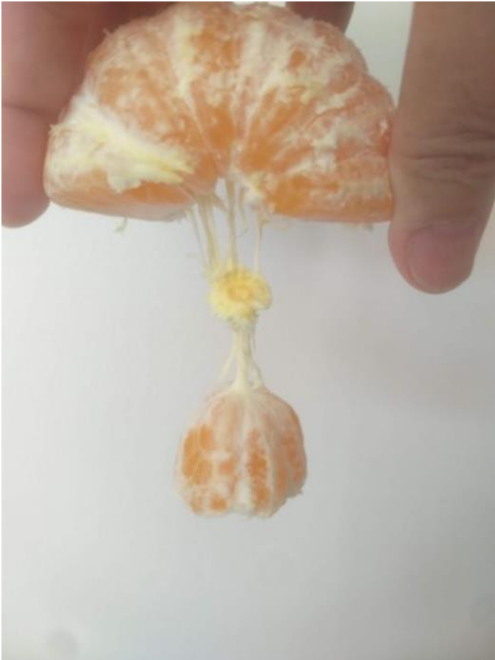
Imagem 7. Roseli Nery. Escultura cítrica 7, fotografia digital, Rio Grande, 2021.