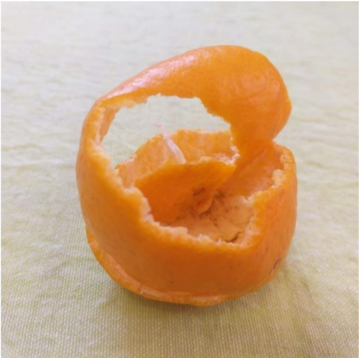
Imagem 3. Roseli Nery. Escultura cítrica 3, fotografia digital, Rio Grande, 2021.