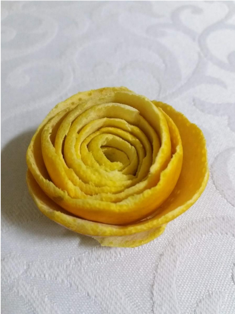
Imagem 6. Roseli Nery. Escultura cítrica 6, fotografia digital, Rio Grande, 2020.