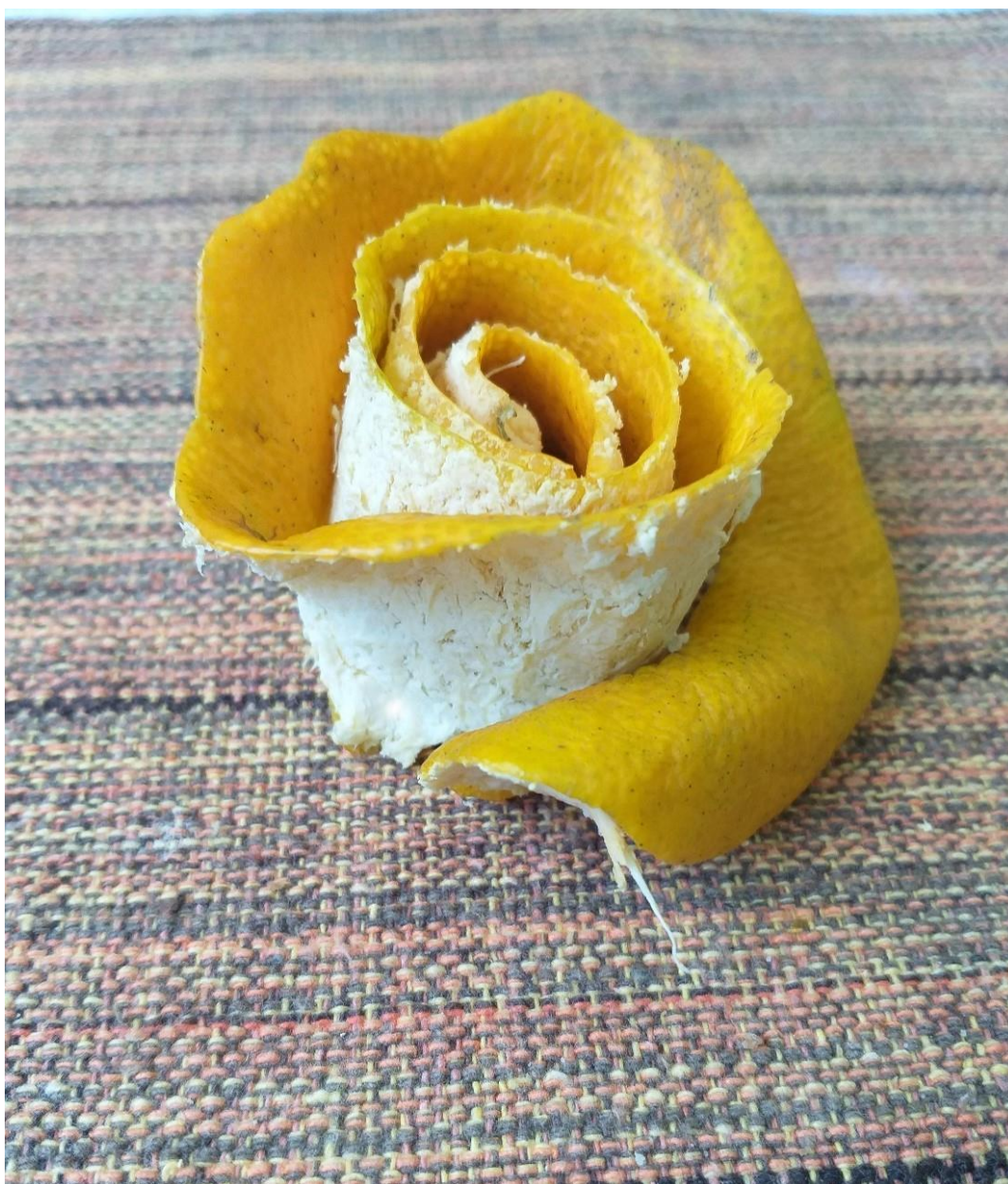
Imagem 4. Roseli Nery. Escultura cítrica 4, fotografia digital, Rio Grande, 2020.