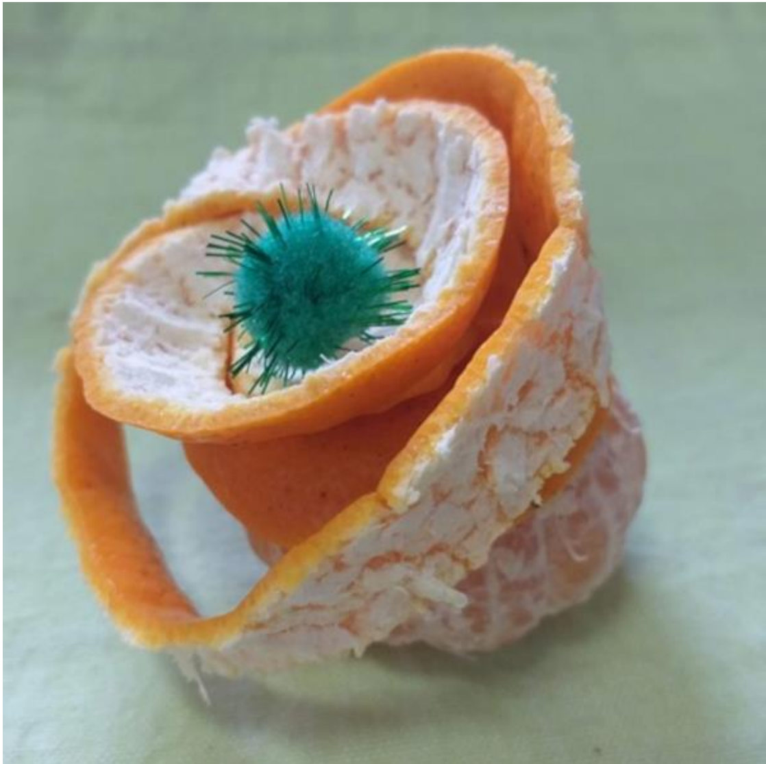
Imagem 9. Roseli Nery. Escultura cítrica 9, fotografia digital, Rio Grande, 2020.