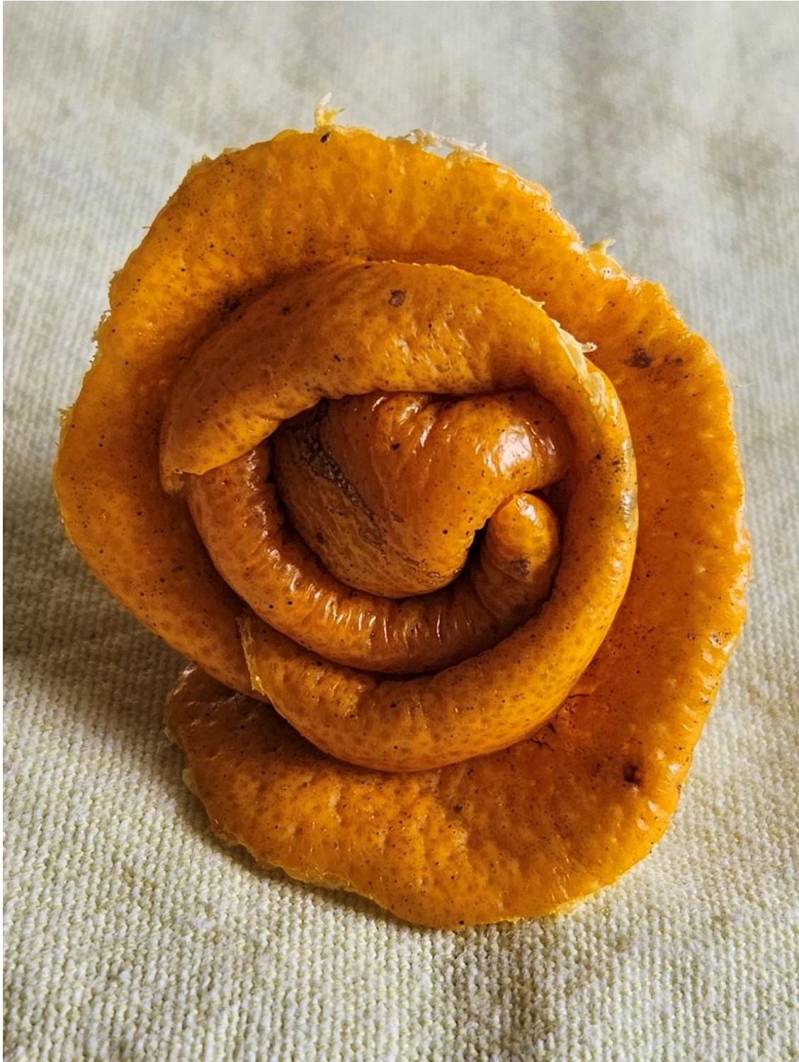
Imagem 1. Roseli Nery. Escultura cítrica 1, fotografia digital, Rio Grande, 2020.