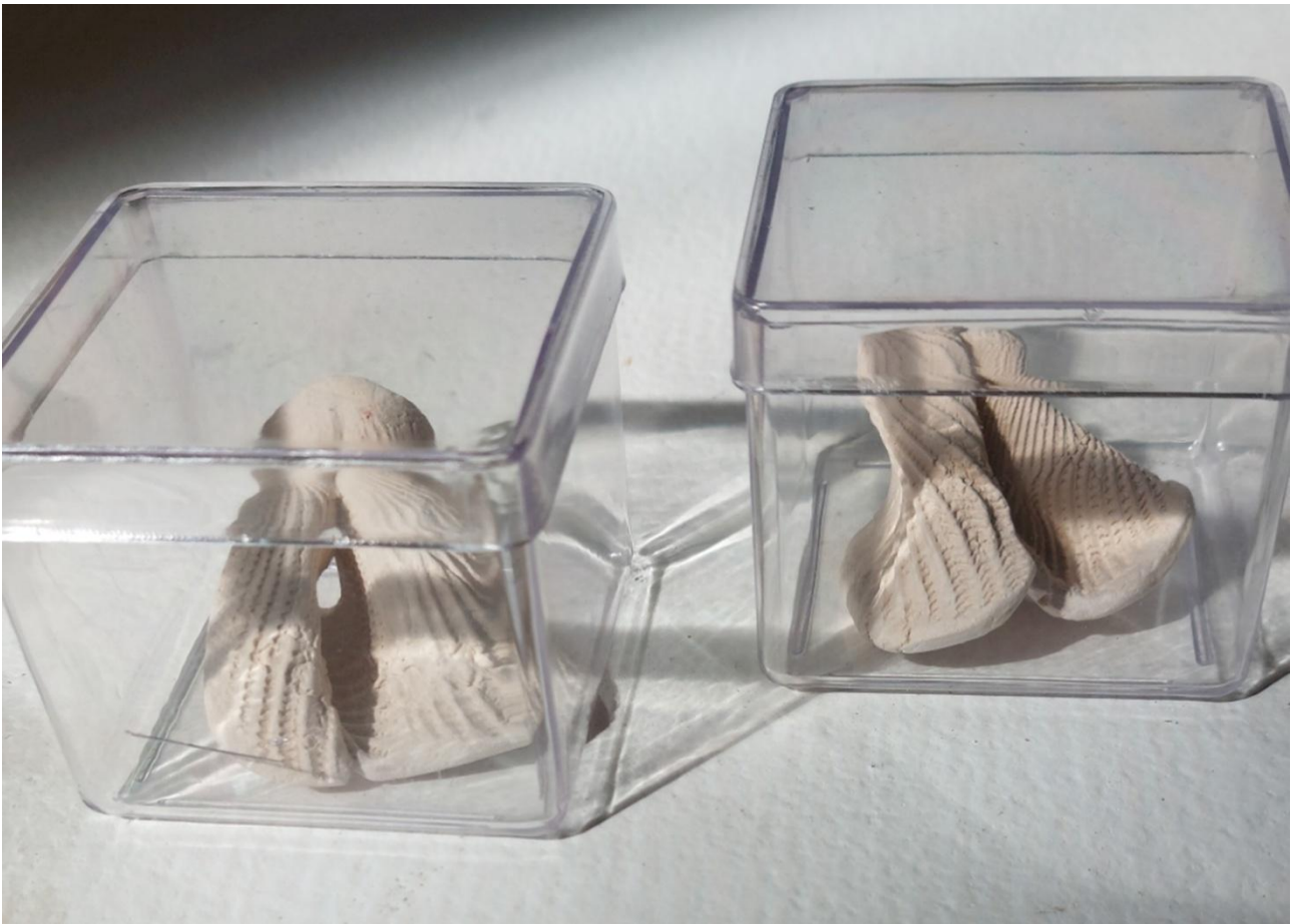
Imagem 10. Andrea Penteadó, Bocetas Sacralizadas, modelagem de placa em argila para Raku-cozimento em biscoito realizado em mufla, specific site, Rio de Janeiro, 2025