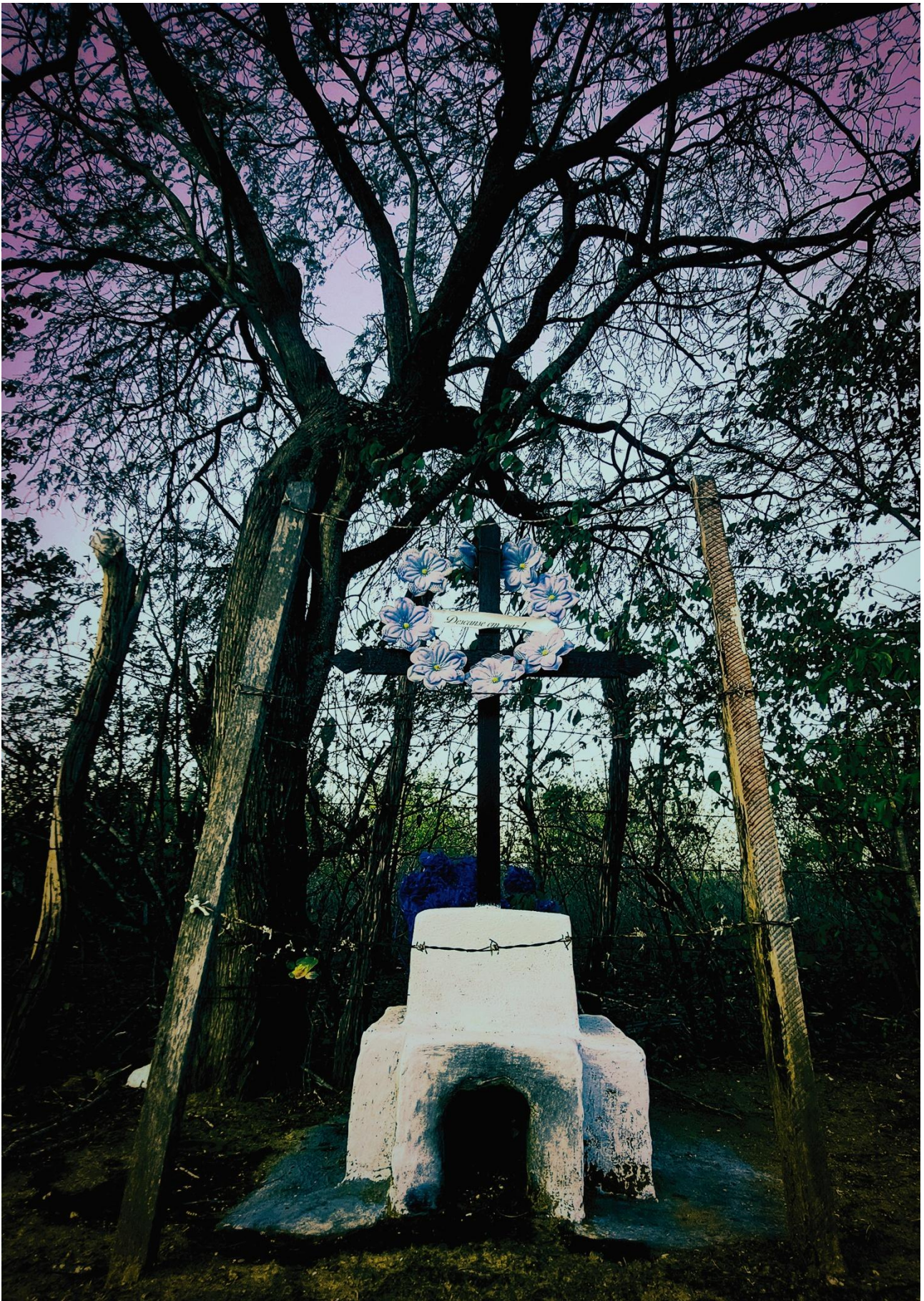
Imagem 1. Andrea Penteadó, Cruz Marrom em Santuário Branco, fotografia digital, 3508 px 4961 px – 300dpi, Monte das Gameleiras-RN, 2024