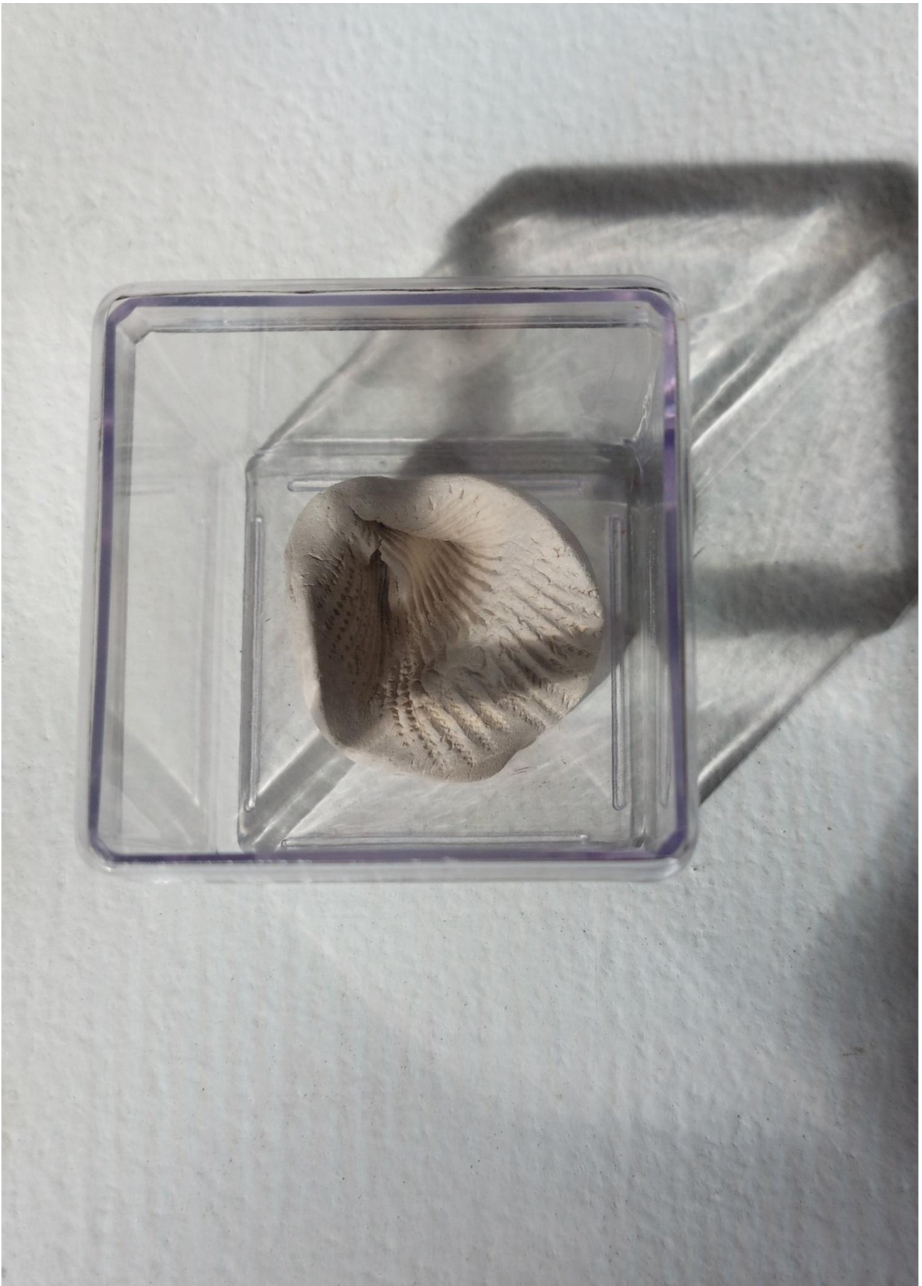
Imagem 9. Andrea Penteadó, Bocetas Sacralizadas, modelagem de placa em argila para Raku-cozimento em biscoito realizado em mufla, specific site, Rio de Janeiro, 2025