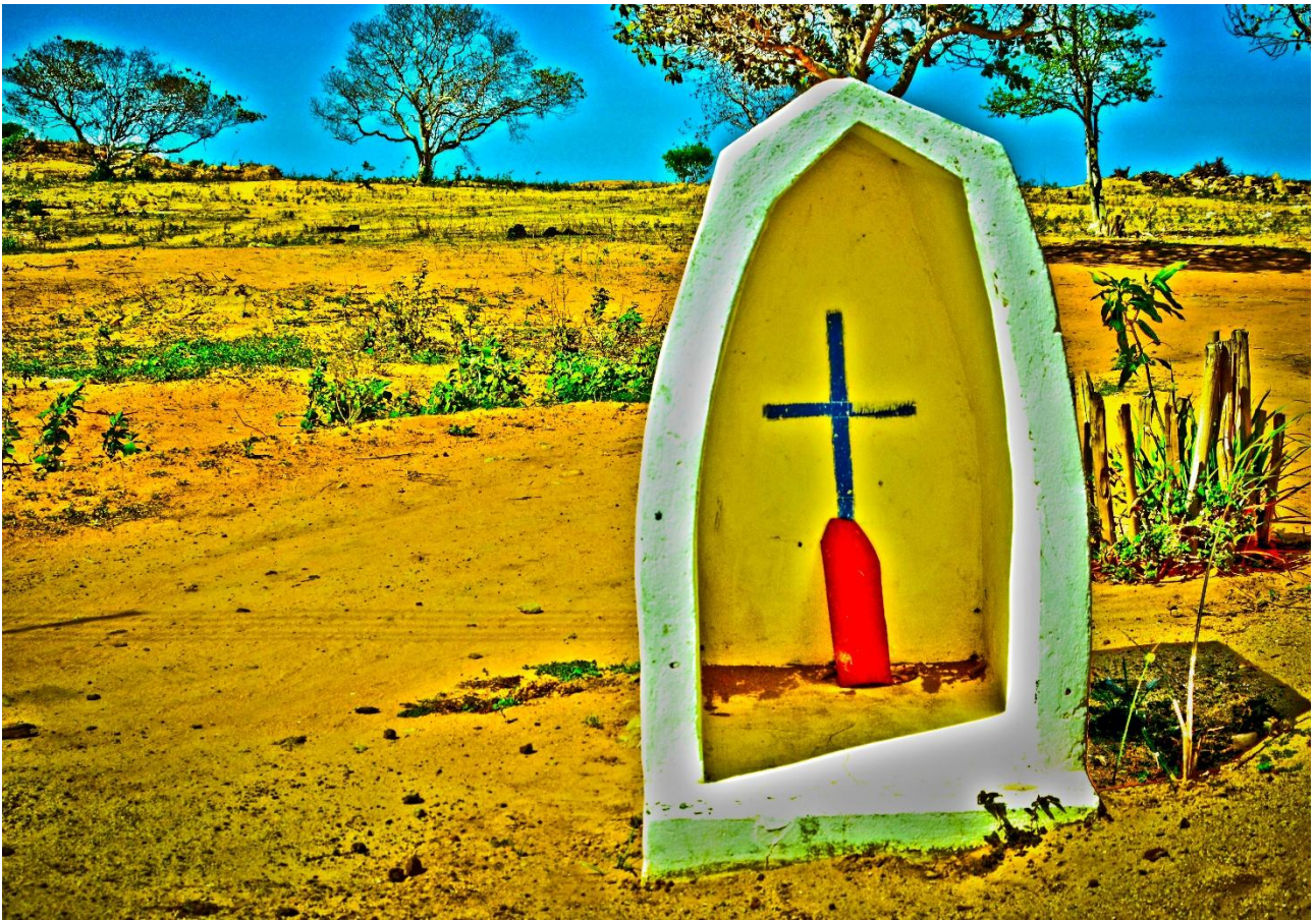
Imagem 5. Elinaldo Meira e Andrea Penteado, Cruz azul em Santuário Amarelo, fotografia digital, 7500 px 5250 px – 300dpi, Itapetim-PE, 2024