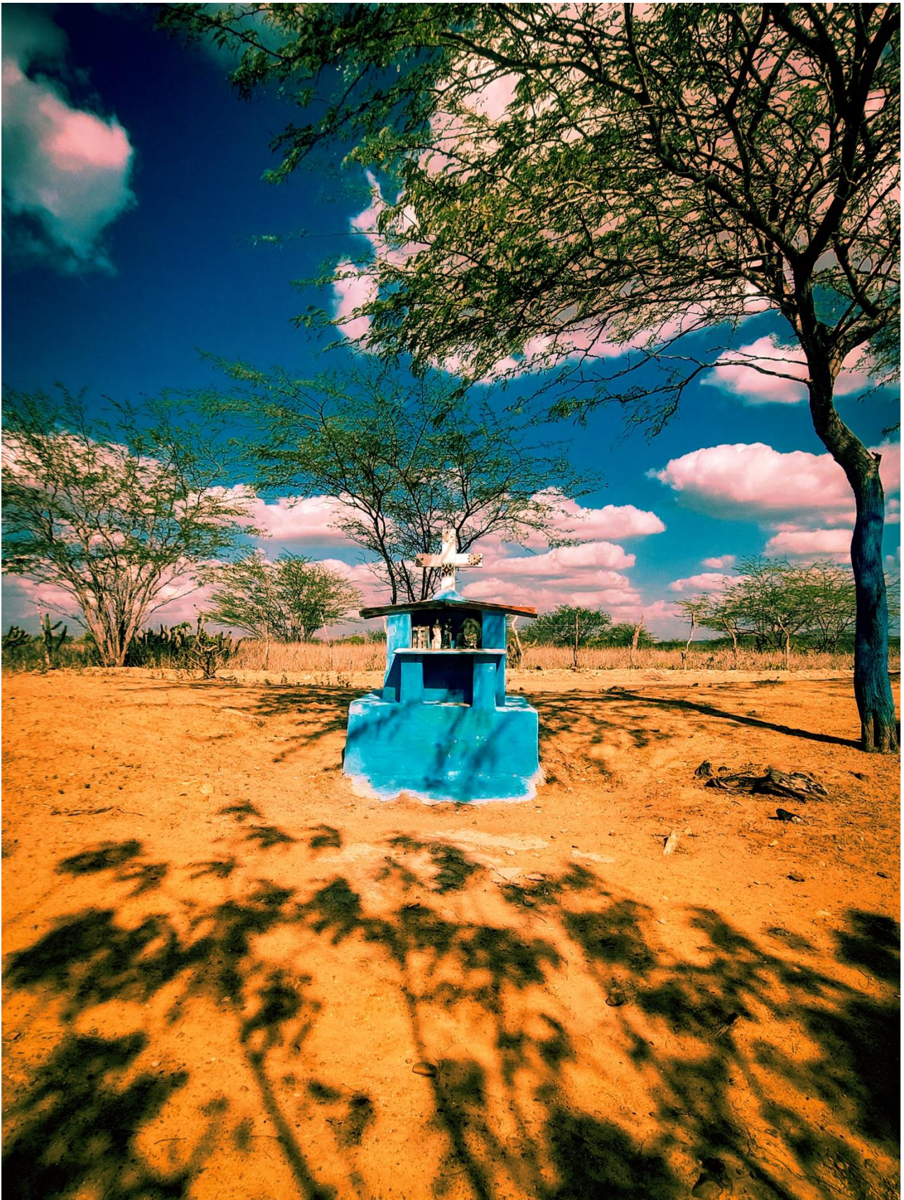
Imagem 4. Andrea Penteado, Cruz Branca em Santuário Azul, fotografia digital, 3506 px 4961 px – 300dpi, Monte das Gameleiras-RN, 2024