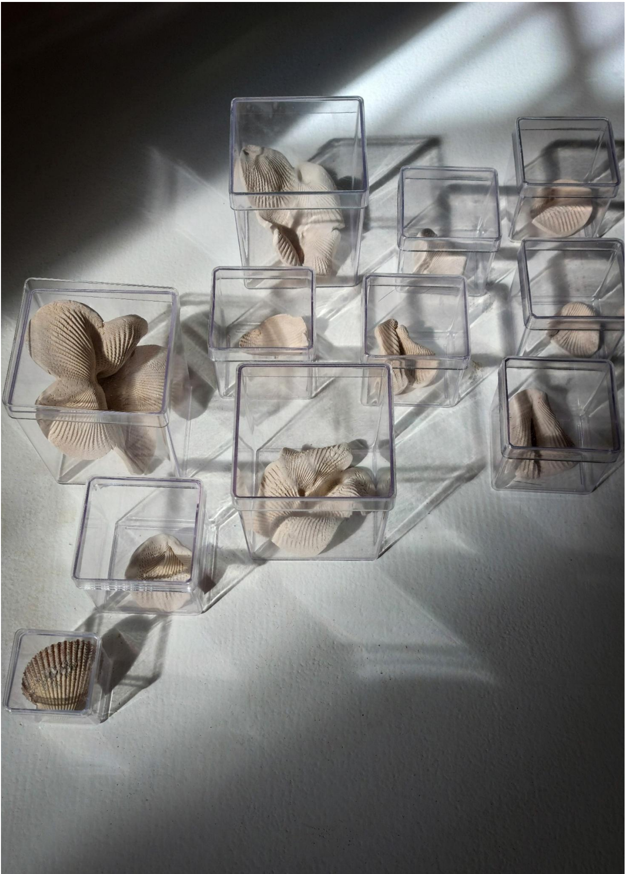
Imagem 7. Andrea Penteado, Bocetas Sacralizadas, modelagem de placa em argila para Raku-cozimento em biscoito realizado em mufla, specific site, Rio de Janeiro, 2025