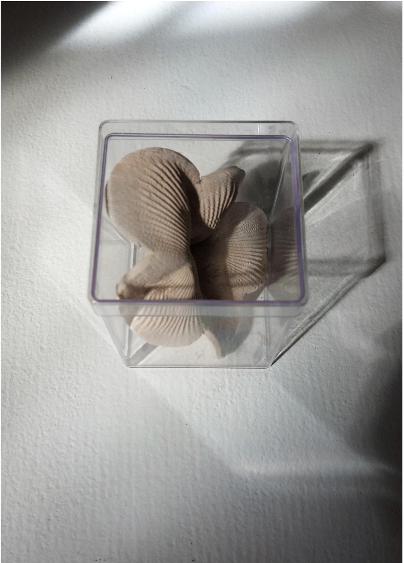
Imagem 8. Andrea Penteadó, Bocetas Sacralizadas, modelagem de placa em argila para Raku-cozimento em biscoito realizado em mufla, specific site, Rio de Janeiro, 2025