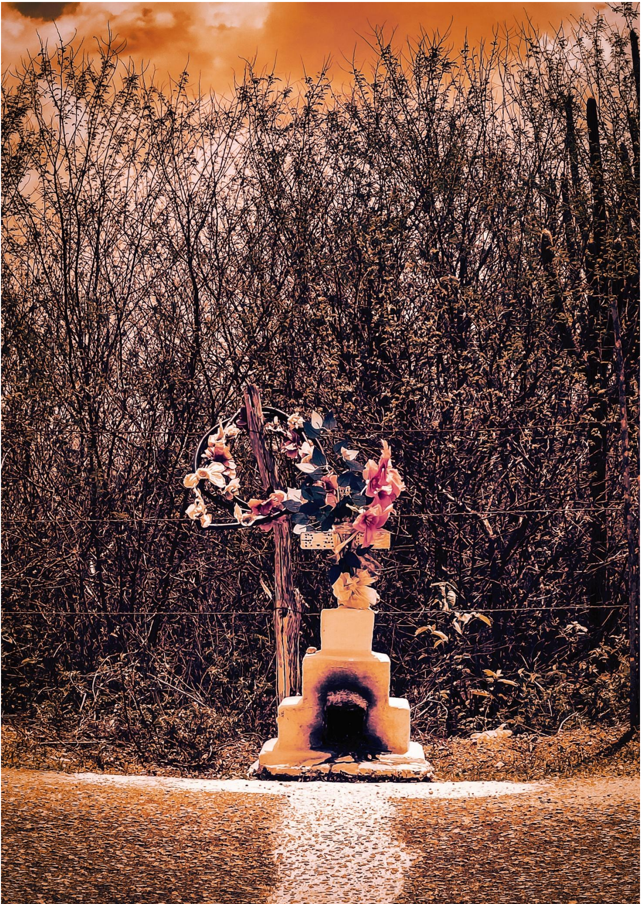
Imagem 2. Andrea Penteadó, Santuário Amarelo e Roxo com Flores, fotografia digital, 3508 px 4961 px – 300dpi, Monte das Gameleiras-RN, 2024