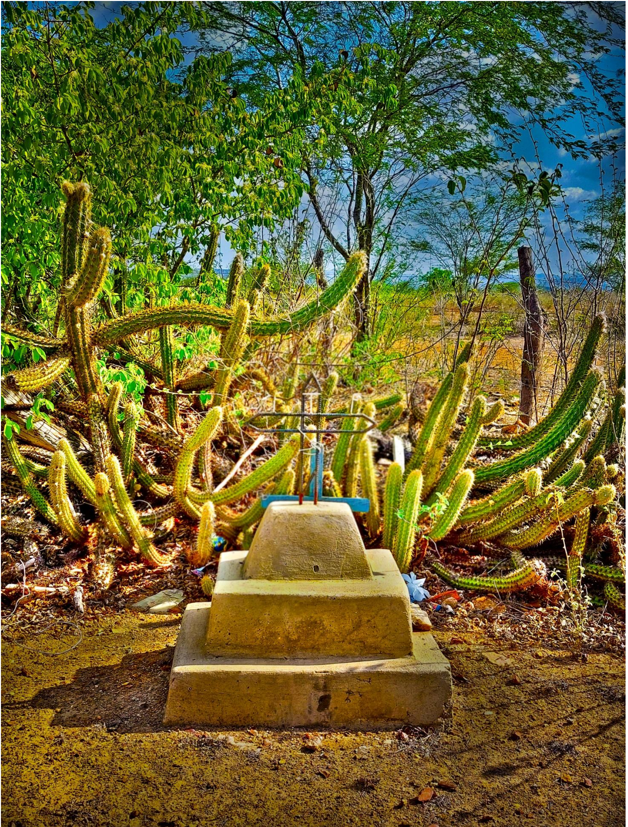
Imagem 3. Andrea Penteadó, As Cruzes que não Vemos , fotografia digital, 3507 px 4961 px – 300dpi, Monte das Gameleiras-RN, 2024