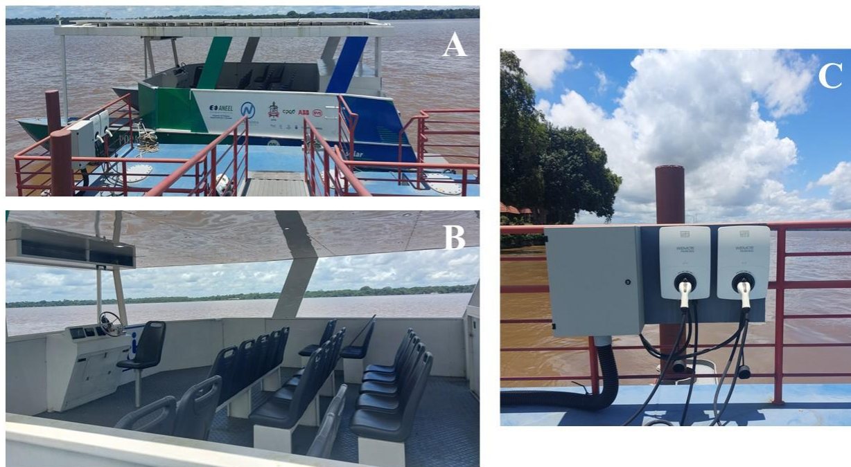
Figura 2 – A. Catamarã Poraquê atracado na UFPA; B. Vista interna da embarcação; C. Eletroposto do catamarã.

COP 30 - ENFRENTAMENTO ÀS DESIGUALDADES SOCIAIS E EMERGÊNCIA CLIMÁTICA