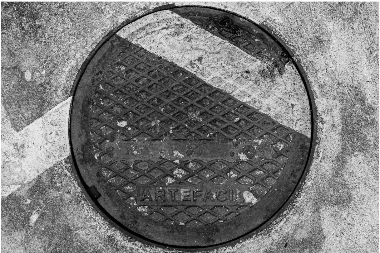
Imagem 2. Thalita Amorim, Sem título, da série Arte Fácil. Fotografia, dimensões variáveis. Belo Horizonte, 2023.