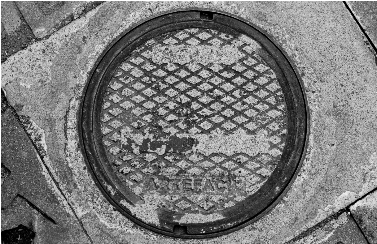
Imagem 4. Thalita Amorim, Sem título, da série Arte Fácil. Fotografia, dimensões variáveis. Belo Horizonte, 2023.