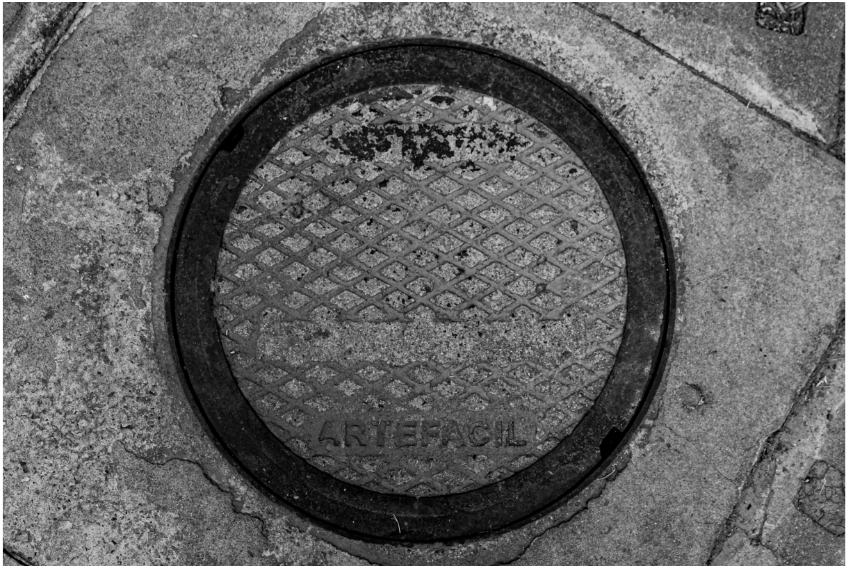
Imagem 9. Thalita Amorim, Sem título, da série Arte Fácil. Fotografia, dimensões variáveis. Belo Horizonte, 2023.