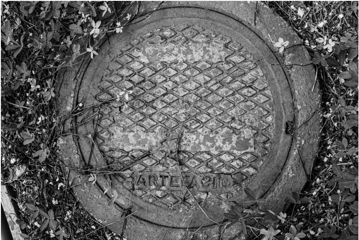
Imagem 1. Thalita Amorim, Sem título, da série Arte Fácil. Fotografia, dimensões variáveis. Belo Horizonte, 2023.