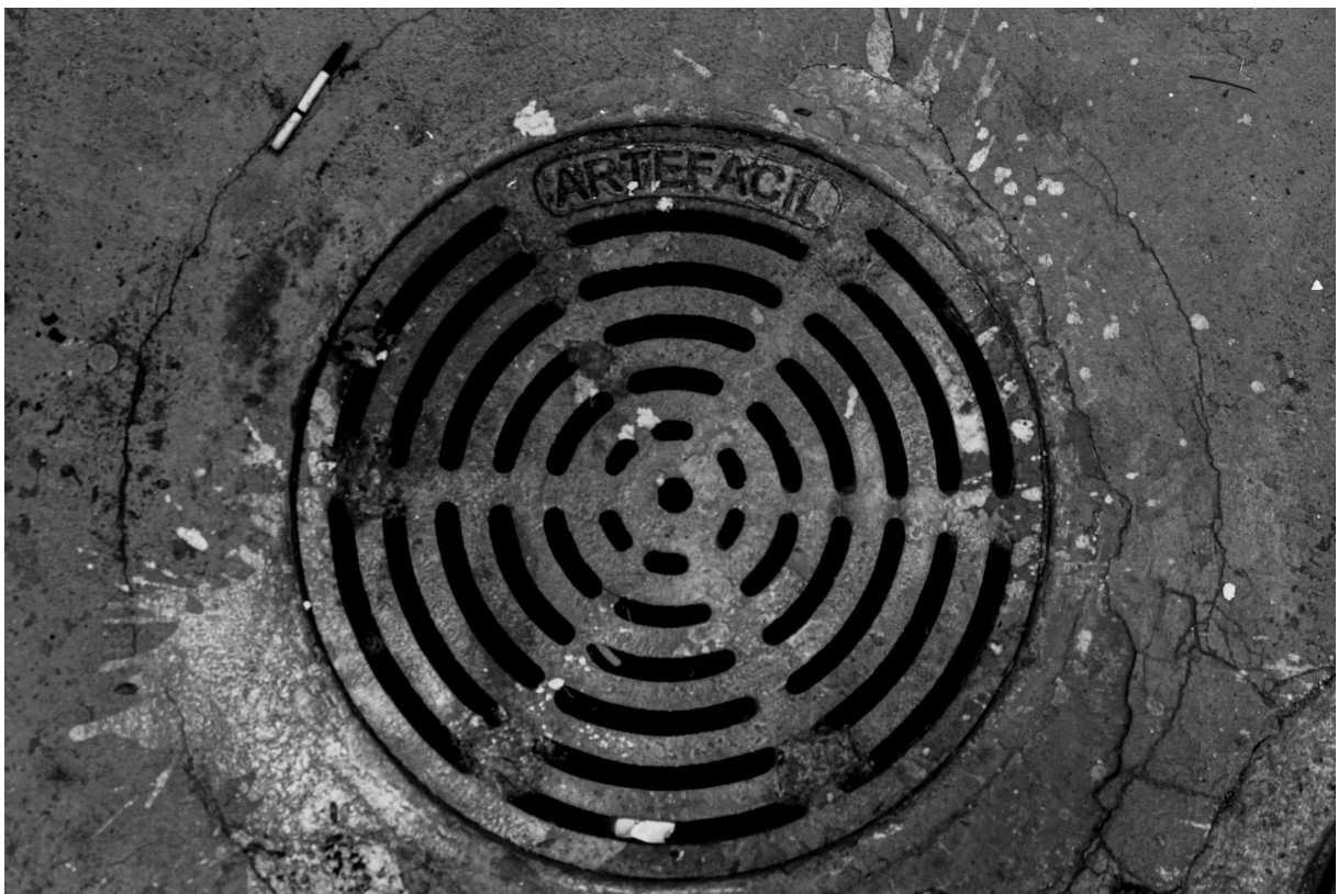
Imagem 6. Thalita Amorim, Sem título, da série Arte Fácil. Fotografia, dimensões variáveis. Belo Horizonte, 2023.