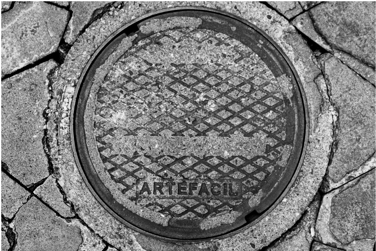
Imagem 8. Thalita Amorim, Sem título, da série Arte Fácil. Fotografia, dimensões variáveis. Belo Horizonte, 2023.