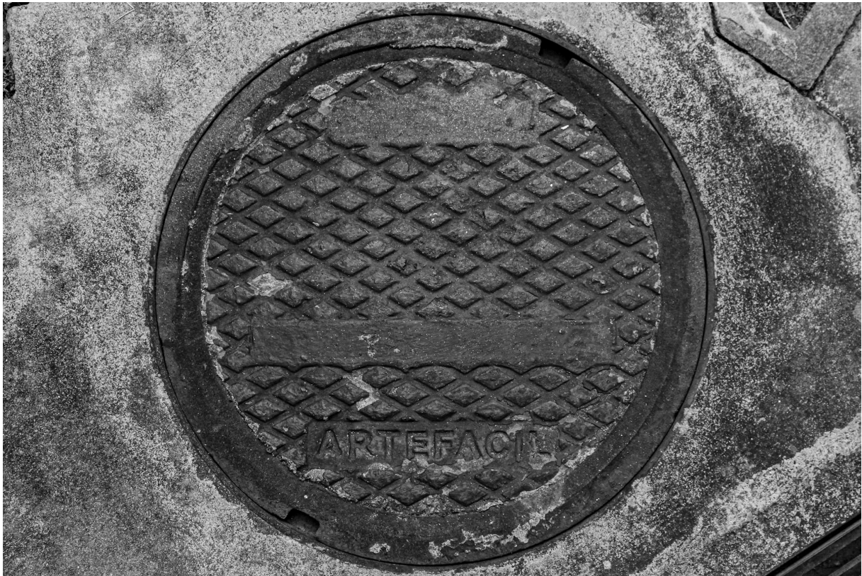
Imagem 7. Thalita Amorim, Sem título, da série Arte Fácil. Fotografia, dimensões variáveis. Belo Horizonte, 2023.