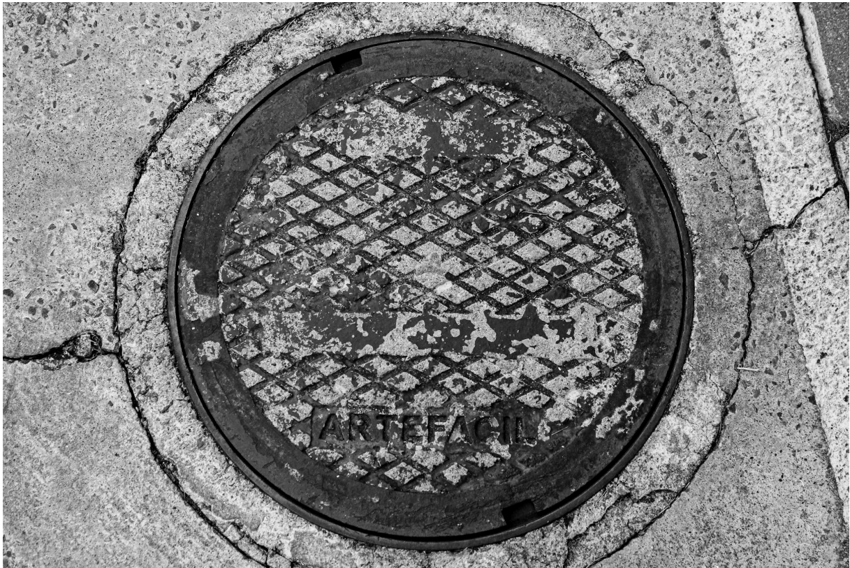
Imagem 3. Thalita Amorim, Sem título, da série Arte Fácil. Fotografia, dimensões variáveis. Belo Horizonte, 2023.