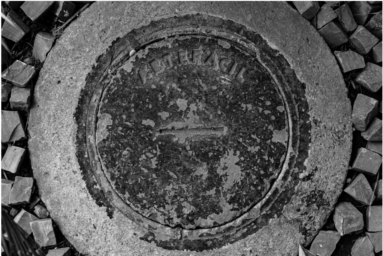
Imagem 5. Thalita Amorim, Sem título, da série Arte Fácil. Fotografia, dimensões variáveis. Belo Horizonte, 2023.