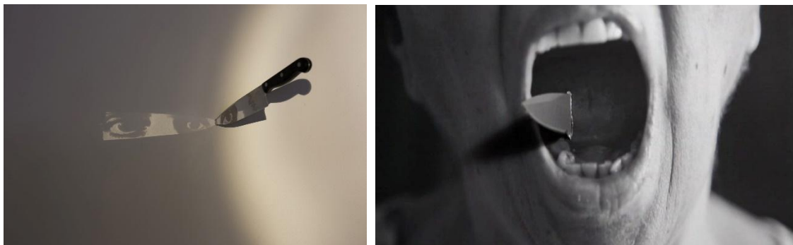
Imagem 3. Graciela Sacco. Retrato #1 , instalação, 2010. Imagem 4. Lenora de Barros. Estudo para facadas , vídeo, 1'32", 2012.

A história política da Argentina se reflete tanto em sua produção artística quanto em sua pesquisa sobre o coletivo Tucumán Arde – intervenção artística e política de 1968 que denunciava a crise social e econômica na província, ocultada pela propaganda militar. No contexto pós-ditadura, ainda marcado por disputas em torno da memória e justiça, Sacco criou a instalação Retrato , em que o espectador se confronta com um corpo fragmentado, reduzido a um olho impresso em uma faca cravada na parede.