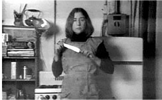
Imagem 5. Marina Abramović. Ritmo 10, performance, 1973. Imagem 6. Martha Rosler. Semióticas da Cozinha, vídeo, 6'09", 1975.

Em Semióticas da Cozinha (imagem 6), vídeo de 1975, em preto e branco de Martha Rosler (EUA, 1943), a artista está em uma cozinha diante de uma mesa com utensílios. Vestindo avental, nomeia cada instrumento em ordem alfabética e, olhando para a câmera, demonstra seu uso com gestos irônicos, exagerados ou agressivos. Rosler assume o papel de uma dona de casa e parodia as demonstrações de culinária televisivas dos anos 1960. Usando cutelo, faca, quebra-nozes e outros, seus gestos expressam raiva e frustração diante dos papéis opressivos atribuídos às mulheres. Com tom irônico e subversivo, revela como objetos domésticos carregam significados culturais e políticos, desestabilizando sua aparente neutralidade e denunciando a violência simbólica na rotina feminina.