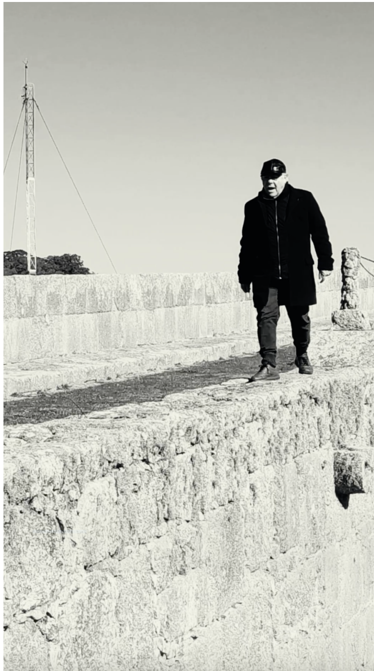
Imagen 1. Domingo Mestre, Imperio Español 1, Captura de pantalla del audiovisual Desde la muralla. Sobre el territorio , 928 x 1620 pixels, Rio Grande, 2025.