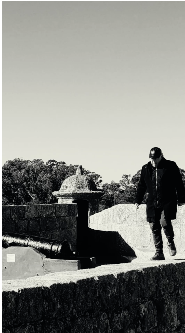
Imagen 4. Domingo Mestre, Imperio Portugués 2, Captura de pantalla del audiovisual Desde la muralla. Sobre el territorio , 928 x 1620 pixels, Rio Grande, 2025.