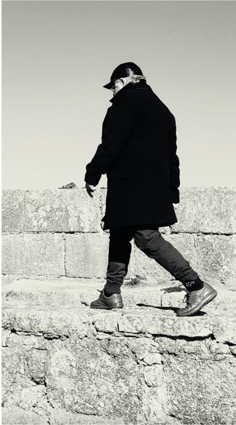
Imagen 3. Domingo Mestre, Imperio Español 2, Captura de pantalla del audiovisual Desde la muralla. Sobre el territorio , 928 x 1620 pixels, Rio Grande, 2025.