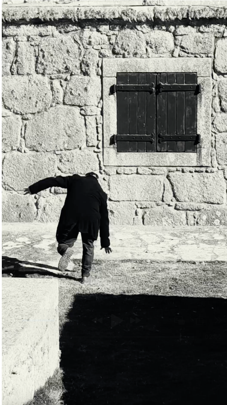
Imagen 9. Domingo Mestre, República Oriental de Uruguay, Captura de pantalla del audiovisual Desde la muralla. Sobre el territorio , 928 x 1620 pixels, Rio Grande, 2025.