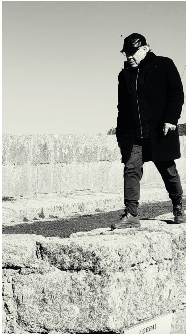
Imagen 2. Domingo Mestre, Imperio Portugués 1, Captura de pantalla del audiovisual Desde la muralla. Sobre el territorio , 928 x 1620 pixels, Rio Grande, 2025.