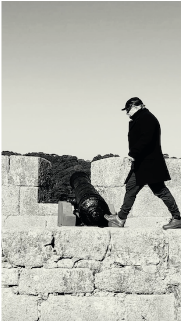
Imagen 5. Domingo Mestre, Imperio Español 3, Captura de pantalla del audiovisual Desde la muralla. Sobre el territorio , 928 x 1620 pixels, Rio Grande, 2025.