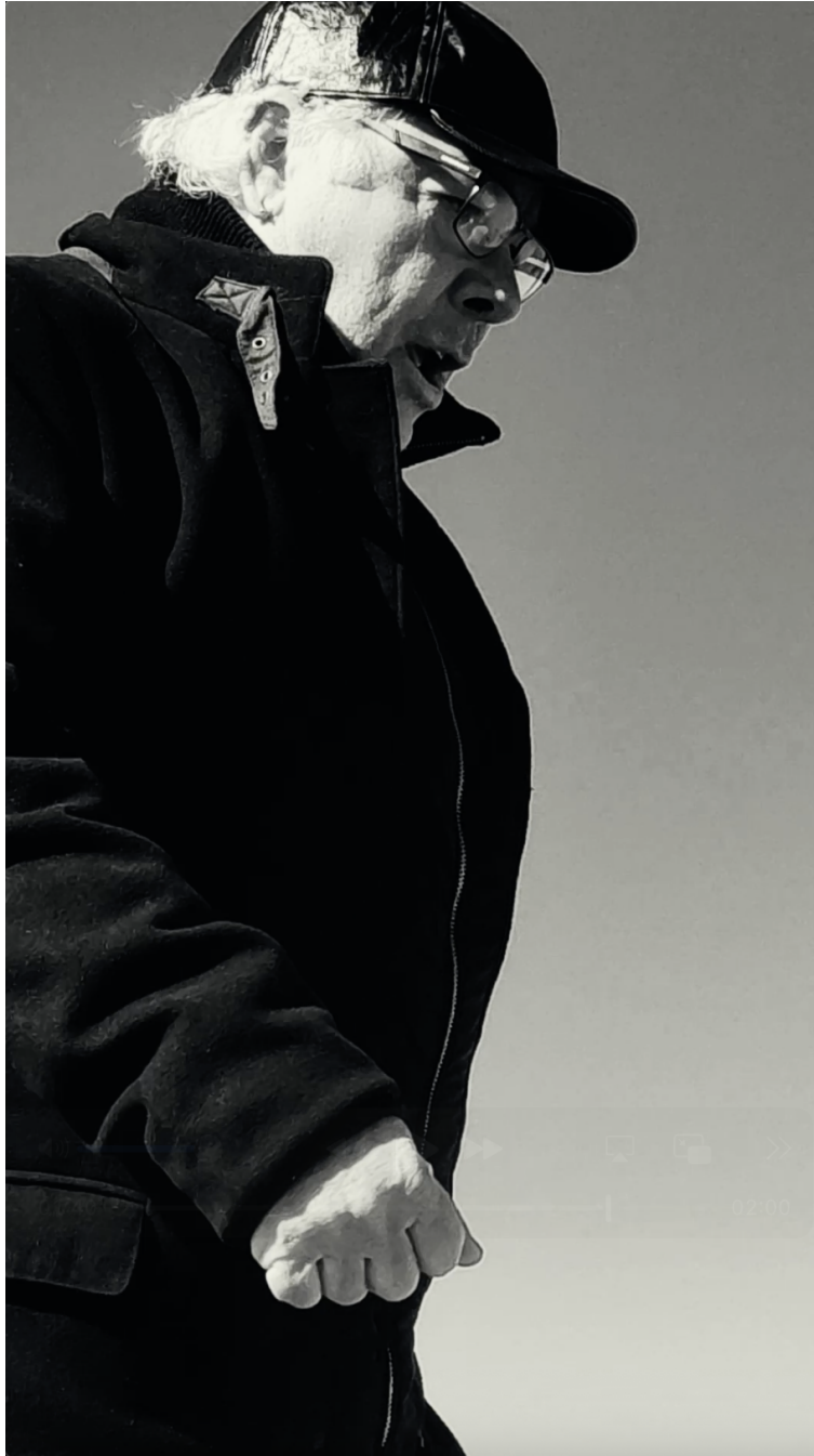
imagen 6. Domingo Mestre, Imperio Portugués 3, Captura de pantalla del audiovisual Desde la muralla. Sobre el territorio , 928 x 1620 pixels, Rio Grande, 2025.