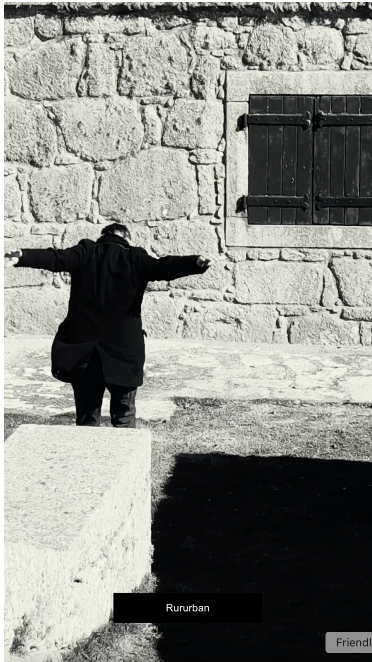
Imagen 8. Domingo Mestre, Imperio del Brasil, Captura de pantalla del audiovisual Desde la muralla. Sobre el territorio , 928 x 1620 pixels, Rio Grande, 2025.