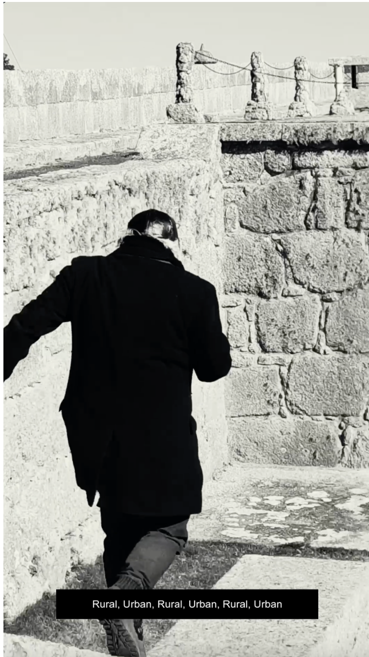
Imagen 7. Domingo Mestre, Imperio Español 4, Captura de pantalla del audiovisual Desde la muralla. Sobre el territorio , 928 x 1620 pixels, Rio Grande, 2025.