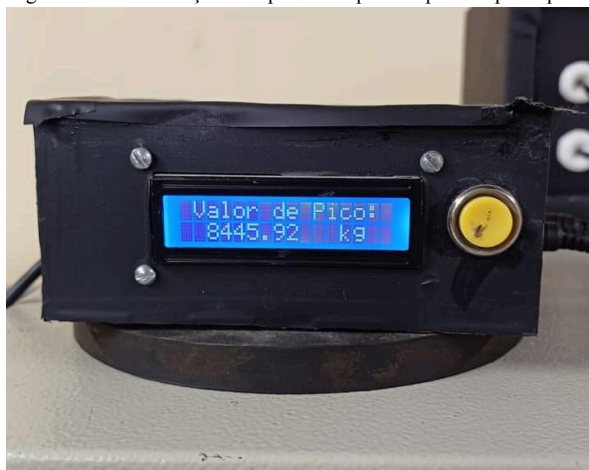
Figura 3: Máxima força a compressão suportada pelo corpo de prova

Durante o período de cura, a temperatura elevada (27,7 °C a 28,3 °C) e a queda na umidade relativa do ar (79% para 75%) comprometeram a hidratação adequada do cimento. Essas condições aceleraram a reação inicial, mas prejudicaram sua continuidade. A perda de água por evaporação limitou a formação dos produtos de hidratação. Portanto, o ambiente de cura foi inadequado para o pleno desenvolvimento da resistência do concreto, resultando em uma resistência abaixo do esperado para o período de 3 dias de cura, o que pode ser observado na Figura 3.