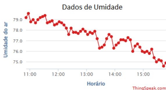
Figura 2: Dados de Umidade do Ar