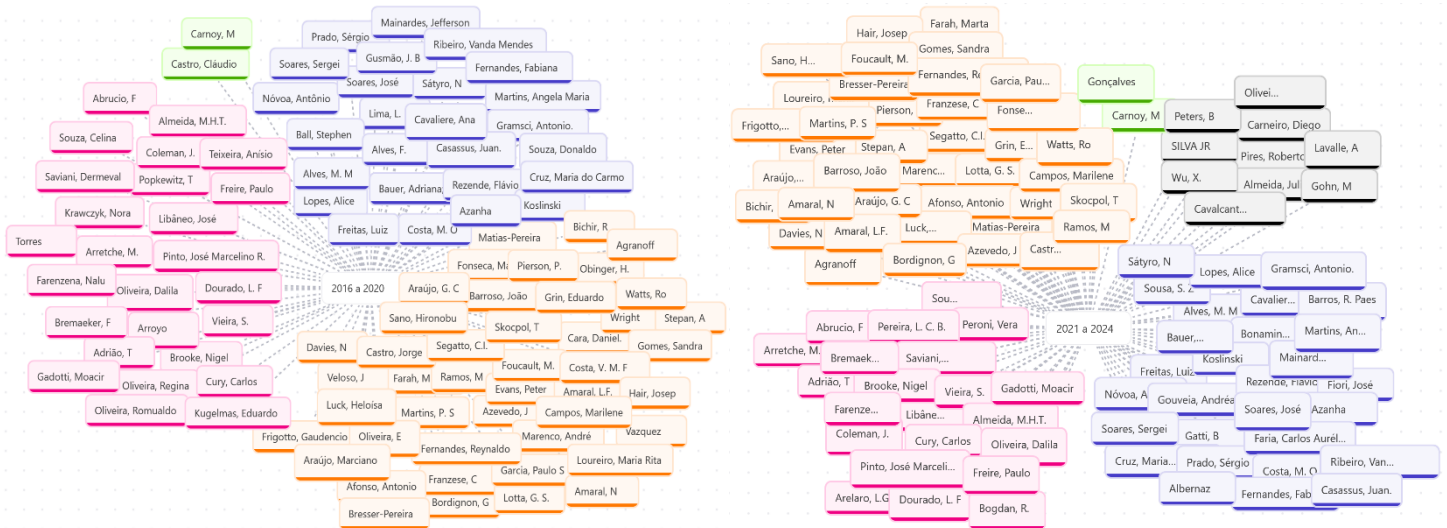
Figura 3 - Painel Redes de Autores com 03 ou mais citações no corpus (1990-2024)

Fonte: autoria própria com base em dados de pesquisa nos repositórios.