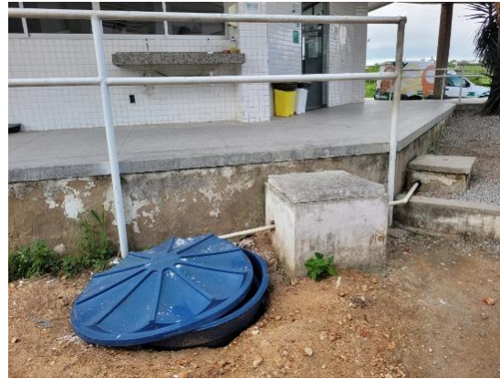
Figura 3 - Reservatório para armazenamento de águas de reuso.

A partir desses resultados, concluiu-se que a complexidade da água residual do restaurante demandaria um sistema de tratamento robusto, com várias etapas de filtragem, o que extrapolava os recursos e o escopo inicial do projeto.