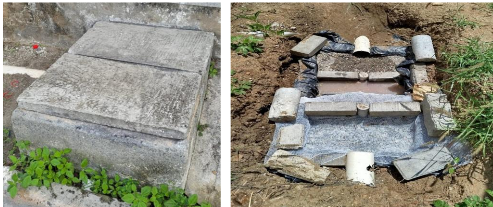
Figura 2 – Caixa de gordura (esq.) e filtro construído (dir.).

Posteriormente à construção do filtro iniciou-se a preparação do local para captação da água filtrada. Contudo, durante a fase de testes, observou-se que a quantidade de resíduos sólidos orgânicos foi significativamente maior do que o previsto. Isso comprometeu o desempenho do sistema de filtragem proposto, além de apresentar limitações técnicas quanto à coleta da água após a filtragem. Esse problema foi gerado pelo descarte de material da lavagem das bandejas sem a devida contenção dos resíduos que iam diretamente para caixa de gordura, de onde era captada a água a ser tratada. Outro aspecto crítico é que a vazão dos efluentes das águas cinzas têm picos nos momentos das lavagens de alimentos e das bandejas que precisam ser melhor monitorados.