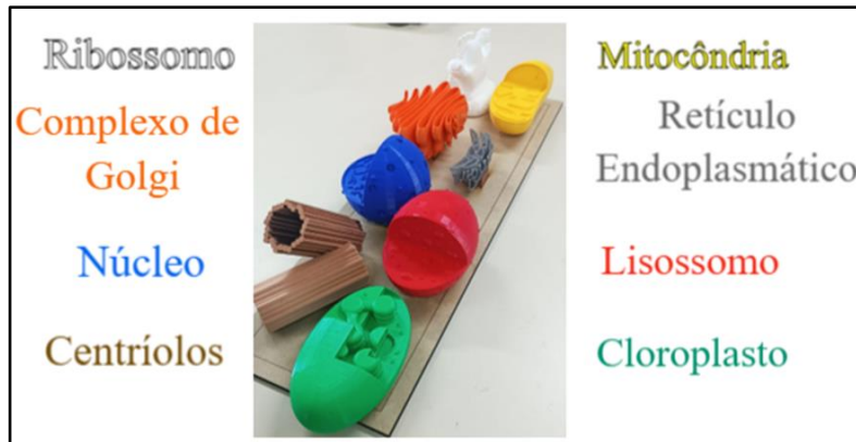
Figura 3 – Organelas citoplasmáticas impressas em 3D de forma ampliada sobre a placa de MDF.

estudantes que apresentam maior dificuldade na absorção de conteúdos quando repassados apenas de forma oral ou visual, adicionando a opção tátil para o aprimoramento das alternativas de estudo.