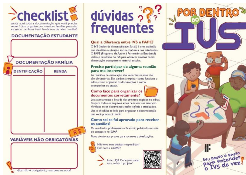
Figura 2 – Frente e verso do panfleto

A estrutura do artefato gráfico desenvolvido abrange três partes: um tabuleiro, ilustrando o processo com o edital; o checklist, que possibilita o preenchimento personalizado; e uma seção com dúvidas frequentes, baseada em levantamento realizado junto aos estudantes (figura 2). A linguagem visual buscou ser acessível e lúdica, contribuindo com a compreensão do conteúdo. A tipografia escolhida para o título e algumas aplicações - Plural - foi projetada pelos próprios autores. O material também foi adaptado para aplicação em totem físico, ampliando sua visibilidade no campus. A integração entre texto e imagens foi fundamental para garantir a clareza e o engajamento dos estudantes no processo de inscrição no edital.