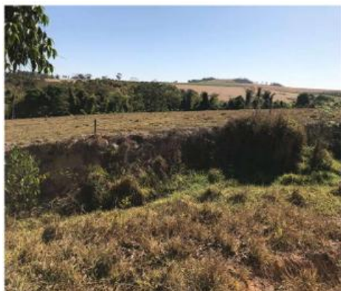
Figuras 1—Área de pastagem com erosão.