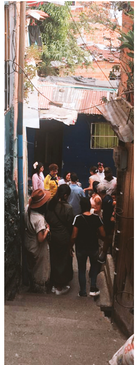
Acesso ao bairro Moravia.