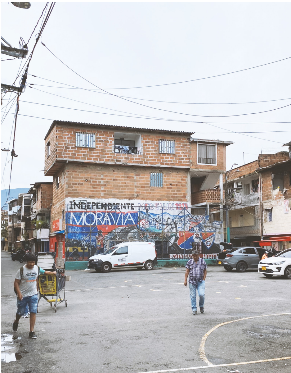
Quadra esportiva "Independiente Moravia".