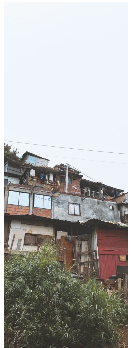
Paisagem construída de Moravia.