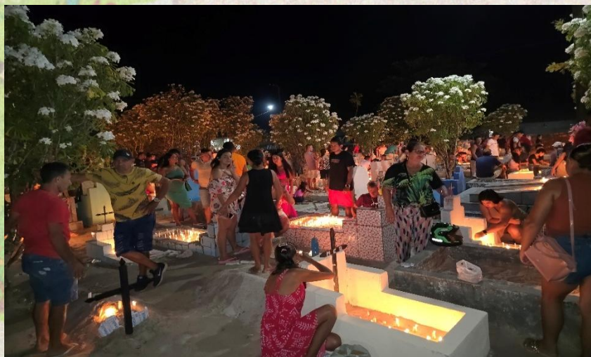
FIGURA 1. Comunitários em movimentos na Noite de Finados em Caratateua.

A celebração do Dia de Finados na Vila de Caratateua transcende a experiência individual do luto e se inscreve no campo das práticas culturais coletivas, que articulam memória, espiritualidade e pertencimento. Na noite de 2 de novembro, moradores locais e de comunidades vizinhas convergem para o cemitério, levando velas, flores artesanais e outros elementos simbólicos que representam a continuidade dos vínculos com seus entes falecidos. Segundo Bosi (1994), a memória coletiva não apenas preserva lembranças, mas também se atualiza no presente, permitindo que os indivíduos se reconheçam como parte de uma história comum, reforçando laços comunitários e identitários como mostra a imagem 1.