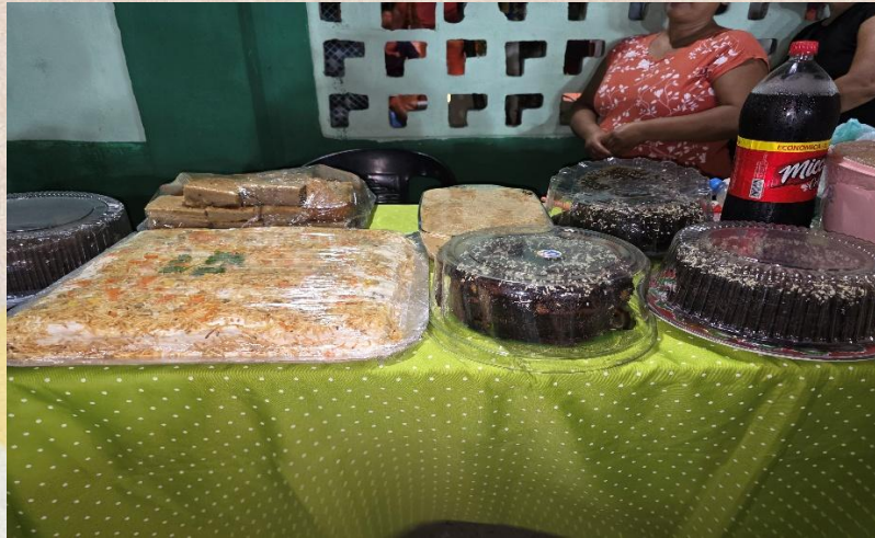
FIGURA 4. Comidas típicas à venda na Noite de Finados em Caratateua.