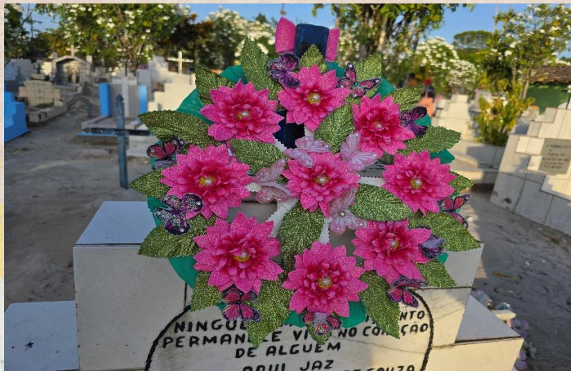
FIGURA 3. Coroas de flores produzidas artesanalmente para decoração de túmulos.