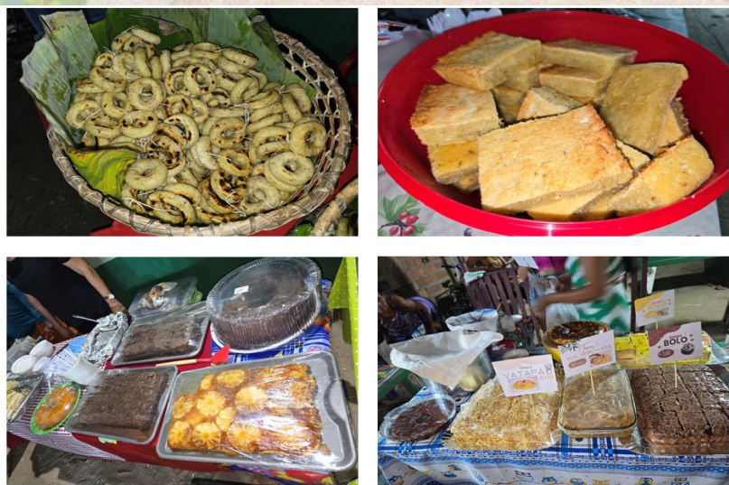
FIGURA 5. Iguarias comercializadas em frente ao cemitério de Caratateua na Noite de Finados.

Os alimentos oferecidos nesse contexto não são escolhidos ao acaso. Pratos como mingau, bolo de macaxeira, café, mingau de milho e outros quitutes tradicionais fazem parte do cardápio, carregando sabores que remetem à memória afetiva da comunidade (figura 5). Segundo Brandão (2003), a cultura se manifesta nos pequenos gestos, nas práticas cotidianas e nos saberes compartilhados, onde a alimentação ocupa lugar central na construção das identidades culturais. Assim, comer juntos nesse espaço de memória é também uma forma de reafirmar pertencimento e continuidade dos laços comunitários.