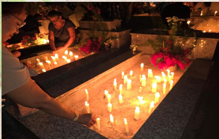
FIGURA 2. Comunitárias acendendo velas para iluminação de ente querido já falecido.

Além de sua dimensão espiritual, a prática de iluminar os túmulos (figura 2), também evidencia uma estética comunitária, na qual o coletivo se sobrepõe ao individual. As fileiras de velas acesas não apenas homenageiam os entes queridos, mas também produzem uma atmosfera visual que celebra a unidade, a solidariedade e a coesão social. Segundo Lopes (2019), esses rituais configuram-se como expressões do patrimônio imaterial, pois incorporam saberes, práticas e significados compartilhados, que são transmitidos entre gerações como forma de resistência frente às dinâmicas de apagamento cultural.