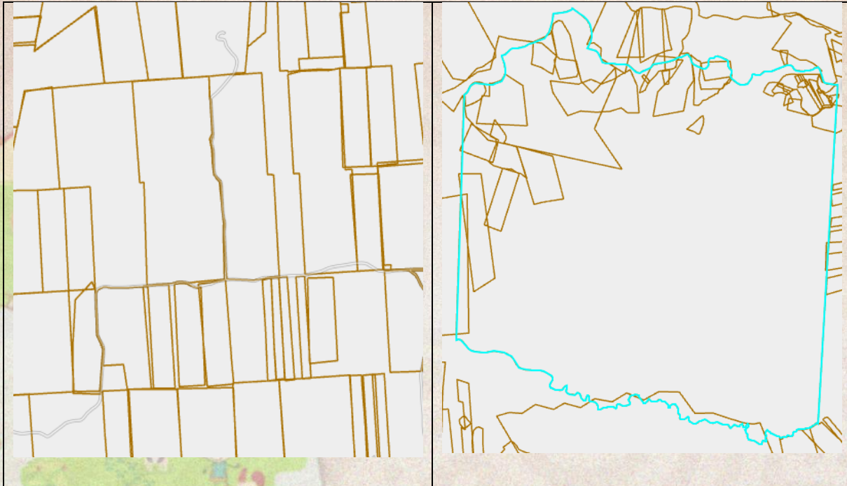
Fig. 3. Imagem do lado esquerdo representa local pontual sem problemas fundiários e conseqüentemente sem sobreposição entre os imóveis inscritos no CAR. Já a imagem do lado direito, realidade mais comumente encontrada no Vale do Ribeira, possui inúmeras sobreposições com cadastros de pequenas propriedades rurais em sobreposição a um imóvel maior (polígono delimitado em azul). (Mapas CAR, Acesso em 21 de maio de 2025).

um CAR com sobreposição, na ausência de documentação comprobatória irrefutável da posse ou propriedade, evidencia a dificuldade do Estado em lidar com a realidade da posse informal e dos conflitos territoriais históricos, transferindo, na prática, o ônus da prova e da resolução para o agricultor individual, que muitas vezes não dispõe dos meios para tal.