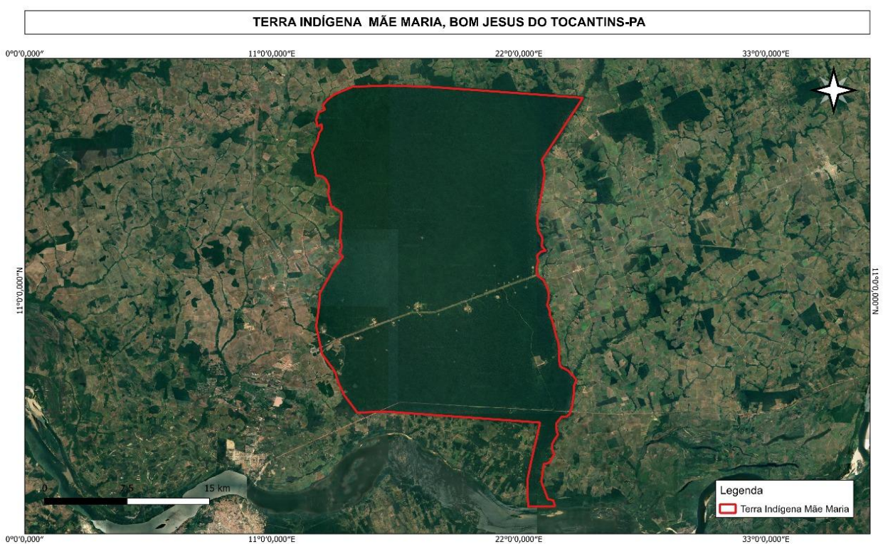
Figura 1 – Localização da terra indígena Mãe Maria na região sudeste do Pará

O Território Indígena Mãe Maria está localizado na região sudeste do Pará, especificamente no município de Bom Jesus do Tocantins. A área do território é de 120.000 hectares, sendo habitada por cerca de 1.500 a 2.000 indígenas da etnia Gavião (IBGE, 2022). O território está inserido na Amazônia paraense (figura 1)