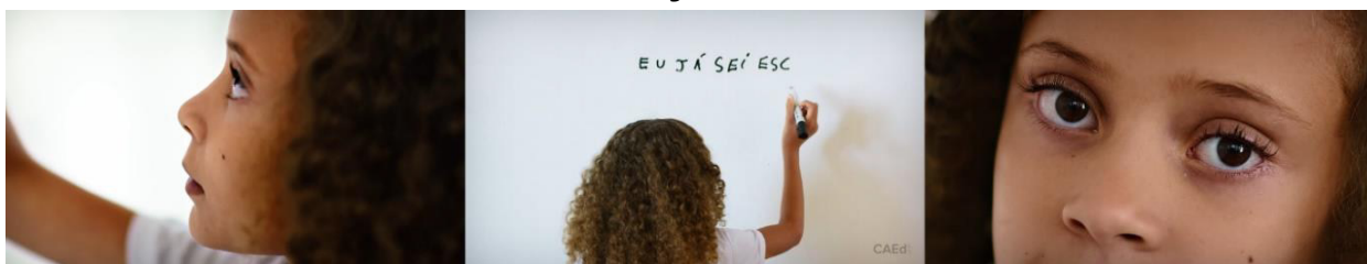
Figura 3: Sequência 02 de Frames vídeo Plataforma Compromisso Nacional Criança Alfabetizada

Desenvolvemos uma estrutura narrativa que parte de uma cena inicial harmoniosa: crianças escrevendo a mesma frase em um mesmo ritmo, Figura 2. E, assim, preparamos uma ruptura dramática: a dificuldade com o encontro consonantal "CR", Figura 3.