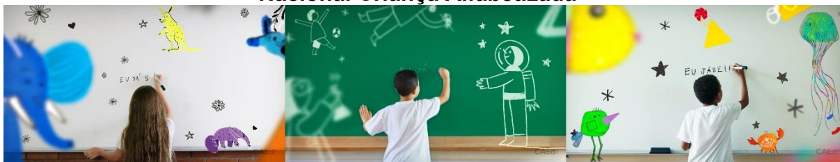
Figura 2: Sequência 01 de Frames vídeo Plataforma Compromisso Nacional Criança Alfabetizada