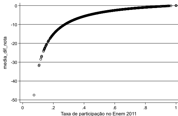
Gráfico 1: Impacto da correção na nota média de matemática – modelo benchmark

No entanto, o impacto sobre a distribuição geral de notas é pequeno como pode ser observado pelos gráficos a seguir. O primeiro gráfico mostra as densidades das notas antes e depois da correção; e o segundo, a variação na ordenação das escolas de acordo com a taxa de participação.