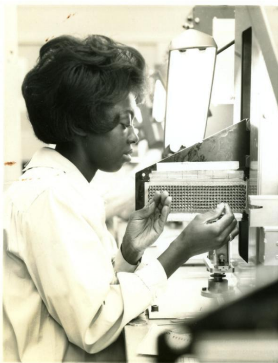
Figura 7: Mulher trabalhando em software integrado ao fio: computador de orientação Apollo

O coletivo colombiano Artesanal Tecnológica 7 , se define no Instagram como “ costureiro/colectivo/laboratório feminista intergeneracional e interdisciplinario ”, e tem como objetivo investigar o fazer dos têxteis e a tecnologia (ARTESANAL, 2025). Trata-se de um projeto proposto pela professora Tania Pérez Bustos, que busca questionar os imaginários socialmente construídos que separam o digital do têxtil, sem impor novas dicotomias. Segundo participantes da Artesanal Tecnológica, a conexão entre o computacional e o têxtil é vasta e histórica. Elas mencionam quando a humanidade foi à Lua, no final da década de 1960 e as memórias que armazenavam informações eram tecidas manualmente (Figura 7).