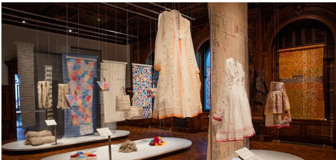
Figura 2: Exposição Scraps: Fashion, Textiles, and Creative Reuse