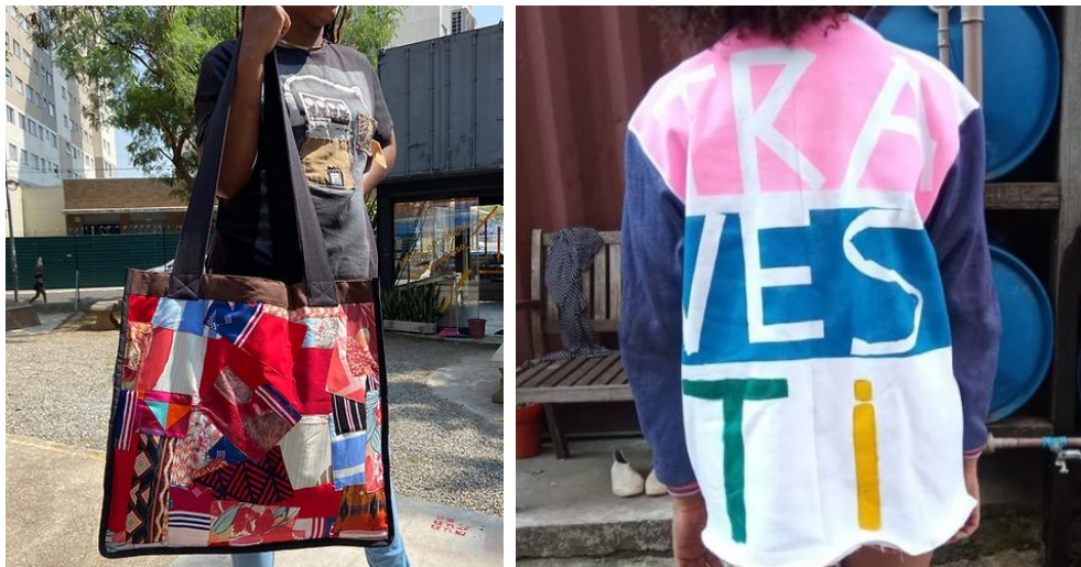
Figura 6: Produtos - Coletivo Tem Sentimento

Na região central de São Paulo, conhecida como "Cracolândia" ou "área do fluxo", um grupo de mulheres trans e cis hackeia o sistema da moda fast fashion com suas máquinas de costura, comunicação em redes sociais, educação não formal por meio das oficinas, venda de produtos (Figura 6) e muita resistência. O Coletivo Tem Sentimento, sediado junto ao Teatro de Container, transforma desperdícios têxteis em geração de renda e cuidado comunitário. O grupo surgiu a partir das ações de Carmem Lopes, que em 2013 trabalhou como orientadora socioeducativa e depois como assistente social durante a implantação do projeto Braços Abertos (Lopes, 2020). Carmem realizava oficinas de autocuidado e confecção de calcinhas para mulheres em situação de rua, um item que raramente recebem por doações. Durante a pandemia, entre 2020 e 2021, o coletivo produziu máscaras, bolsas para guardar cobertores feitas com retalhos de tecido, distribuiu kits de higiene e marmitas para a população em situação de vulnerabilidade social. Carmem conta que a ideia das oficinas de costura surgiu de suas memórias de infância, ao lembrar da mãe e da avó costurando. “Acho que é isso, né? Costurar histórias”, conta Carmen (Lopes, 2021).