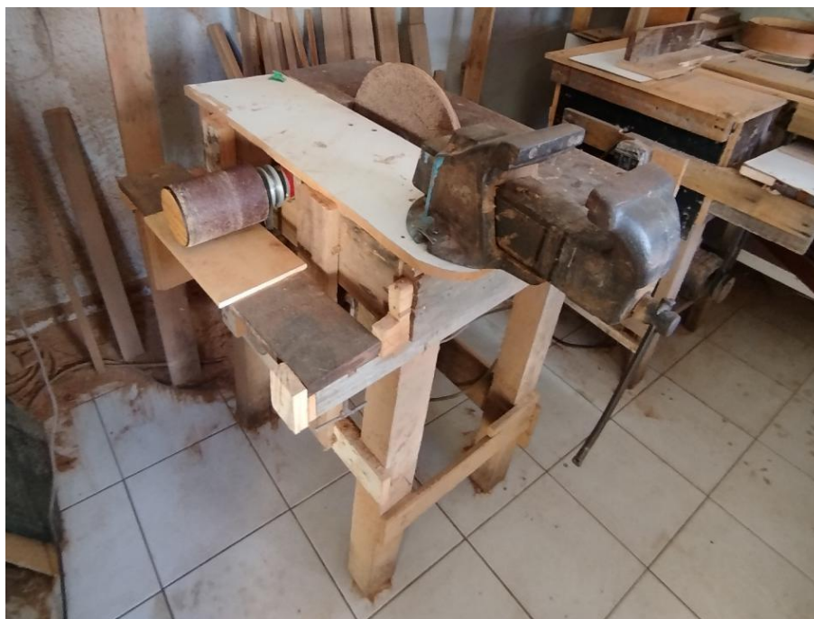
Figura 6 - lixadeira de acabamento, invento do mestre Elivaldo

Outra coisa foi a instalação de um sistema de proteção deste tarugo, que evita que pedaços de madeira atinja o artesão durante a lida, como também ampliou a mesa, em coerência com o tarugo, de suporte por onde as lâminas de madeira deslizam para serem desbastadas. Isso agilizou bastante o processo já dito do afinamento de tampos. Antes eram várias passadas limitadas pela potência do motor e pouco comprimento de desbaste. Agora, a mesma qualidade é alcançada com poucas passadas da lâmina pelo maquinário.