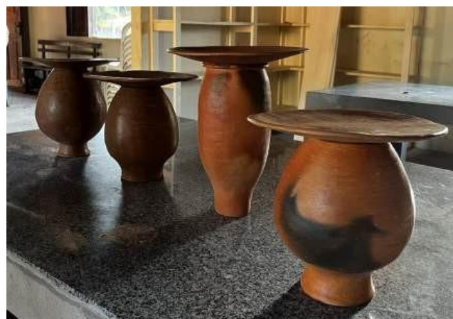
Figura 10 - Proposta de uso de peças cerâmicas como suportes expositivos no museu, valorizando a produção local.

Outro desdobramento possível é a proposta de utilizar a própria produção cerâmica como elementos expográficos. Como mostra a figura 10 a seguir, com potes dispostos de cabeça para baixo com pratos sobrepostos sugeridos como suportes para outros artefatos e elementos narrativos.