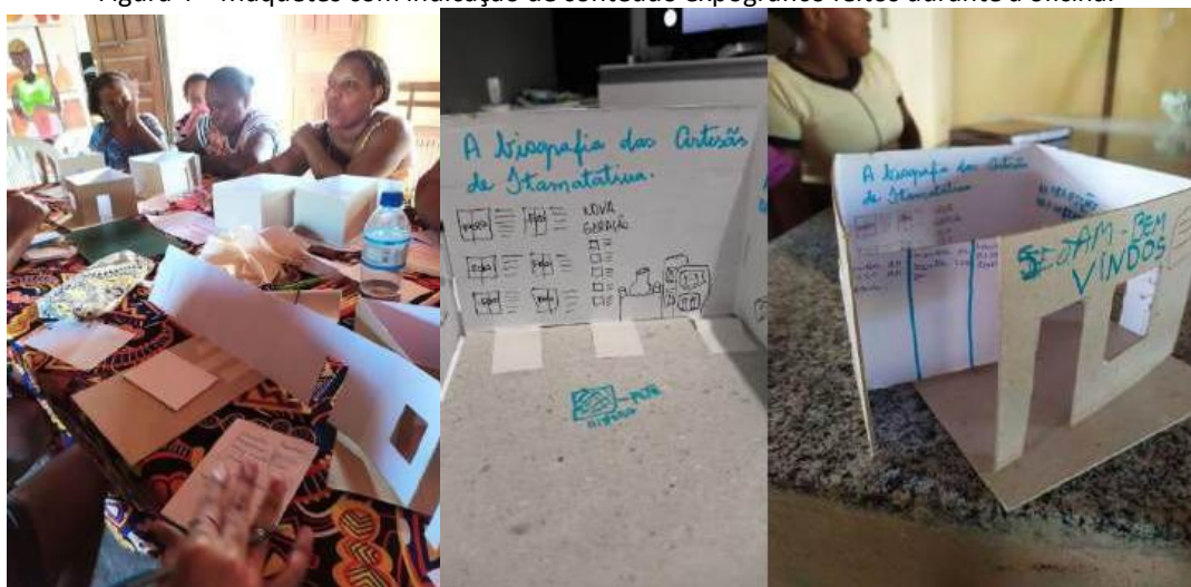
Figura 4 - Maquetes com indicação de conteúdo expográfico feitas durante a oficina.

As maquetes, inicialmente simples folhas de papel cartão, transformaram-se em densas cartografias da memória coletiva, que materializaram o vir a ser do espaço físico e a concepção que a comunidade tem de si e de como deseja ser percebida.