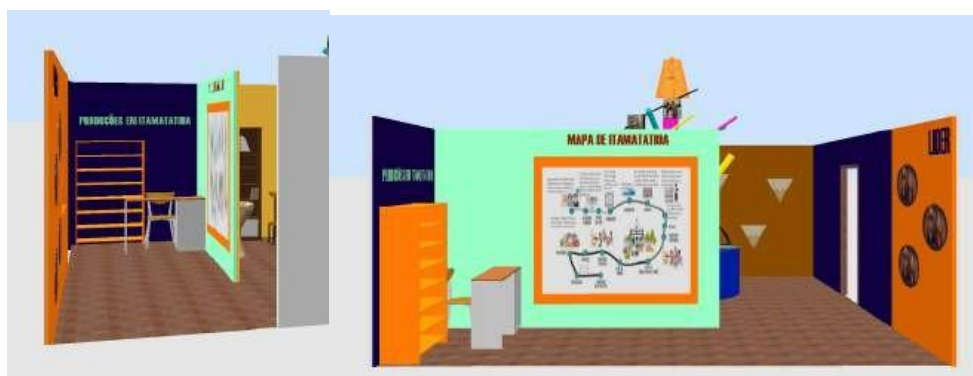
Figura 5 - 3D indicando o conteúdo expográfico que irá constar na recepção do museu.

Começamos pela fachada que contará com a identidade visual do Museu e uma intervenção artística que faça referência ao saber-fazer da cerâmica. Na recepção o museu contará com uma mesa onde ficarão expostos artigos característicos de Itamatatiua, além de um caderno para os visitantes registrarem seus nomes. Atrás dessa mesa, haverá uma estante com produções já desenvolvidas em Itamatatiua, incluindo livros, dissertações e outras obras literárias. Logo na entrada, ainda na recepção, haverá um mapa ilustrado de todo o território de Itamatatiua, a proposta é que o visitante já tenha contato com pontos do território que os moradores consideram importantes na construção de sua memória e história.