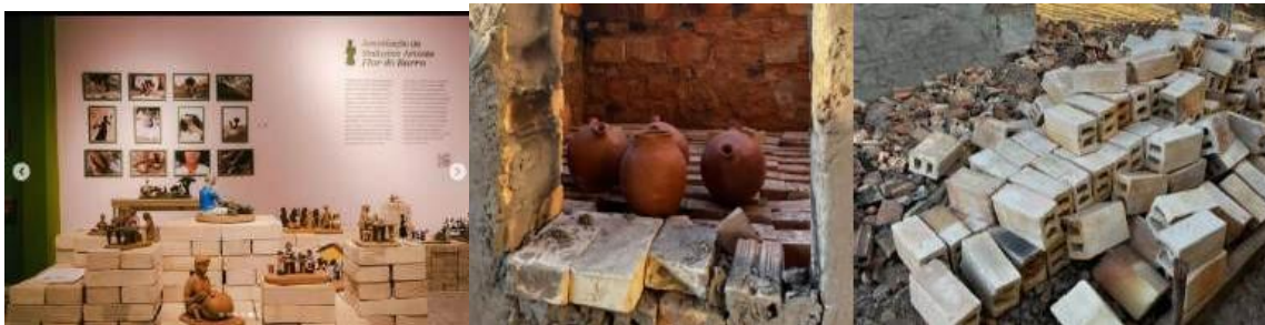
Figura 11 - Referência do uso de tijolos cerâmicos em exposição e os tijolos disponíveis no espaço das ceramistas em Itamatatiua.