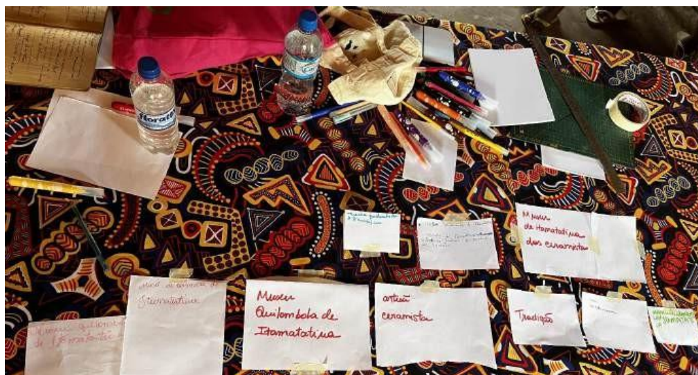
Figura 2 - Momento da oficina participativa com artesãs e estudantes para definição do nome e da narrativa do Museu Quilombola de Itamatatua.

O consenso construído resultou no nome "Museu Quilombola de Itamatatua", um nome que prioriza a identidade territorial e política sobre a função produtiva. Significativamente, foram os estudantes que propuseram o subtítulo "Arte e Cultura", evidenciando seu papel como mediadores entre tradição e contemporaneidade e ampliando o escopo representacional do espaço.