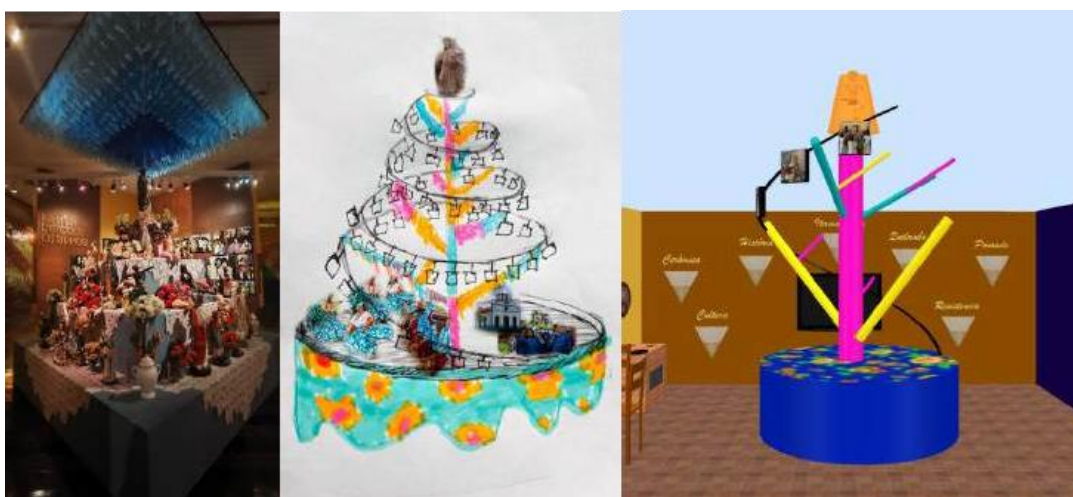
Figura 7 - Marcação do local onde possivelmente estará a instalação sobre o festejo de Santa Tereza.

No salão de exposição, que é o segundo cômodo, a proposta é que haja uma instalação no centro representando os acontecimentos do festejo de Santa Tereza. A figura 7, abaixo, mostra as referências utilizadas e uma representação 3D simplificada só para marcação da ideia no espaço.