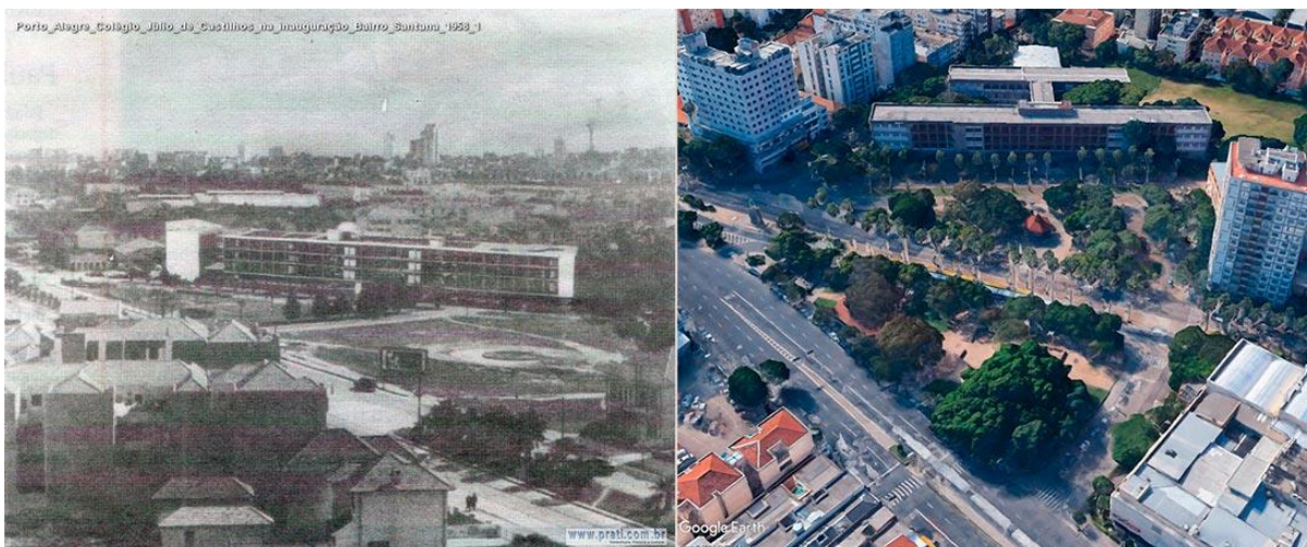
Figura 4 - Imagem comparativa do ponto nodal déc. 50 e 2018.

Em pesquisas no Arquivo Histórico Municipal de Porto Alegre, no rol de arquivos do Colégio Júlio de Castilhos, foi encontrada uma implantação, com título no qual apenas se compreende “dos imóveis a serem desapropriados”. O documento registra uma série de desapropriações de terrenos a serem feitas na face oeste da já implantada Praça Piratini,