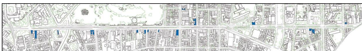
■ Edifícios de Apartamentos modernos identificados pela Pesquisa

Hoje a Radial é caracterizada por uma verticalização que se acentua próximo ao Centro da Cidade e que se dissolve à medida que se afasta do mesmo. Ainda abriga em seu perímetro algumas edificações neo-coloniais, sobreviventes de um plano de modernização aliada à verticalização e substituição do colonial pelo moderno. A verticalização de fato ocorre tardiamente, visto que a área foi tardiamente valorizada apenas após o Centenário Farroupilha (1935). Nessa época, o Campo da Redenção é adaptado para abrigar a maior feira internacional agrícola e industrial que houve em Porto Alegre.