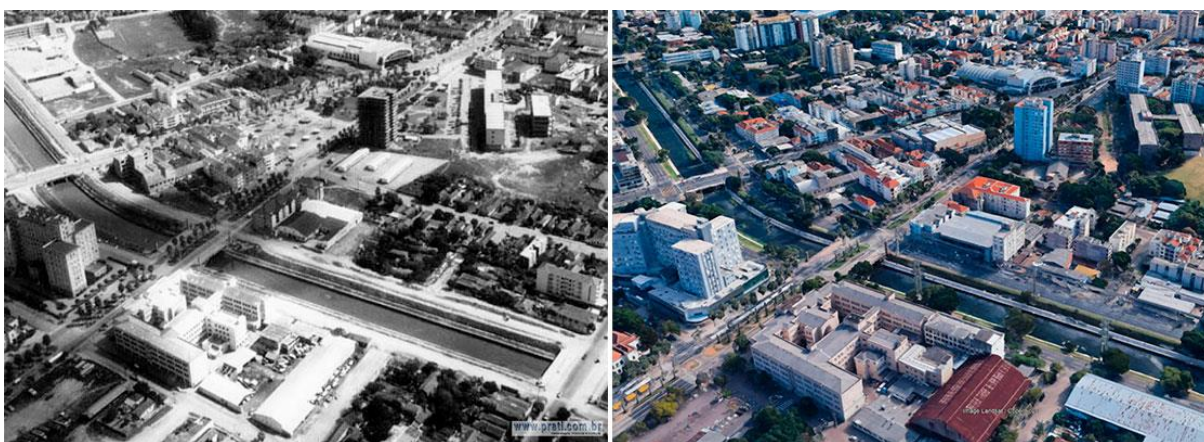
Figura 3 - Imagem comparativa do ponto nodal déc. 50 e 2018.

A Avenida Ipiranga é um eixo viário, de escala monumental, em comparação com os gabaritos de ruas da cidade de Porto Alegre. É uma das vias integradoras entre Porto Alegre e a Região Metropolitana à leste da capital. Possui seu princípio entre a margem sul do Rio Guaíba e culmina na Avenida Bento Gonçalves, na sua extremidade mais próxima da zona leste da cidade de Porto Alegre com o limite da região Metropolitana – a cidade de Viamão.