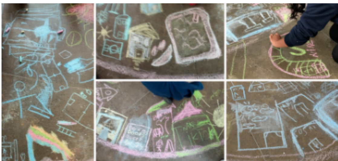
Figura 7: Desenhos feitos pelas crianças

Os percursos feitos durante os registros do walkthrough mostraram uma grande intimidade dos participantes com os espaços da escola, assim como de suas dinâmicas de usos segundo o cronograma de horários, regidos pelo sinal sonoro dos diferentes recreios ao longo do dia. Sendo feitos de giz de quadro, o risco de apagar o desenho já feito se converteu em possibilidade de redesenhar e contribuir na remontagem dos desejos em relação, abdicando de noções de autoria e fortalecendo a concepção de uma atividade coletiva (Figura 7). Esses gestos, por vezes sutis, contribuíram para ampliar nosso olhar sobre a escola, não apenas como edifício, mas como território vivido, apropriado e constantemente (re)inventado pelas crianças.