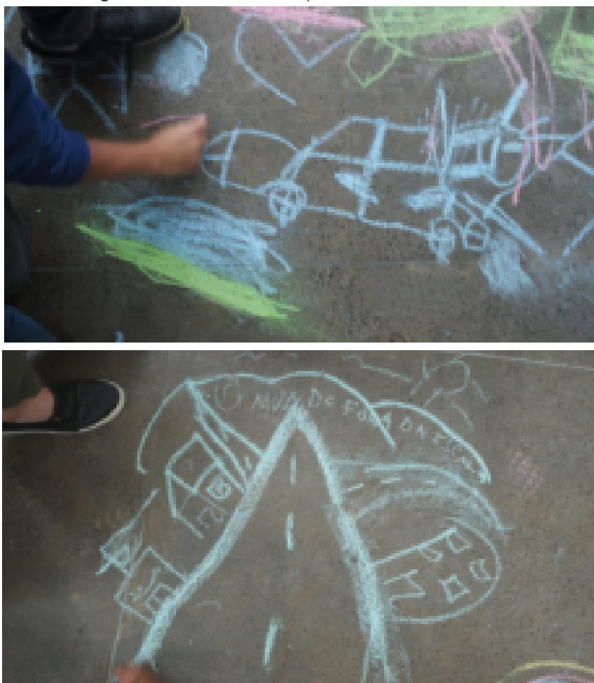
Figura 8 e 9: Desenhos do que cabe fora da escola 1

Por outro lado, na elaboração do que cabia fora da escola (Figuras 8 e 9), elementos da paisagem natural e urbana - da escala do incomensurável - expressaram um entendimento da escola também enquanto programa de usos definidos e delimitados espacialmente.