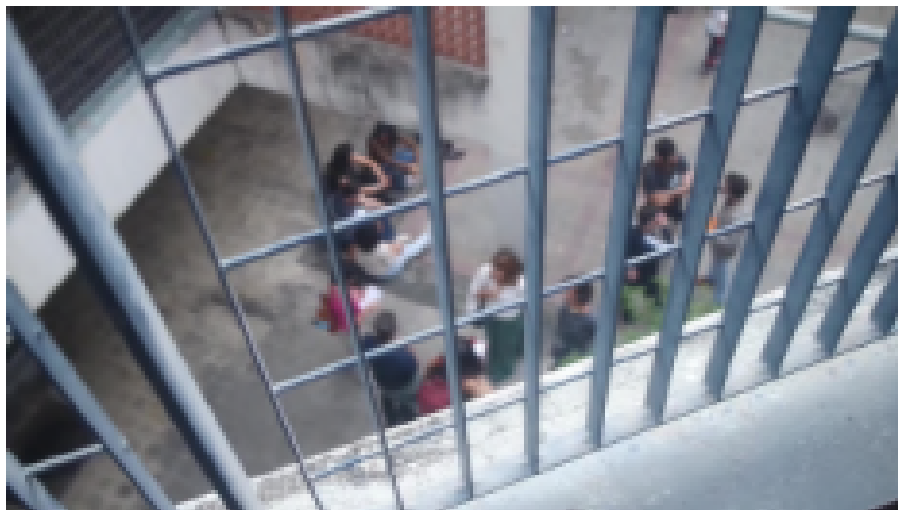
Figura 1: Frames dos registros audiovisuais