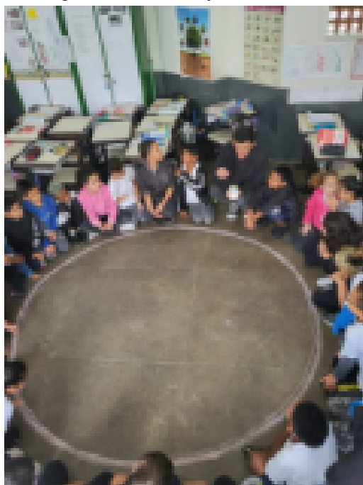
Figura 4 e 5: Formação do círculo

Após essa primeira interação, pedimos que as crianças abrissem o máximo possível do círculo para, com um giz de cera e um barbante, desenhar um círculo no chão, conforme demonstram as Figuras 4 e 5. Inauguramos dentro do círculo uma “outra escola” ideal e imaginária. Um território imaginário a ser preenchido com desenhos a fim de definir o que cabia na nossa escola. Cada uma recebeu um giz colorido e foi convidada a desenhar livremente dentro do círculo. Logo o espaço se encheu de formas, cores, personagens e ideias — um jogo visual coletivo, no qual os desenhos dialogavam entre si, misturando-se, sobrepondo-se e gerando novas narrativas fomentadas pela participação dos pesquisadores