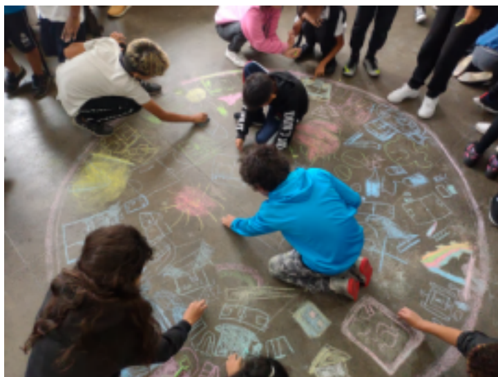
Figura 6: Processo de desenho

O movimento do corpo no espaço, seja caminhando pela escola, como em uma roda em sala de aula, proporcionou um olhar lúdico e pessoal intrincado com a realidade concreta do espaço e ambiência escolar, mobilizando aspectos subjetivos e complexos a partir de uma expressão de sua autonomia (Figura 6). Foi possível, portanto, entre o movimento individual e coletivo, a construção de um olhar intersubjetivo capaz de manifestar resultados tanto objetivos, quanto abstratos sobre os significados da experiência de ocupação da escola.