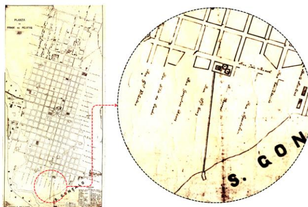
Figura 2 - Mapa da cidade de Pelotas, 1909.

A região das Doquinhas tem sua origem conectada ao Gasômetro 1 instalado em 1875 que contava com uma ampla infraestrutura para seu funcionamento: depósito, casa do fogo, casa das máquinas, setor de purificação, reservatório (balões), oficina de manutenção, oficina de consertos, ferraria, escritório, almoxarifado e residência do mestre do gasômetro. No mapa da cidade de Pelotas de 1909, é possível identificar sua localização, bem como sua ligação com o Canal São Gonçalo por meio de um trapiche (Figura 2).