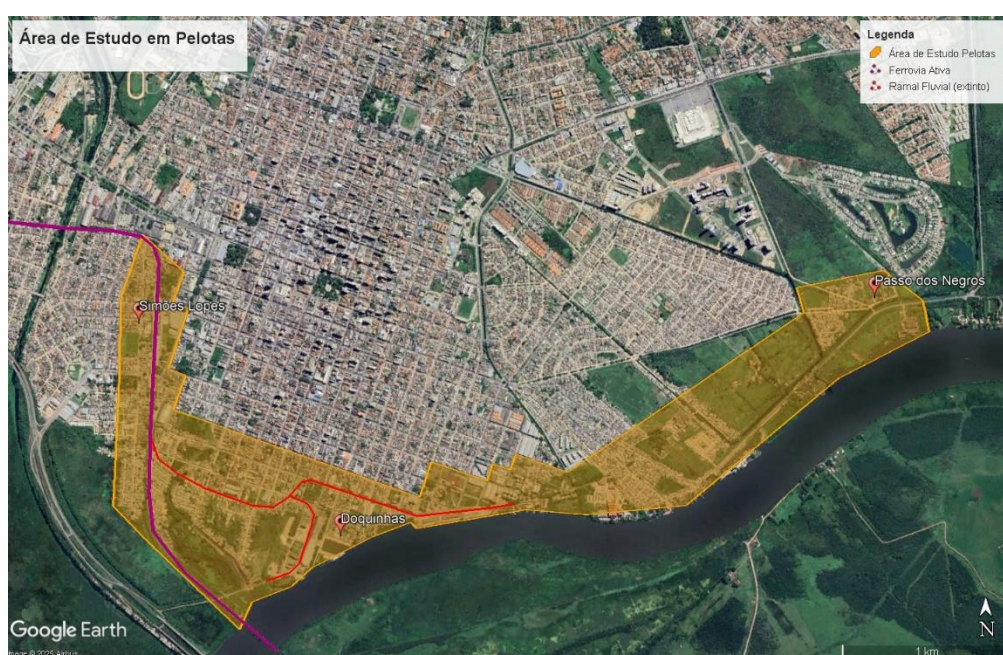
Figura 1: Área de Estudo da Pesquisa na cidade de Pelotas, e as três áreas foco de estudo.