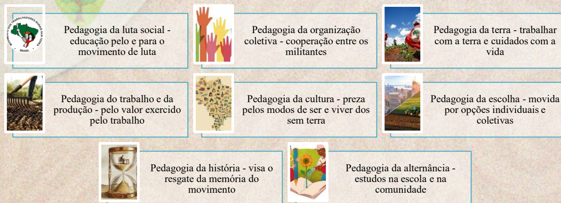
Esquema 2. matrizes pedagógicas implementas pela educação do MST

No horizonte de uma educação funcional que permita a ação reflexiva e autônoma de seus participantes, o MST põe em prática grande parte das pedagogias construídas historicamente, não aderindo a uma vertente pedagógica de forma específica, negando a pedagogia tradicional de transmissão dos conhecimentos. Por conta disso, “o MST desenvolve a filosofia da formação política dos militantes através da participação, na recriação da vida cotidiana, na cooperação em seus diferentes sentidos e no resgate dos valores com novo conteúdo” (Bogo, 2003, p. 161). Filosofia de formação que atua em oito direções simultaneamente, conforme o esquema abaixo.