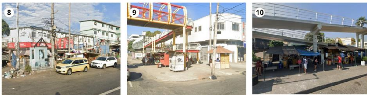
Figura 7 - Brechas 8, 9 e 10