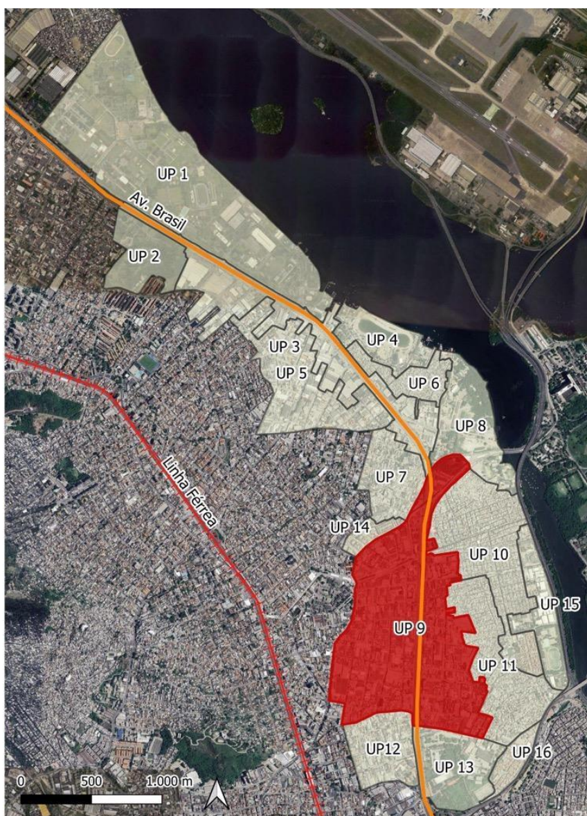
Figura 2 - Unidades de Paisagem identificadas e UP 09 em destaque.

A partir da aplicação da metodologia, foi possível compartimentar a área de estudo em 16 Unidades de Paisagem (Figura 2). Essa compartimentação reflete como as diferentes realidades e instrumentos urbanísticos da região proporcionam um mosaico paisagístico bastante heterogêneo, com muitas características divergentes que propiciam uma atmosfera de desafios e conflitos.