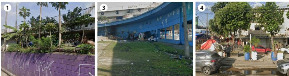
Figura 4 - Brechas 1, 3 e 4