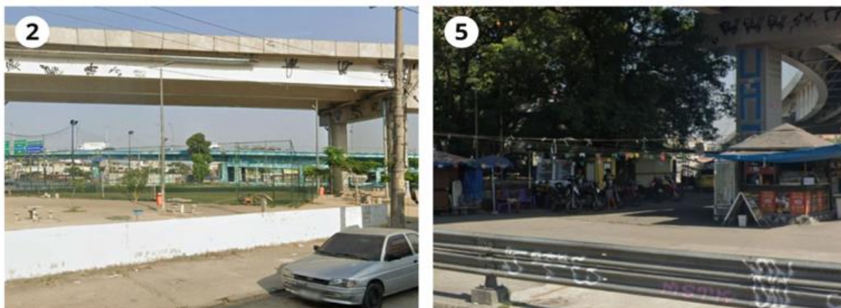
Figura 5 - Brechas 2 e 5