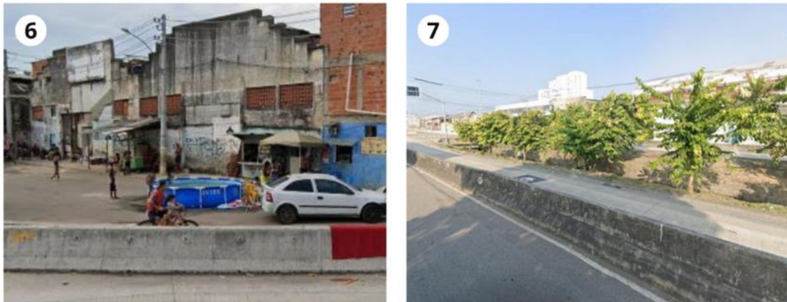
Figura 6 - Brechas 6 e 7