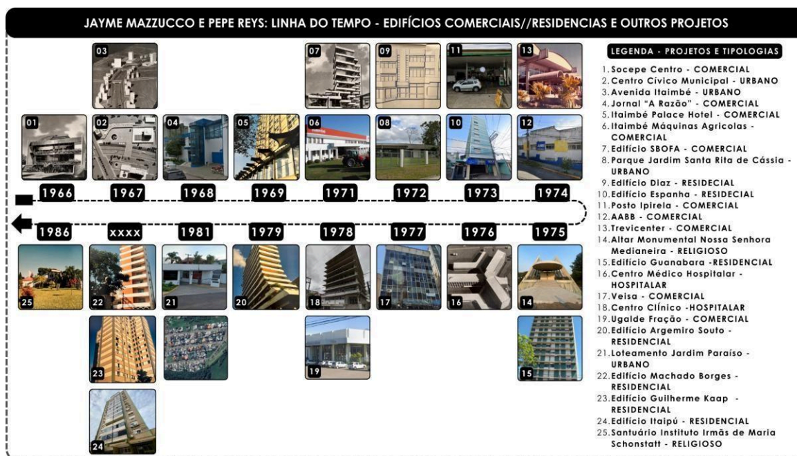
Figura 4 - Projetos verticalizados da dupla entre 1966 a 1986.

Em relação ao acervo construído por Pepe e Jayme, pode-se observar um equilíbrio entre projetos da tipologia do edifício em altura e da tipologia residencial unifamiliar (figura 4). Sobre a tipologia em altura, foram relacionadas cerca de vinte e seis obras onde prevaleceram os edifícios comerciais e residenciais. Além disso, observou-se quatro projetos urbanos e dois projetos de cunho religioso, o que demonstra versatilidade dos arquitetos ao transitar por diferentes programas de necessidades. A figura xx apresenta o compilado de obras em altura assinadas pelo escritório J.M. Reyes – F. Della Méa – J. Mazzucco. Algumas das características presentes nesta segunda fase de criação de Mazzucco, agora, em parceria com Reyes, é a clareza das geometrias e formas puras, o uso da planta livre, a presença dos terraços-jardins, sacadas e varandas e diferentes configurações de brises.