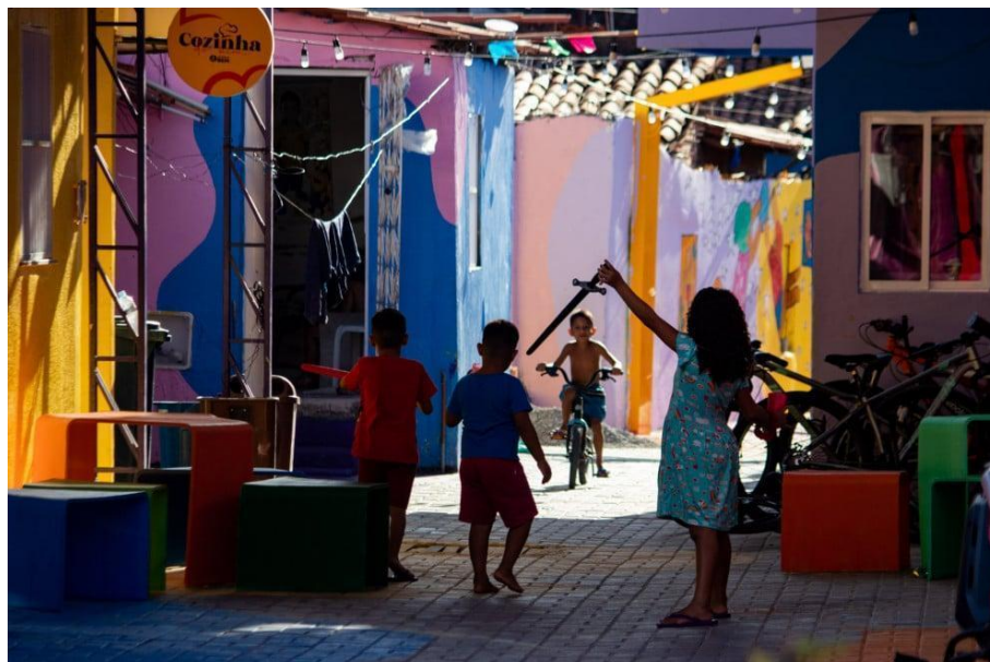
Figura 9 – Crianças brincando no Beco Céu