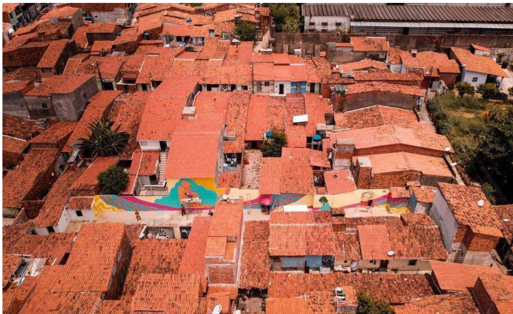
Figura 4 – Imagem aérea do Beco Céu