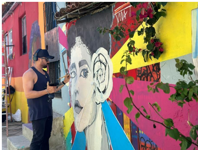
Figura 7 – Mural sendo pintado

As artes que colorem as ruas do Beco Céu foram obras de diversos artistas convidados pela LAB Cidades Criativas, que buscaram criar murais coloridos, perceptíveis na Figura 7, que “trazem a população como protagonista” (LAB Cidades Criativas, 2023). A ideia foi criar uma galeria de arte urbana a céu aberto, integrada com os mobiliários urbanos interativos.