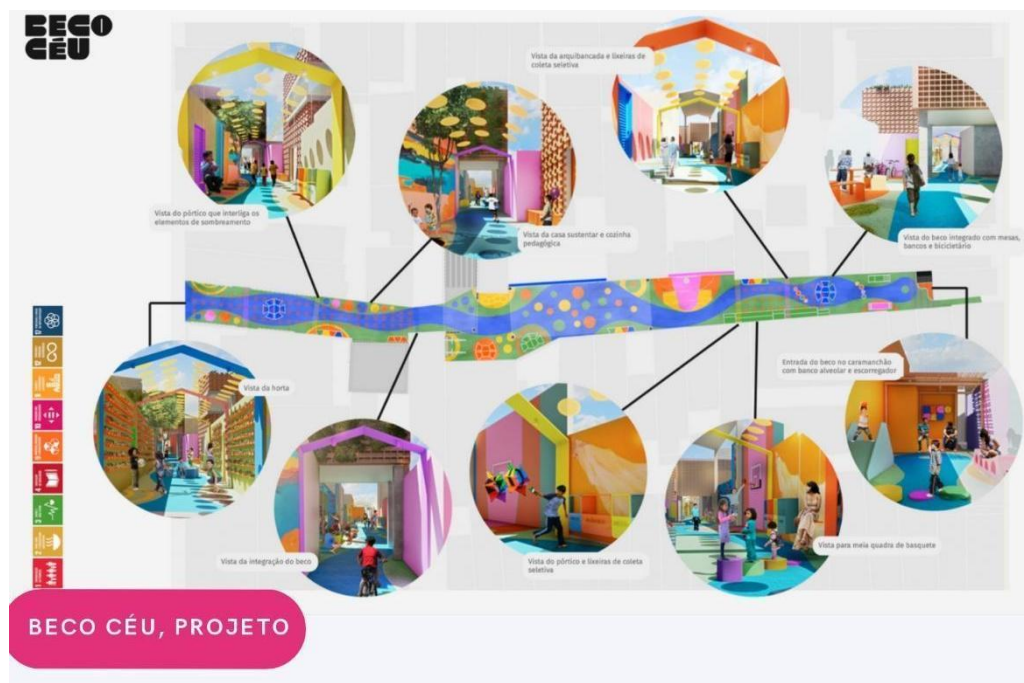
Figura 2 – Projeto Conceitual do Beco Céu

Esse processo de idealização contou ainda com um momento essencial para o processo de cocriação do projeto, o chamado Evento de Validação Festival Beco Céu, onde ocorreu uma exposição interativa para a comunidade. Nesse evento, os moradores tiveram a oportunidade de ver em detalhes o projeto, através de telas e óculos de realidade virtual, e validar todo o projeto conceitual, ilustrado na Figura 2 (LAURB, 2024).