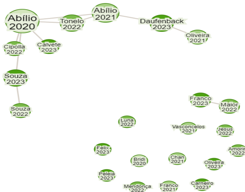
Figura 2. Imagem dos Clusters produzidos pelo Research Rabbit

Com o objetivo de delimitar o campo de produção acerca do tema dos entregadores por aplicativo foi utilizado como ferramenta o mapeador de citações e referências Research Rabbit , ele tem como principal função mapear e gerar clusters entre os autores que possuem maior compatibilidade dentro de uma base de dados. No caso dessa pesquisa, o Research Rabbit foi integrado à ferramenta do Zotero e analisou as relações entre os 29 artigos incluídos para a leitura, como demonstra a imagem 1.