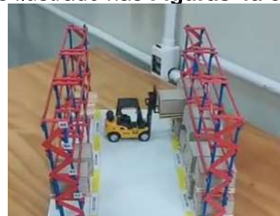
Figura 4b: Maquete em perspectiva