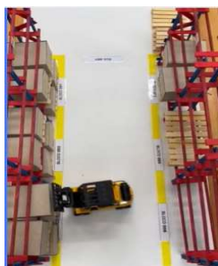
Figura 4a: Maquete vista superior

Com a escala e o layout previamente definidos, deu-se início à construção dos principais elementos da maquete, como as estruturas, a rua central, a área de recebimento de materiais, os paletes e as embalagens. Os paletes foram confeccionados com palitos de madeira, seguindo o padrão PBR, com dimensões reduzidas proporcionalmente para 1,00 x 1,20 cm. As estruturas selecionadas foram porta-paletes convencionais, também construídos com palitos de madeira, com dimensões proporcionais de 2,40 x 3,00 x 0,80 cm. O resultado final foi uma maquete construída sobre uma base de 60 x 30 cm, na escala 1:20, representando seis módulos de estantes porta-paletes, conforme ilustrado nas Figuras 4a e 4b .